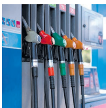
Gesamtwert von 10.000 Euro. Der Rhein Main Verlag beteiligt

Obertshausen (NZO) Die Bundesregierung entlastet Autofahrer: Ab dem 1. Mai soll der Spritpreis um rund 17 Cent pro Liter sinken. Eine gute Nachricht – und wir gehen noch einen Schritt weiter. Der Rhein Main Verlag sorgt gemeinsam mit der EGRO Mediengruppe dafür, dass unsere Leserinnen und Leser noch mehr entlastet werden. Wir verlosen Tankgutscheine im