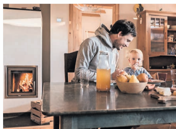
Wer sich frühzeitig über alternative Heizsysteme informiert, ist im Winter unabhängiger von externen Entwicklungen.