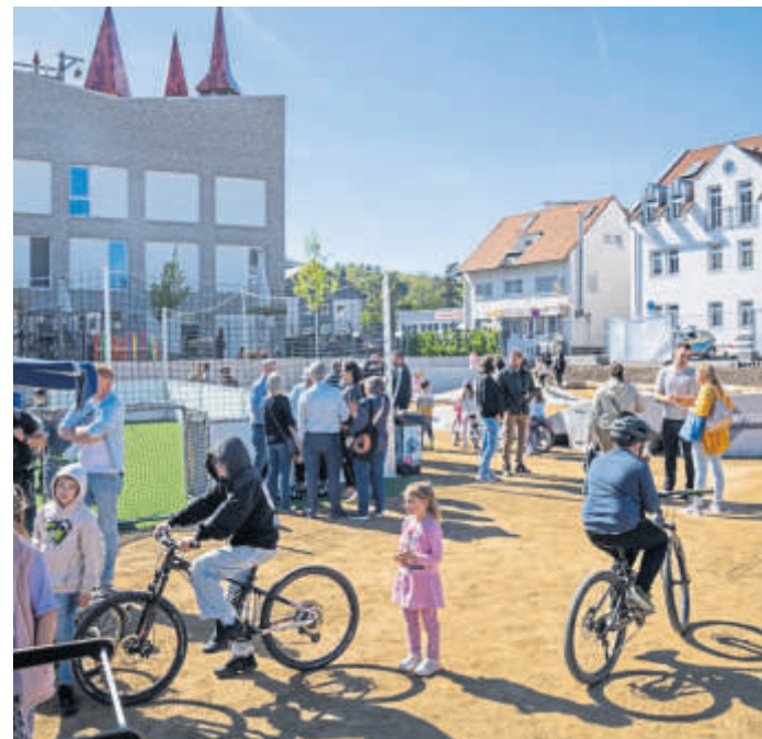
Die Kinder und Jugendlichen waren mit Rädern gekommen, um den Pumptrack gleich auszuprobieren.