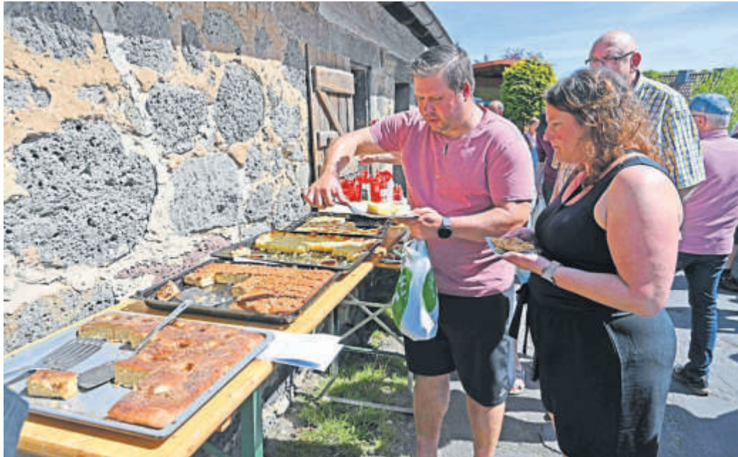
Unterschiedliche „breite“ Kuchen fanden reißenden Absatz.