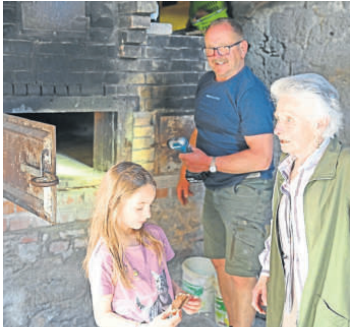
Geschichtsunterricht am brennenden Objekt.