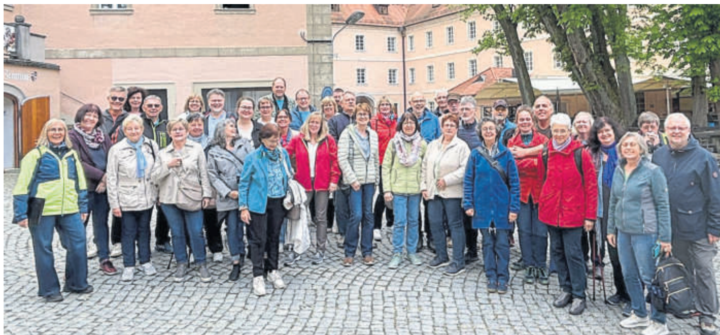
Gute Stimmung herrschte beim zweitägigen Ausflug der Chorgemeinschaft Harmonie Ulmbach.

Kloster- und Kirchenbesichtigung der Klosterkirche St. Georg die Gelegenheit hatten, in der Klosterkirche zu singen. Nach Stärkung im klosterreigen Biergarten machte sich die Gruppe voller Eindrücke auf die Heimreise. In guter Stimmung und mit fröhlichem Gesang erreichten die Sängerinnen und Sänger am frühen Abend Ulmbach. BWB