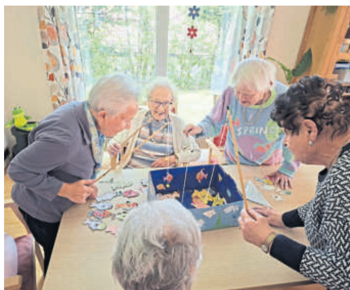
In der Tagespflege herrscht bei geselligem Spiel eine fröhliche Atmosphäre.

Kontakt Familie Mat – Ambulante Pflege und Tagespflege Am Elmacker 1 Schlüchtern Telefon: (06661) 919660 Fax: (06661) 919662 E-Mail: pflege@mobil-mat.de Internet: mobil-mat.de