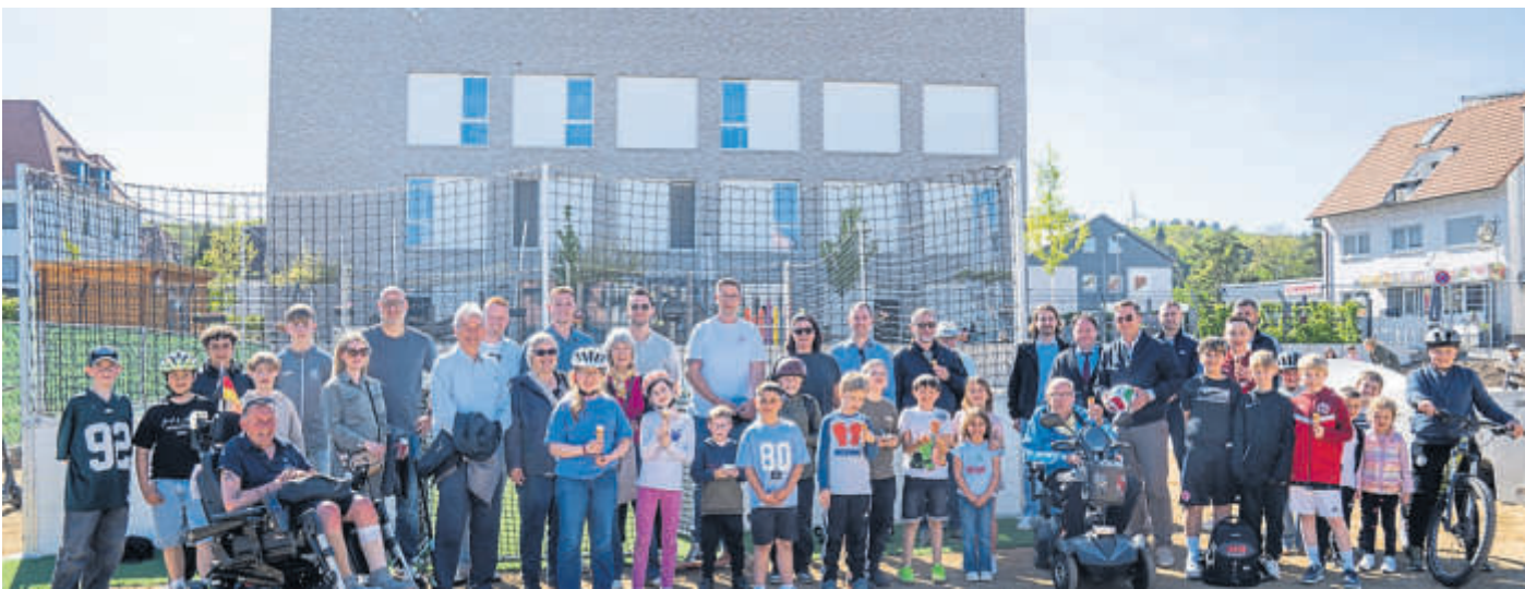
Gutes Wetter, gute Stimmung: Viel los war am Tag der Eröffnung von Soccerfeld und Pumptrack auf dem Areal zwischen KuBe und Neuem Obertor.

HUTTEN – Das Freibad Hutten ist in der diesjährigen Sommersaison vom 1. Juni bis zum 30. August geöffnet. Die Öffnungszeiten: Montag, Dienstag, Donnerstag und Freitag von 13.30 bis 19.30 Uhr; Mittwoch, Samstag und Sonntag von 11 bis 19.30 Uhr. Letzter Einlass ist jeweils eine Stunde vor der Schließung des Bades. BWB