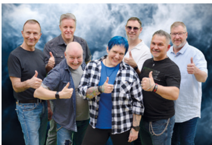
ENDORPHINE 2026.

In den vergangenen drei Jahren sorgten die ENDORPHINE insbesondere auf Darmstädter