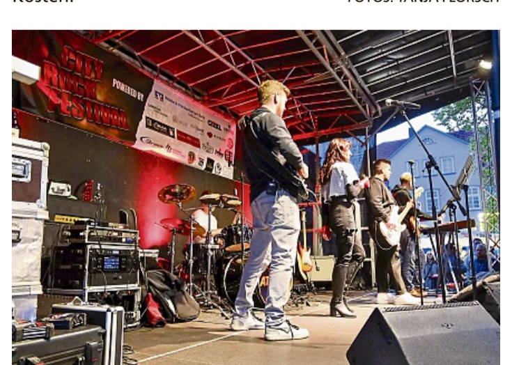
Schluss-Act: Die Band „ATTIXX“ aus Höxter covert Songs aus fast jeder Dekade und sorgte für Festival-Feeling in Bad Arolsen.

Die Zuschauer beim Cityrock-Festival auf dem Arolser Kirchplatz kamen bei den Darbietungen der Bands voll auf ihre Kosten.