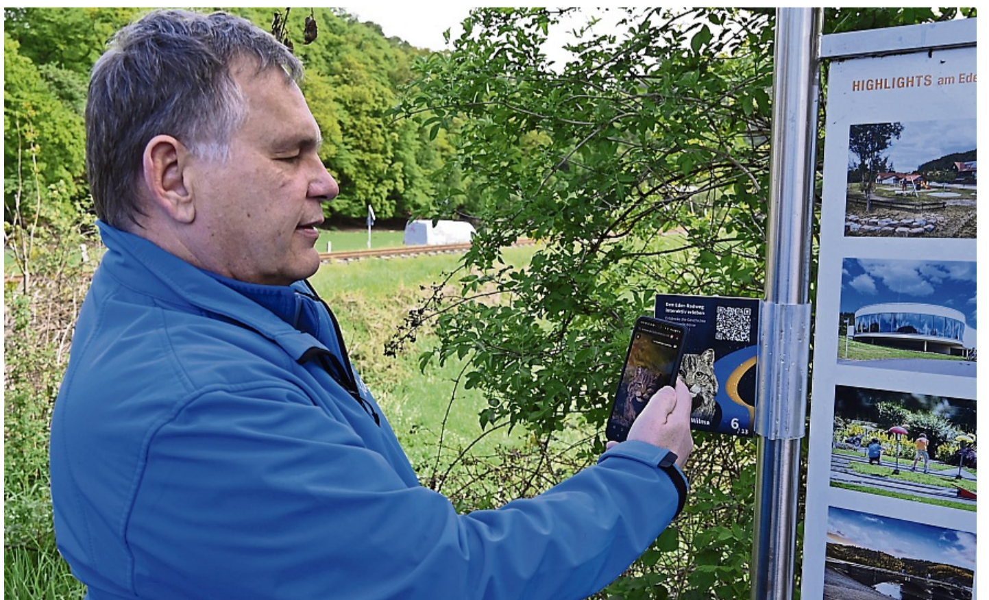
Mit der Handykamera wird der QR-Code gescannt. Dann kommt man auf die Website, auf der der jeweilige lokale Charakter ein interaktives „Gespräch“ startet.