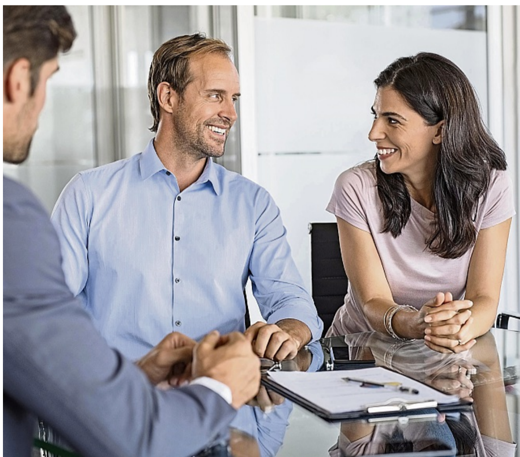
Vergleichen kann sich lohnen: Bei einer auslaufenden Zinsbindung sind Hauseigentümer gut beraten, verschiedene Angebote einzuholen.

Eine Anschlussfinanzierung ist nicht nur ein notwendiger Schritt, sie bietet auch Gelegenheit, die Baufinanzierung strategisch neu auszurichten. So kann es sinnvoll sein, Modernisierungskosten einzuplanen. Viele Banken sind offen dafür, zusätzliche Beträge in das Darlehen zu integrieren, beispielsweise für eine energetische Sanierung oder größere Renovierungen. So lassen sich zusätzliche Kredite vermeiden, die später oft zu ungünstigeren Konditionen aufgenommen werden müssten. djd