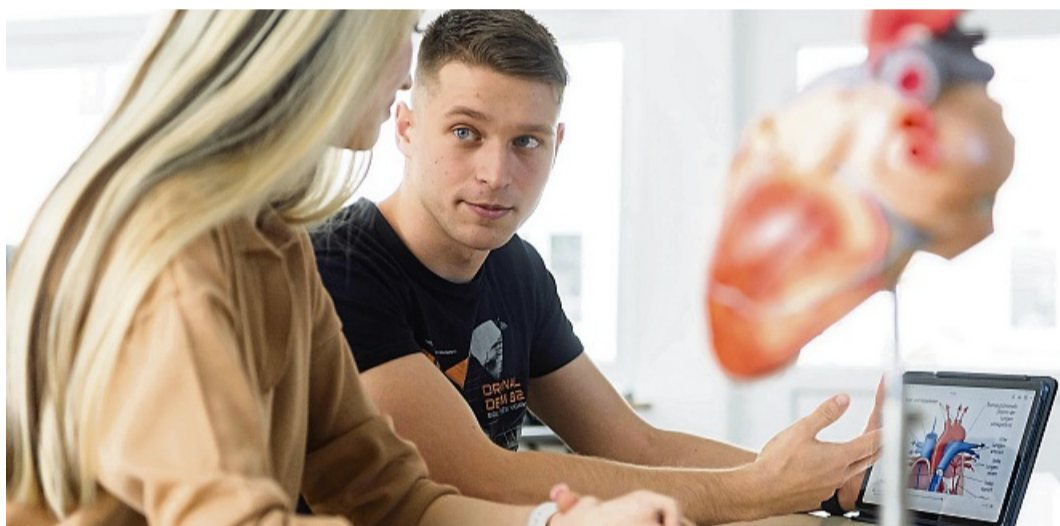
Die Pflegeausbildung am Korbacher Stadtkrankenhaus ist vielfältig und spannend.

Info www.hewi-azubis.de und auf Instagram.