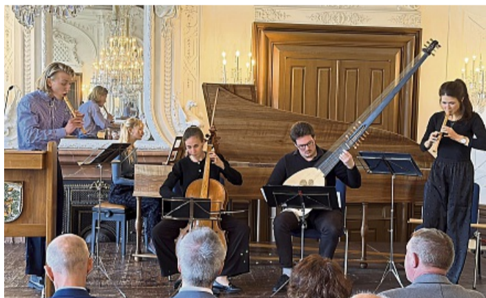
Das junge Ensemble Interchange spielte zur Festspiel-Eröffnung im Steinernen Saal des Residenzschlosses.

Dorothee Oberlinger für eine hohe Qualität der Darbietungen und bewiese damit, dass Kultur nicht nur in den großen Städten stattfinden müsse.