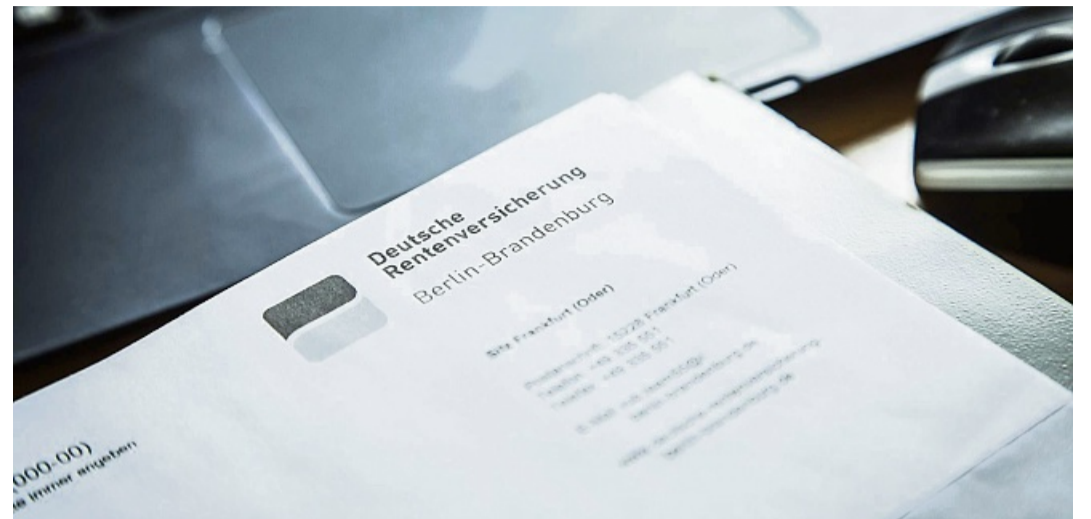
Der Rentenbescheid zeigt zum Beispiel auf, wie sich der hochgerechnete Rentenanspruch im Zuge der jährlichen Renten Anpassung entwickeln könnte.

Die Deutsche Rentenversicherung empfiehlt, das Schreiben zunächst sorgfältig zu prüfen. Insbesondere sollte die Renteninformation von 2026 gespeicherte Daten bis zum 31. Dezember 2025 enthalten. Tut sie das nicht, hilft eine Nachfra-