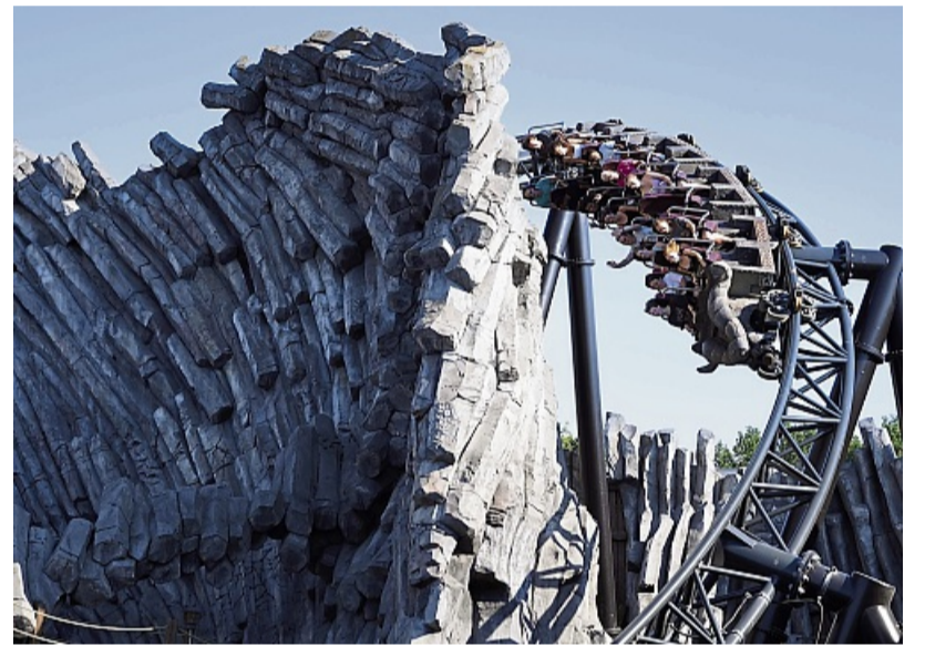
Die High-Speed-Achterbahn Taron gilt als schnellster Multi-Launch-Coaster mit vier Weltrekorden und Fahrspaß der Superlative.

12 bis 17 Jahren gemeinsam mit den kommunalen Jugendhäusern in Bad Wildungen, Volkmarsen und Frankenberg anbietet. Das Angebot ist kostenfrei und beinhaltet die Hin- und Rückfahrt, den Eintritt in den Freizeitpark und einen Mittagssnack. Anmeldungen sind online ab dem 21. Mai ab 8 Uhr möglich – und zwar online über die Webseite des Landkreises Waldeck-Frankenberg unter www.landkreis-waldeck-frankenberg.de/veranstaltungen .