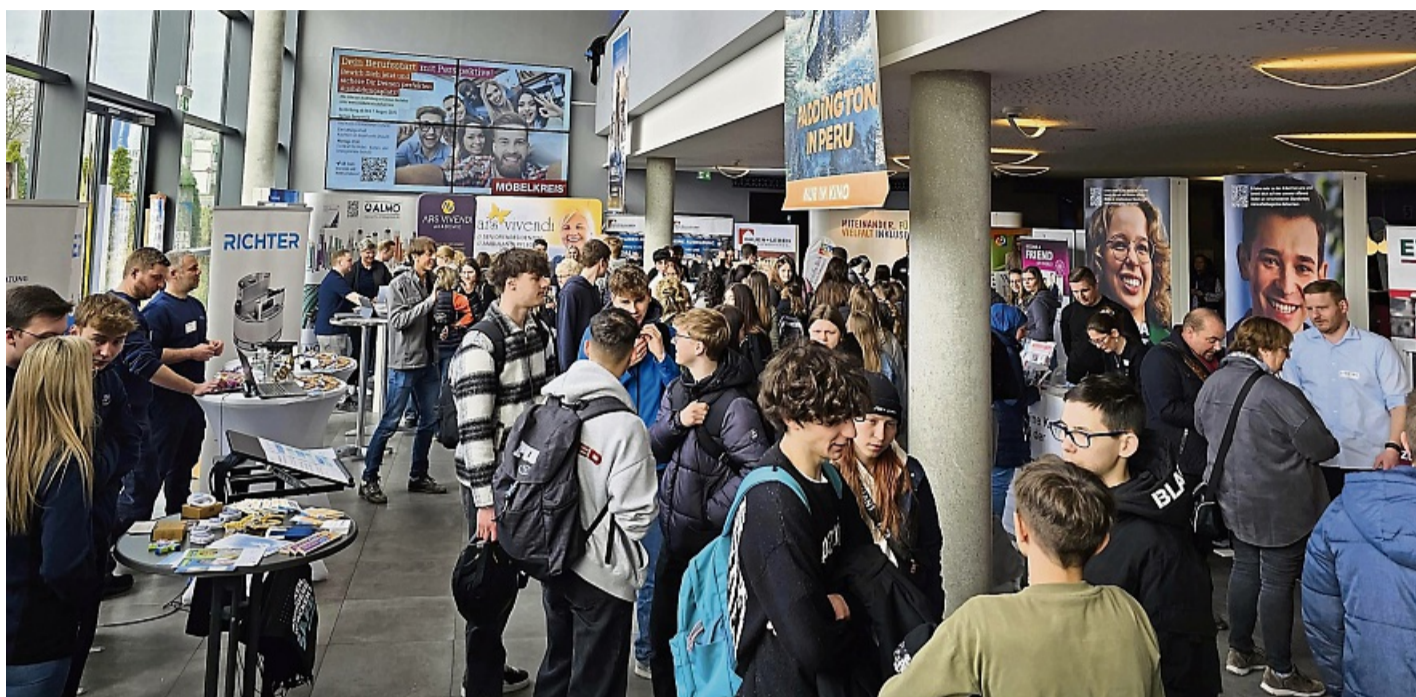
Gelegenheit zum Informieren und Kontakte knüpfen. Beim Jobday im Korbacher Kino im vergangenen Jahr war viel los.