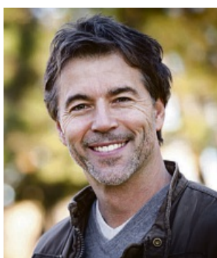
„Seit Tagen habe ich keine Schmerzen mehr im Knie. Auch nachts nicht. Ich werde die Tropfen weiter nehmen!“ (Klaus W.)

Für Ihre Apotheke: Rubaxx Arthro (PZN 15617516) www.rubaxx.de