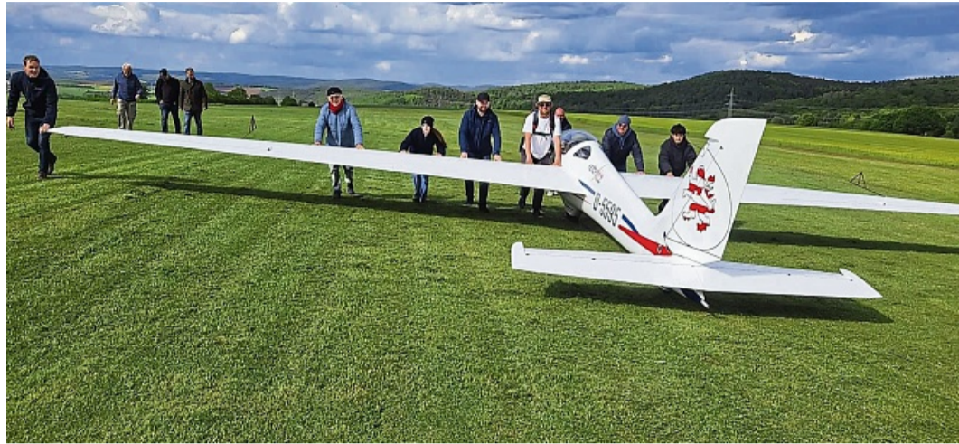
25 Mitglieder der Flugsportvereinigung Bad Wildungen nahmen am Sicherheitstraining auf dem Flugplatz teil.

Schon früh am Morgen herrscht reger Betrieb auf dem Flugplatz. Immer wieder zieht das Schleppflugzeug, das sich der Verein vom Flugplatz Wald-