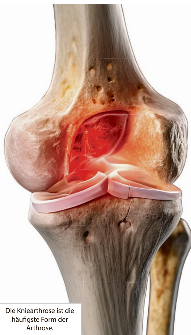
Die Kniearthrose ist die häufigste Form der Arthrose.

Ein typisches Zeichen ist der „Anlaufschmerz“. Dabei verspüren Betroffene beim Loslaufen auf den ersten Metern ein Ziehen, z. B. in der Hüfte oder im Knie. Arthrose beginnt außerdem in vielen Fällen damit, dass sich die Gelenke steif anfühlen oder anschwellen. Später kommt häufig ein Belastungsschmerz hinzu.