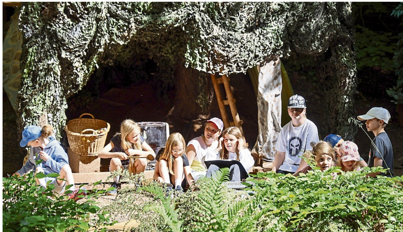
Proben auf der Freilichtbühne Twiste: Bereit für die große Bühne: Die jungen Darstellerinnen und Darsteller freuen sich als „verlorene Kinder“ auf ihren Einsatz.