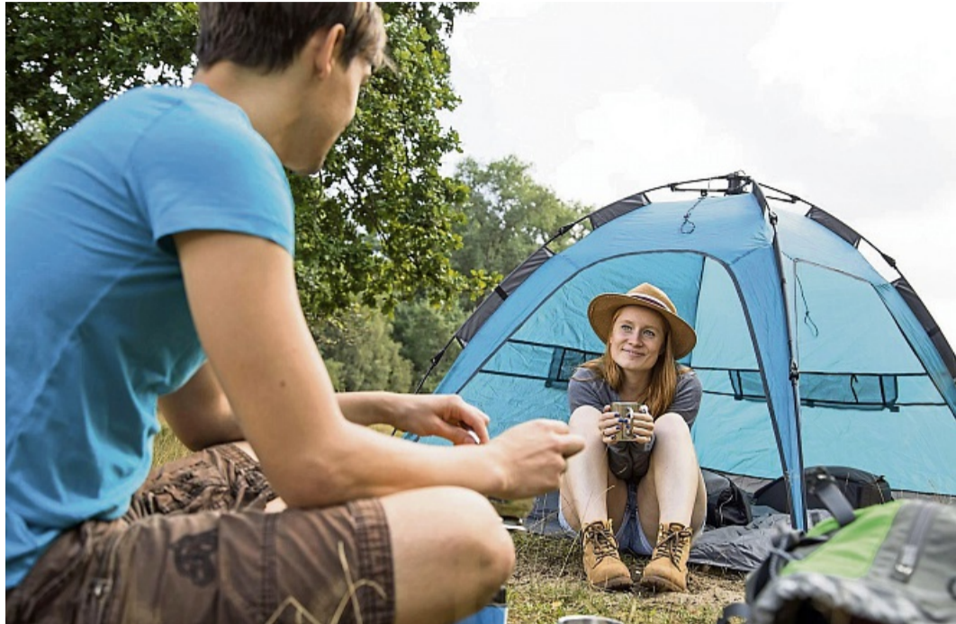
Die Produktauswahl ist beim Zelten schon die halbe Miete für angenehme Nächte.

Eine Option für alle, die schon einen Schlafsack besitzen: ein Seiden-Inlett. Es wiegt wenig, nimmt kaum Platz im Rucksack weg und kühlt leicht, wenn man es alleine – also ohne Schlafsack – als Decke verwendet, wie Gnielka erklärt. Packt