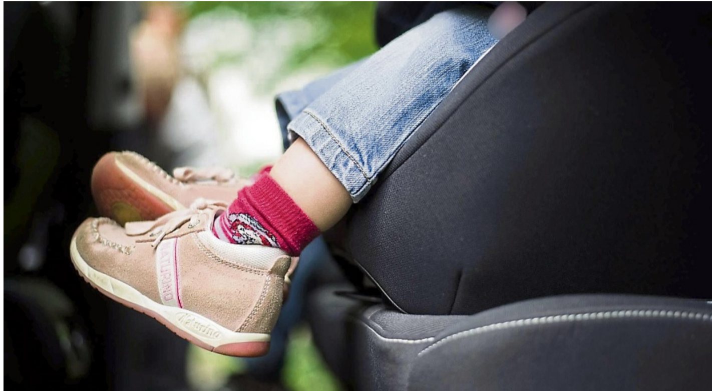
Blindkäufe vermeiden: Der ADAC empfiehlt, Kindersitze vor dem Kauf im Fachhandel zu testen, um die Passform für Kind und Auto sicherzustellen.

Gute Nachrichten auch bei einigen Schadstoffen: In keinem der getesteten Kindersitze haben die Tester umweltbelastende PFAS („Ewigkeitschemikalien“) – gefunden. Beim letzten