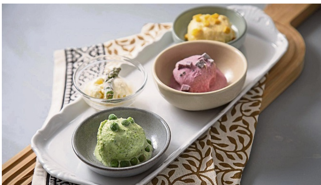
Ob aus Erbsen, Spargel, Rote Bete oder Mais - es gibt viele Varianten von cremigem Gemüse-eis.