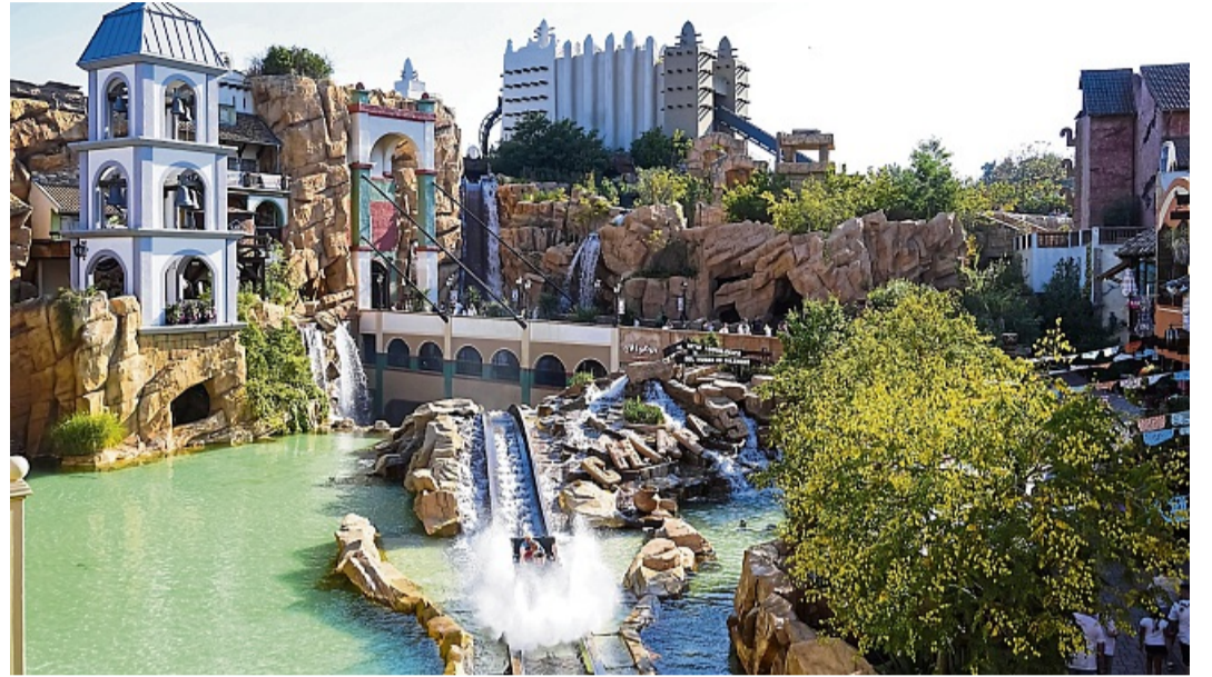
Chiapas ist eine Wildwasserbahn im Phantasialand.

Waldeck-Frankenberg – Zu einem kostenfreien Ausflug lädt der Landkreis Waldeck-Frankenberg Kinder und Jugendliche am 12. September in das Phantasialand nach Brühl ein. Dort erwartet sie ein abwechslungsreicher Tag mit zahlreichen Attraktionen und gemeinsamen Aktivitäten. Eine Anmeldung ist seit Donnerstag, 21. Mai, möglich.