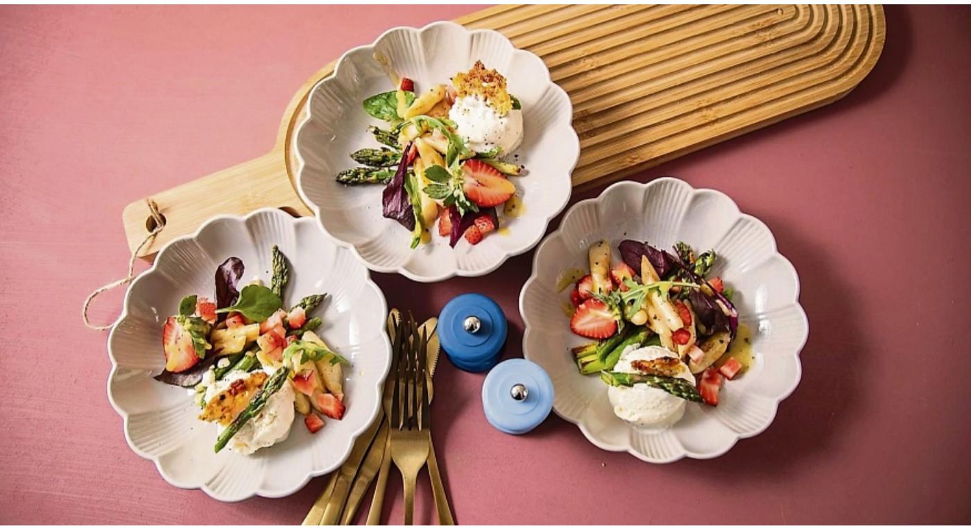
Spargeleis mit Parmesan-Schinken-Chip auf gebratenem grünen und weißen Spargel, Blattsalat, Vinaigrette und Erdbeeren.

das Gemüse zerkleinern und in 450 bis 500 ml Schlagsahne bei niedriger bis mittlerer Temperatur 30 min. weichkochen. Wichtig: „Das Gemüse muss weich sein“, betont Klisch.