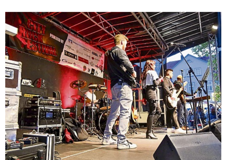
Schluss-Act: Die Band „ATTIXX“ aus Höxter covert Songs aus fast jeder Dekade und sorgte für Festival-Feeling in Bad Arolsen.