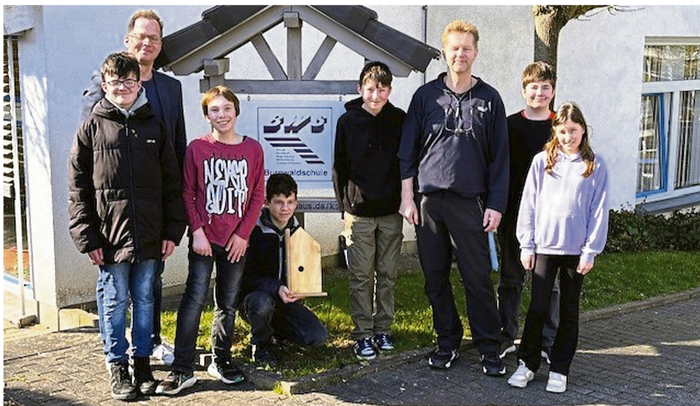
Nistkasten-Aktion: Auch die Burgwaldschule in Frankenberg bekam eine mögliche Brutstätte überreicht. Im Rahmen der Aktion investierte die Bank rund 15.500 Euro.

In vielen Einrichtungen sind die Nistkästen bereits im Einsatz, und die Rückmeldungen