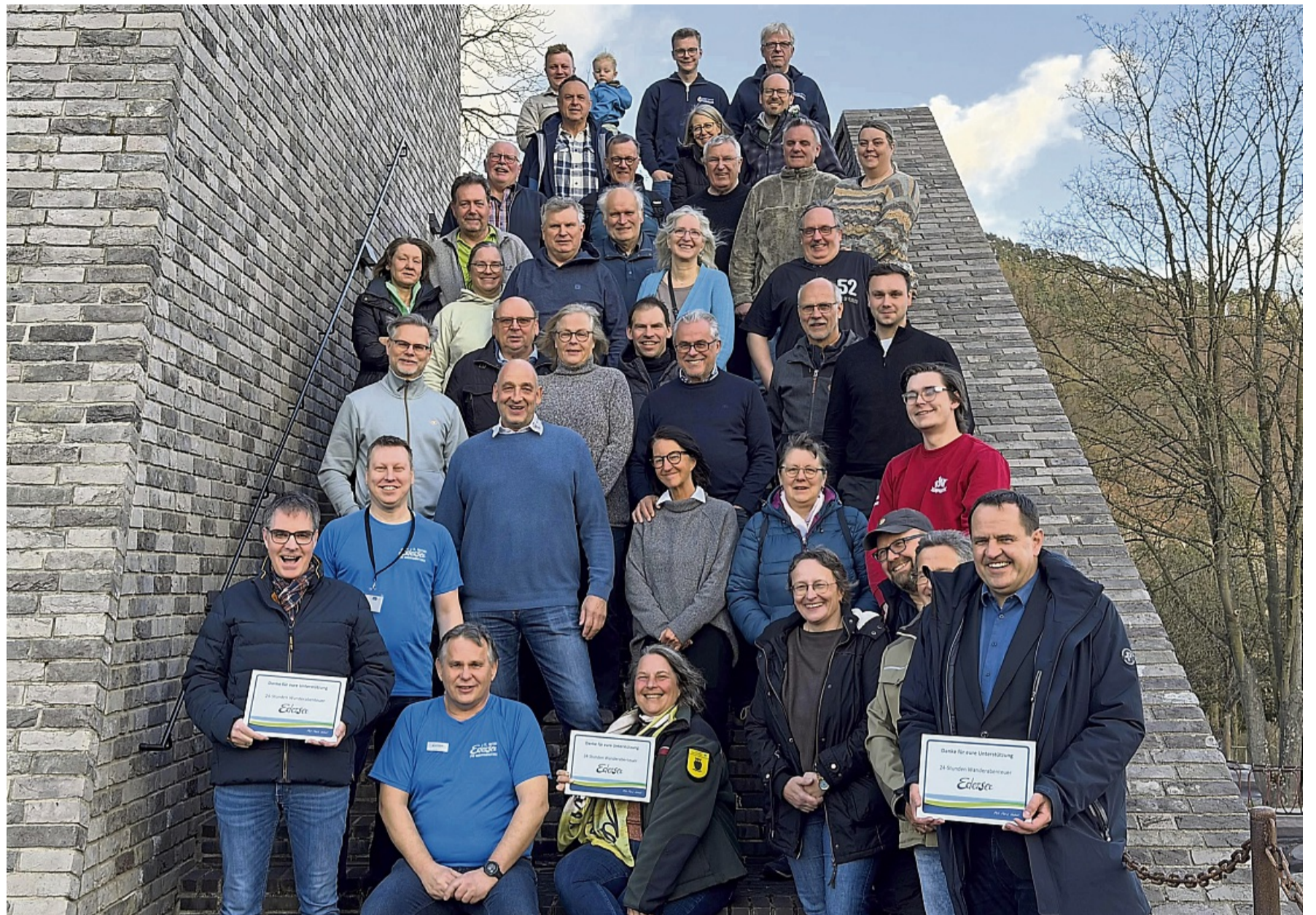
50 ehrenamtliche Helfer des 24-Stunden-Wanderabenteuers kamen am Besucherzentrum am Edersee zusammen.

Neben den vielen freiwilligen Helfern arbeitet die Edersee Marketing GmbH für das Wanderevent eng mit dem Naturpark Kellerwald-Edersee und