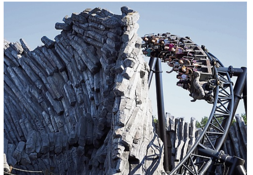
Die High-Speed-Achterbahn Taron gilt als schnellster Multi-Launch-Coaster mit vier Weltrekorden und Fahrspaß der Superlative.

12 bis 17 Jahren gemeinsam mit den kommunalen Jugendhäusern in Bad Wildungen, Volkmarsen und Frankenberg anbietet. Das Angebot ist kostenfrei und beinhaltet die Hin- und Rückfahrt, den Eintritt in den Freizeitpark und einen Mittagssnack. Anmeldungen sind online ab dem 21. Mai ab 8 Uhr möglich – und zwar online über die Webseite des Landkreises Waldeck-Frankenberg unter www.landkreis-waldeck-frankenberg.de/veranstaltungen .