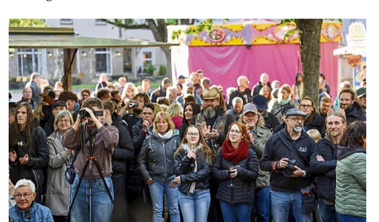
Die Zuschauer beim Cityrock-Festival auf dem Arolser Kirchplatz kamen bei den Darbietungen der Bands voll auf ihre Kosten.

Die Zuschauer beim Cityrock-Festival auf dem Arolser Kirchplatz kamen bei den Darbietungen der Bands voll auf ihre Kosten.