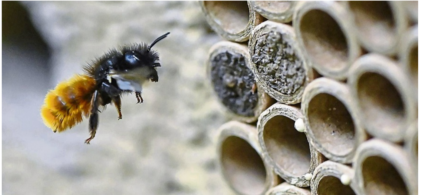
Insektenhotels kommen in erster Linie oberirdisch nistenden Wildbienenarten zugute, etwa der Gehörnten Mauerbiene.

Vorsicht gilt bei Nisthilfen mit Glasröhrchen, die oft als Beobachtungsfenster vermarktet