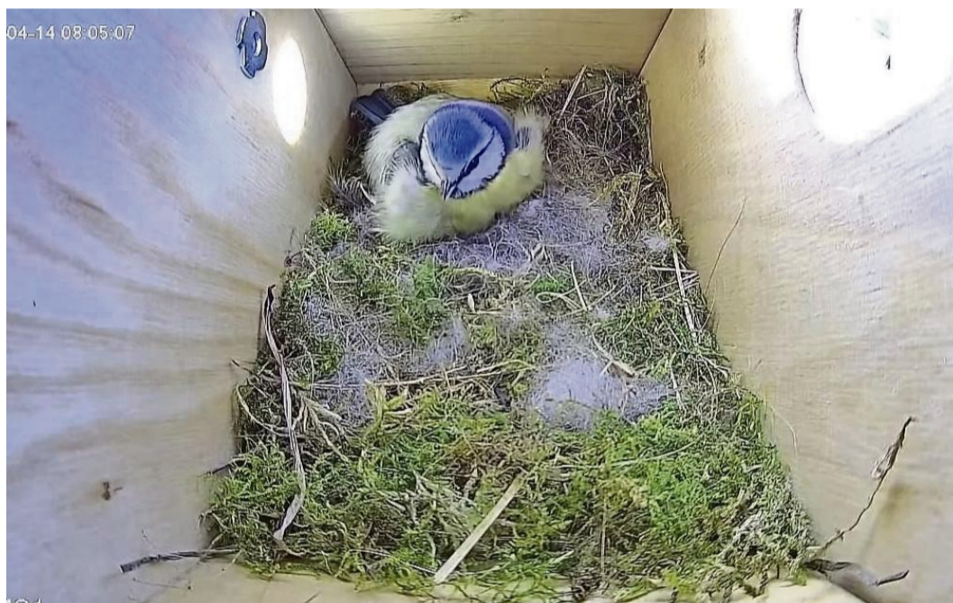
Blaumeise beim Brüten: Einblick in den Nistkasten an der DRK-Kita „Haus der kleinen Füße“ in Battenberg.

zeigen eine große Begeisterung. Ein besonders anschauliches Beispiel liefert das Familienzentrum „Haus der kleinen Füße“ Battenberg, in dem eine Blaumeise ihre Eier ausbrütet. Die Kinder verfolgen das Ge-