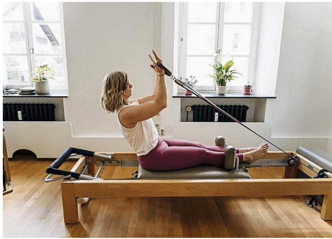
Pilates erlebt derzeit ein echtes Comeback - besonders das Training auf dem Reformer begeistert viele Fitnessfans.