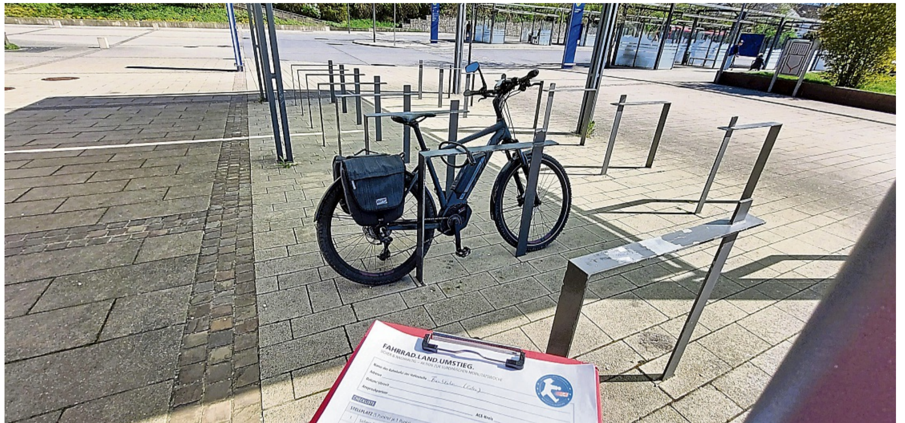
Am Bahnhof in Frankenberg haben die ACE-Tester am 4. Mai die Fahrradabstellanlagen unter die Lupe genommen.

Stellplatz: Art der Abstellanlagen, Möglichkeit zum diebstahlsicheren Anschließen der Fahrräder, Witterungsschutz,