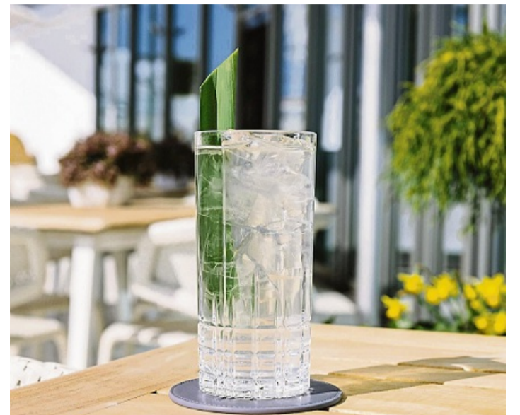
Der Coconut Water Cooler wird im Highball-Glas auf Eis und dekoriert mit Minze oder einem Pandan-Blatt serviert. Die Pflanze aus Asien bringt ein süßlich-nussiges Aroma und einen tropischen Twist.

Das ist die alkoholfreie Variante des klassischen Espresso Martini. Cold Brew bedeutet einfach nur kalter Kaffee. Filterkaffee oder frisch aufgebühter Kaffee wird Stunden zuvor kaltgestellt. „Man füllt zuerst das Tonic ein und gießt dann den Kaffee oben darauf. Letzterer bleibt oben, er rutscht nicht durch. Man hat also zwei Farbschichten. Das nennen wir Layering“, erklärt der Experte. Beim Layering schichten Bar-