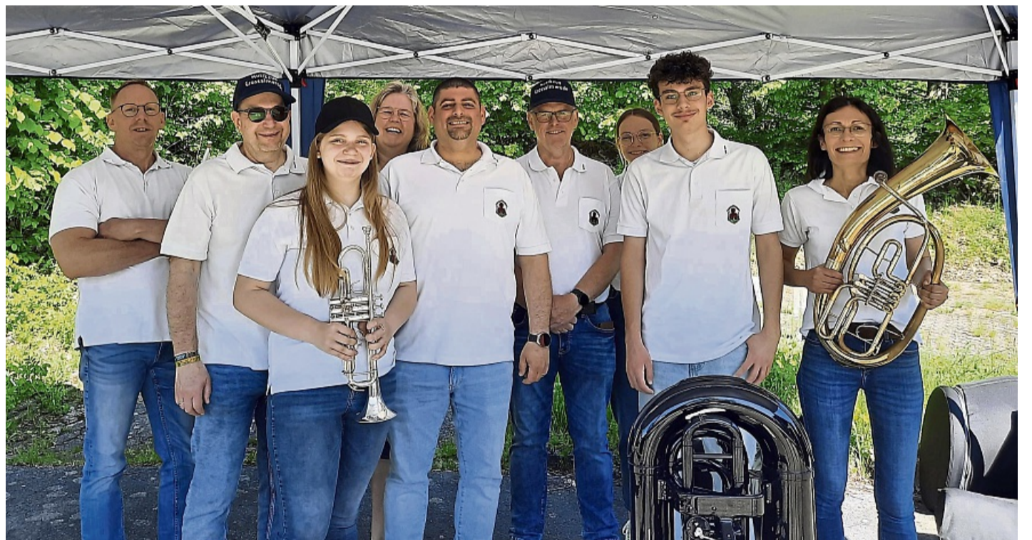
Mitglieder des Musikzug Großalmerode

Die Messe mündete in zwei weitere Events: die 50-Jahr-Feier des Tennisclubs Großalmerode und das letzte Spiel der Saison des FC Großalmerode 1920 mit anschließender Abschlussfeier. Wie auch das Panoramab-