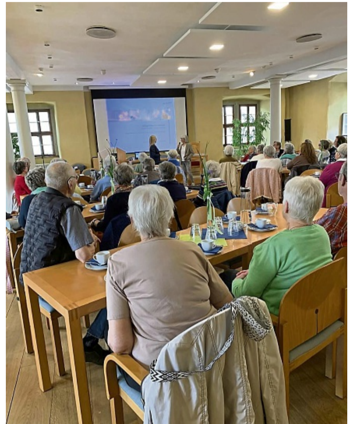
Musik, Gespräche und Informationen bestimmten den ersten gemeinsamen Nachmittag des neuen Seniorenrats im Rathaussaal.

Seniorenrat startet mit Musik, Austausch und Informationen ins erste Wirkungsjahr