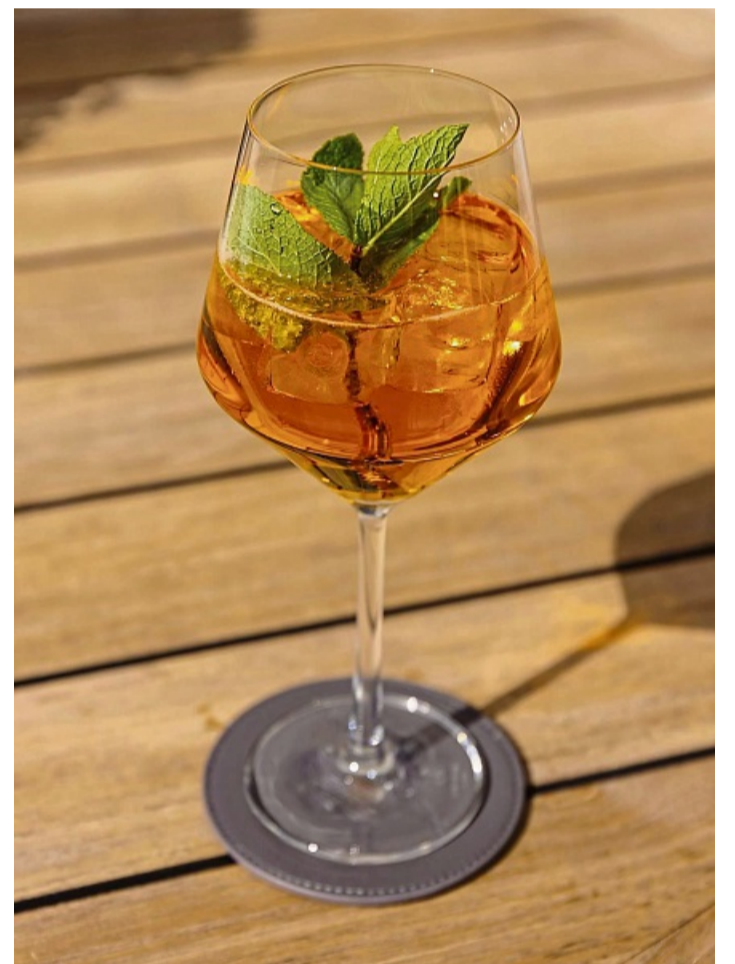
Sieht aus wie Aperol Spritz, ist es aber nicht. Der alkoholfreie Crodino Spritz aus italienischem Crodino, Soda oder alkoholfreiem Weißwein besticht mit Zitrus- und Fruchtnoten sowie leichter Kräuterwürze.