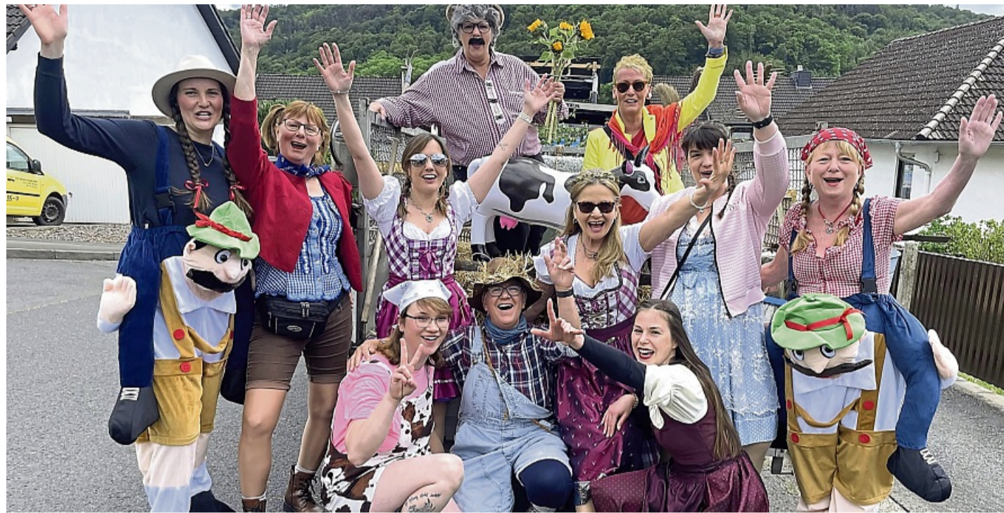
Unter den „Wilden Weibern“ findet der Bauer mit Sicherheit seine passende Zukünftige.

Besonders niedlich präsentierte sich die Kita-Gruppe, die sich ganz dem Zirkus verschrieben hatte. Als kleine Clowns, Artistinnen und Zirkusdirektoren verkleidet, zogen die Kinder auf ihrem bunt dekorierten Wagen vorbei. „Applaus, Musik und Konfetti dazu, die Kita-Zeit endet im Nu“ stand dort ebenso geschrieben wie „Als kleine