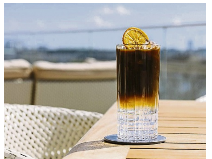
Der Cold Brew Tonic ist die alkoholfreie Variante des modernen Klassikers Espresso Martini.