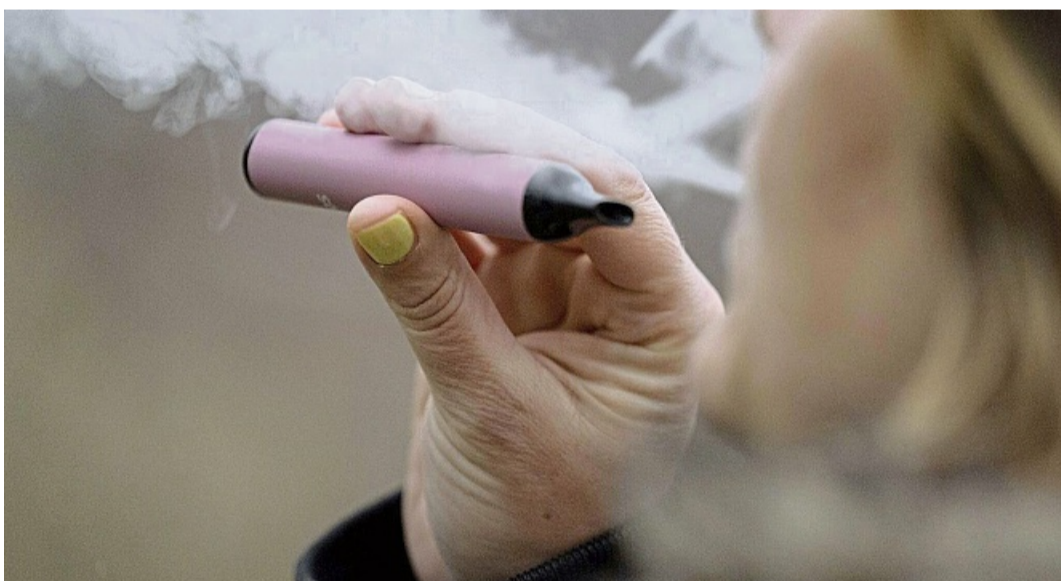
Vapen kann laut Fachleuten gravierende gesundheitliche Folgen haben.

Jugend- und Gesundheitsamt des Landkreises warnen vor Vape-Konsum