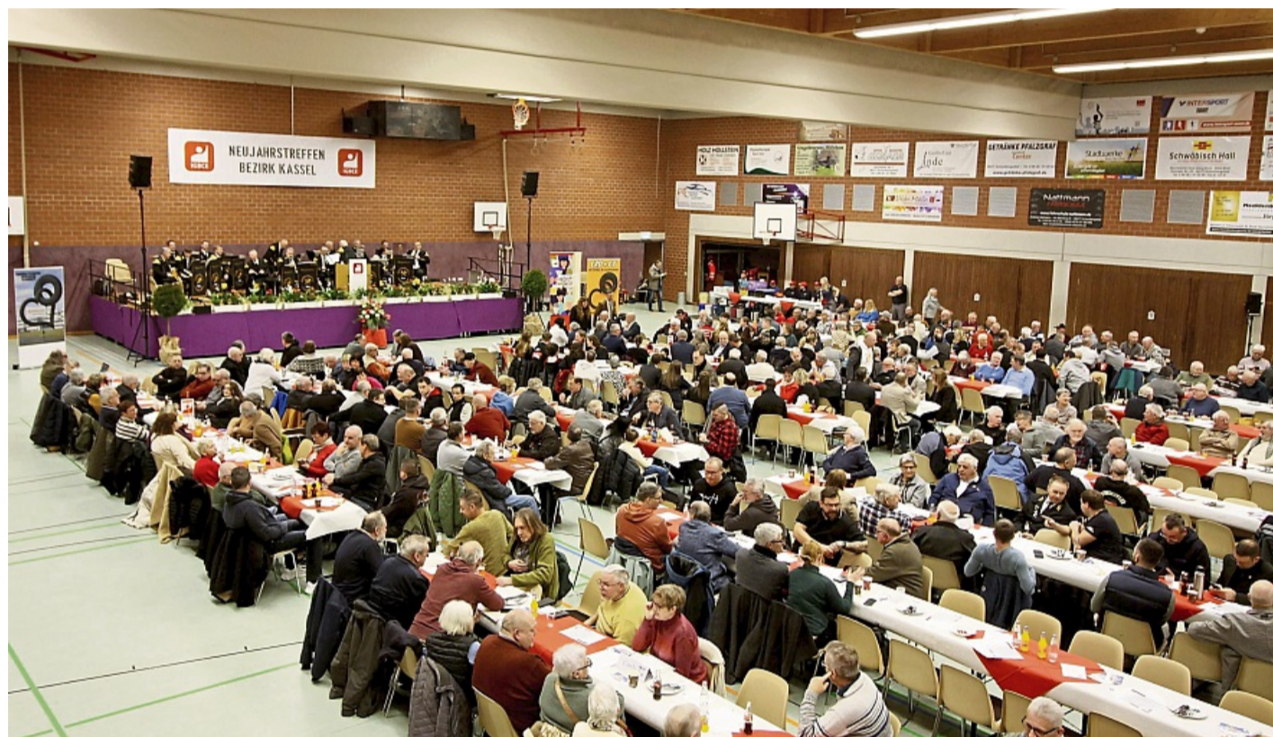
In dieser Form Geschichte: Das Neujahrstreffen des IGBCE-Bezirks Kassel findet künftig nicht mehr in der Großsporthalle Schenklingfeld statt. Stattdessen plant die Gewerkschaft ein neues Format mit Podiumsdiskussion in der Bad Hersfelder Schilde-Halle.