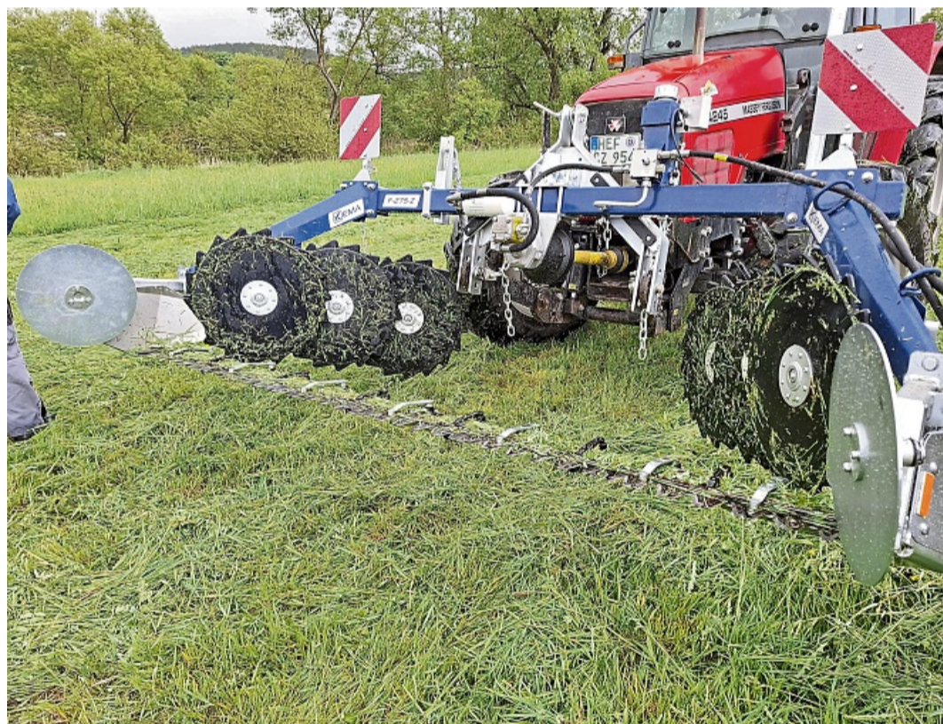
Schonende Mähtechnik: Doppelmessermäherwerke bieten zahlreiche Vorteile, sind allerdings auch teurer bei Anschaffung und Wartung.

Biodiversität erhalten: Die Identifizierung und Bewertung von Kennarten auf Grünlandflächen standen im Mittelpunkt einer Veranstaltung des Landschaftspflegeverbands Hersfeld-Rotenburg.