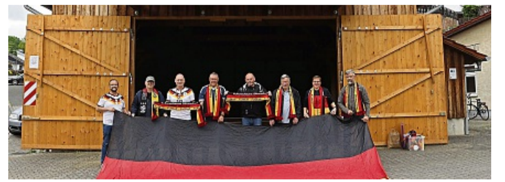
Ein Teil des Organisationsteams des Public Viewing zur Fußball-WM in der Kulturscheune Gittersdorf.