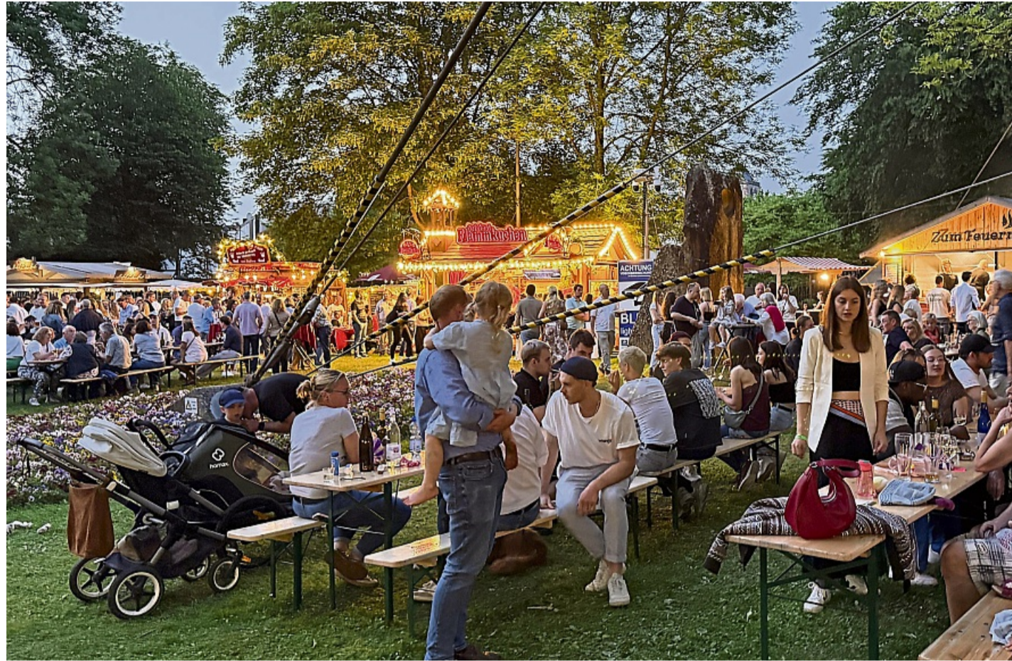
Volles Haus: Das „Swing and Wine“-Festival im Stiftsbezirk zog über das Pfingstwochenende tausende Menschen an.

Auf der Bühne sorgten an Nachmittagen und Abenden „Mainouche“ mit Gypsy-Swing,