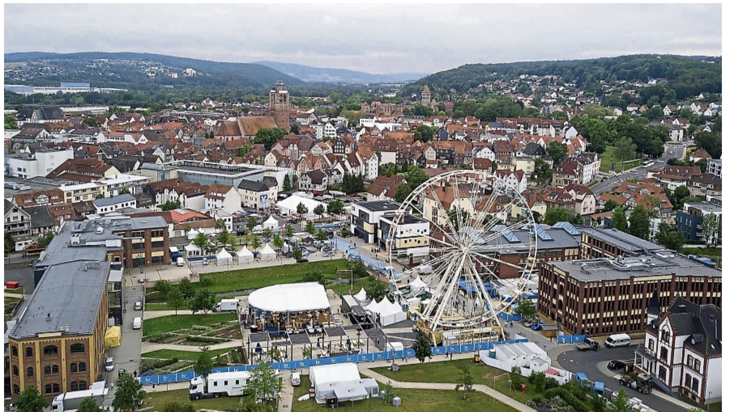
Der Hessentag 2019 in Bad Hersfeld hat bis heute positive Nachwirkungen für die Stadt.

Bad Hersfeld hatte zum Hessentag insgesamt 6,5 Millionen Euro Fördermittel für bauliche Vorhaben erhalten. Ergänzt wurden diese durch eigene städtische Finanzmittel in etwa gleicher Höhe, die entweder in den Haushalten schon vorhan-