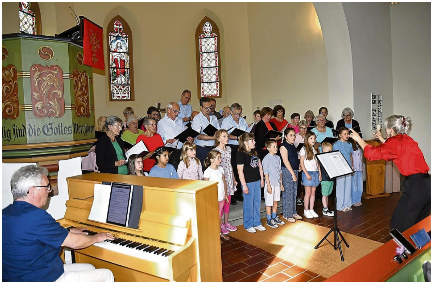
Unterhaltsames Pfingstkonzert in der Friedloser Kirche.