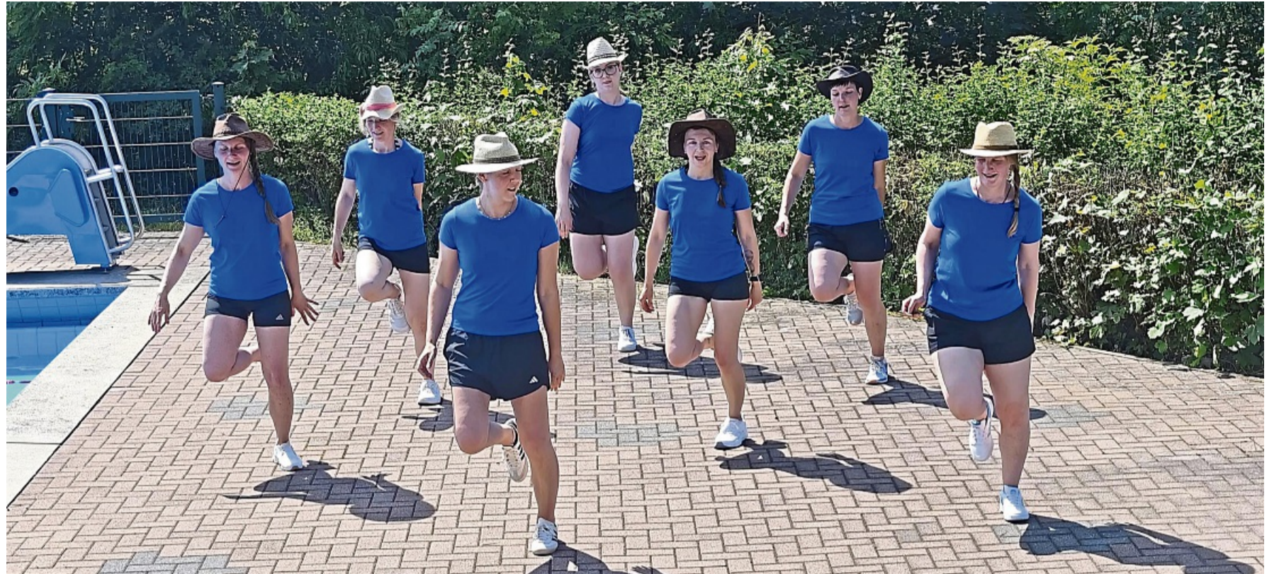
Damen mit Hut: Die „Schwimmbadzicken“ tanzten bei dem Fest in Marienhagen synchron zum Song „Cotton Eye Joe“.

Bracht-Fisseler dankte allen Mitgliedern und Helfern für ihren Einsatz sowie der Gemeinde Vöhl für die enge und gute Zusammenarbeit, durch die mit Roland Göschel aus Bad Arolsen doch noch der benötigte Badeaufseher gewonnen werden konnte. Sie warb um Nachwuchs für den Förderver-