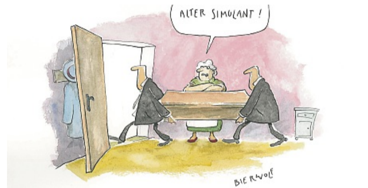
Jetzt hat der Gatte ihren Geduldsfaden wirklich überstrapaziert. KARIKATUR: BIERWOLF