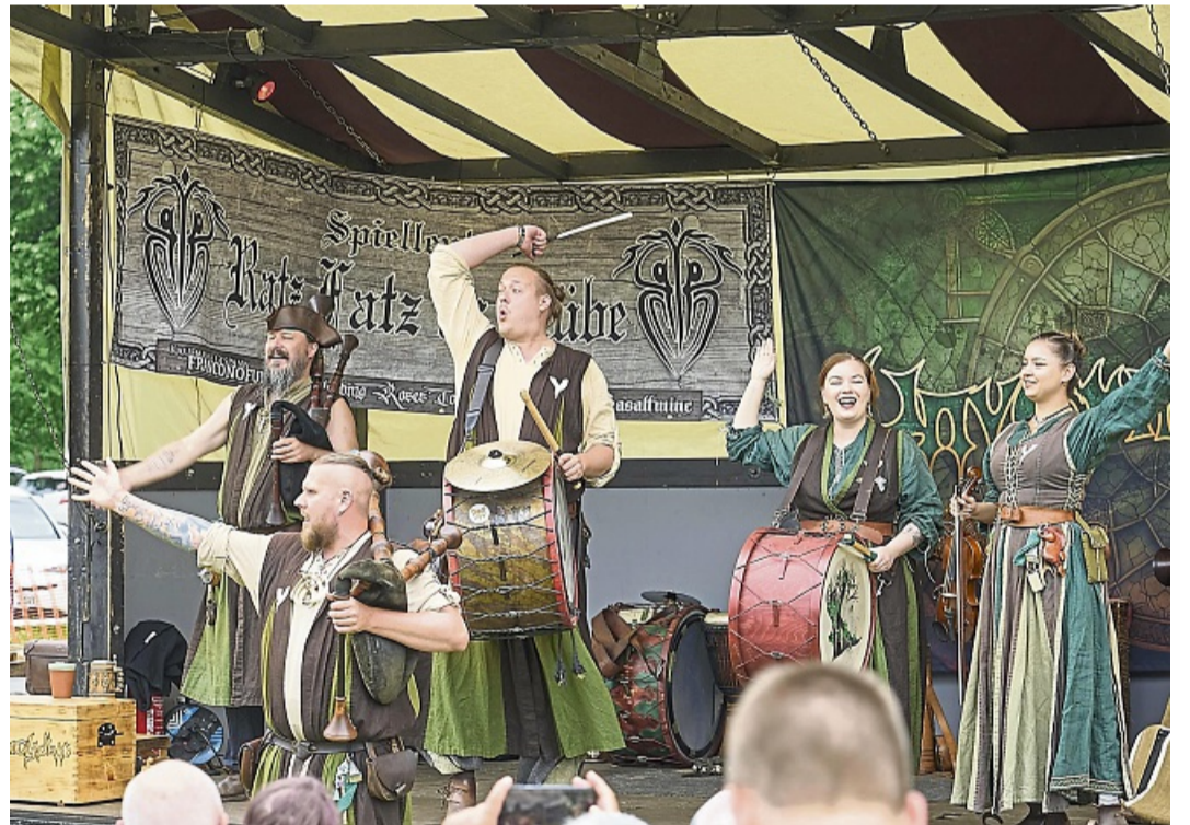
Die Formation „Unvermeydbar“ begeisterte das Volk mit ihren rustikalen Texten und wilden Rhythmen.