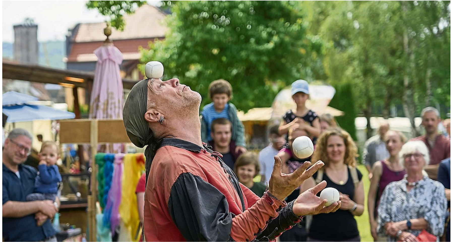
Gaukler Lupus brachte das Volk mit seinen Jonglagen zum Staunen.

Im Mittelpunkt des Treibens stand die zentrale Taverne, an der Mundschenke Met und kühlen Trunk reichten, während der Duft von Gargebratenem über das Gelände zog. Rund vierzig Handwerker- und Krämerstände säumten den Platz: Schmiede, Töpfer, Holzschuhmacher, Gewandnäherinnen und Schnapsbrenner zeigten ihr Handwerk. Wer wollte, durfte auch selbst Hand anlegen. Auf der Bühne wech-