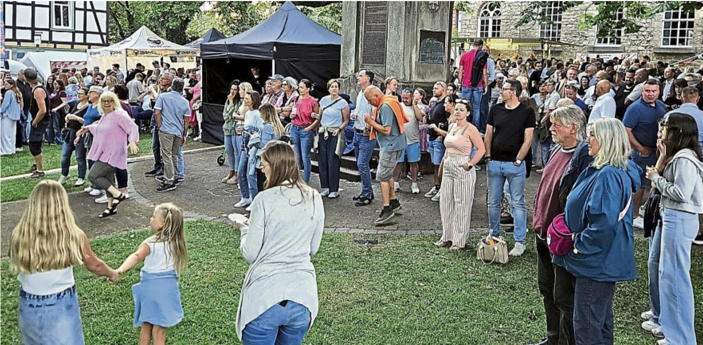
Ausgelassene Stimmung herrschte am Samstag in Dransfeld auf dem Gelände zwischen der Langen Straße und dem Rathaus, wo der Gewerbeverein wieder sein Hasenmelkerfest veranstaltete.

Zahlreiche Besucher kamen zum Hasenmelkerfest