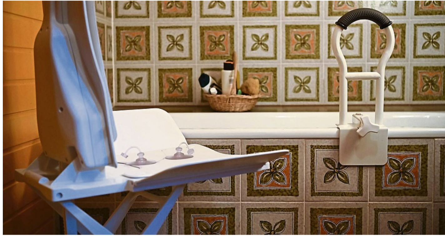
Wer Angehörige pflegt, teilt viele intime Momente – um Scham zu vermeiden, sind klare Absprachen meist hilfreich.

Wo die eigene Schamgrenze liegt, ist sehr unterschiedlich. Gerade in der Pflege gibt es vie-