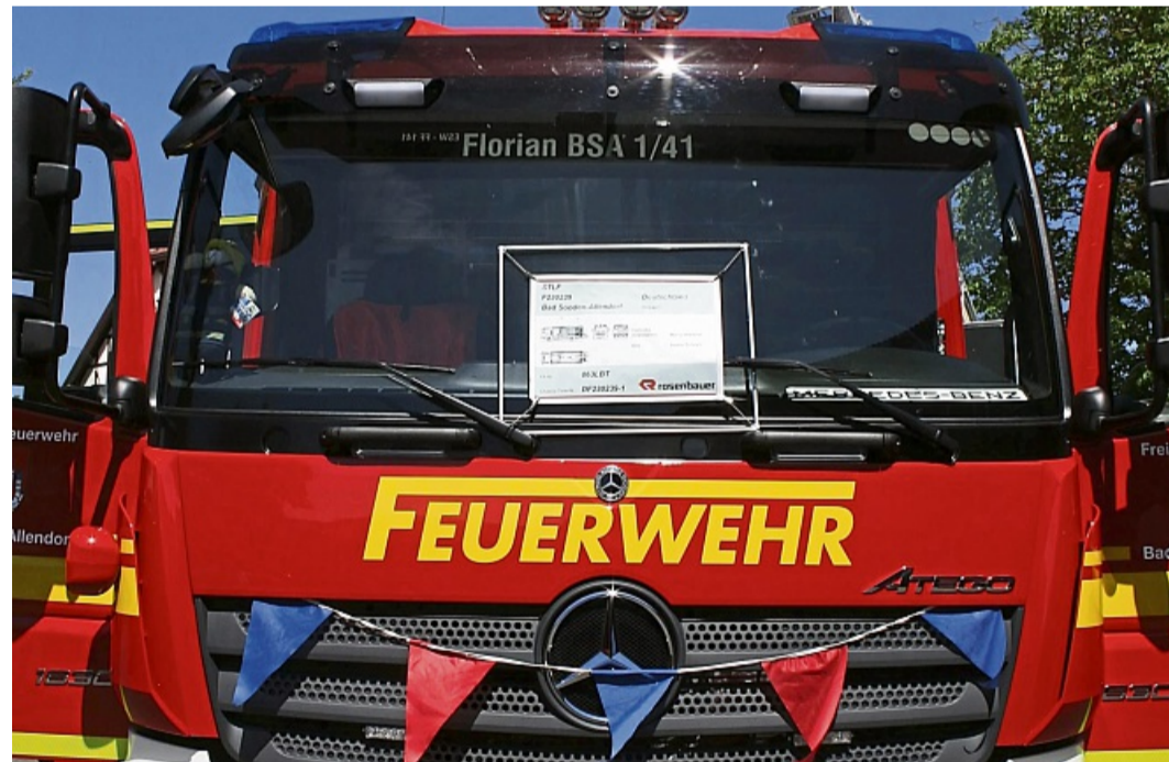
Mit Wimpeln in den Stadtfarben geschmückt: das neue Staffellöschfahrzeug.