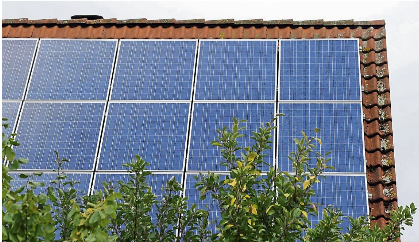
Kann sich lohnen, auch finanziell: Den Strom von der eigenen Photovoltaikanlage an die Nachbarn zu verkaufen.

Theoretisch konnten Haushalte ihren überschüssigen Solarstrom zwar auch schon vorher direkt an Nachbarn verkaufen. In der Praxis scheiterte das jedoch meist an hohen rechtlichen und organisatorischen Anforderungen, schreibt die Verbraucherzentrale Schleswig-Holstein. Solaranlagenbetreiber, die ihren Strom verkaufen wollten, mussten laut Zukunft Altbau eine Vielzahl an Pflichten erfüllen, etwa eine Liefergarantie zusichern. Mit der neuen Regelung werden Privatleute, die keine professionellen Stromlieferanten sind, von der Pflicht befreit, eine