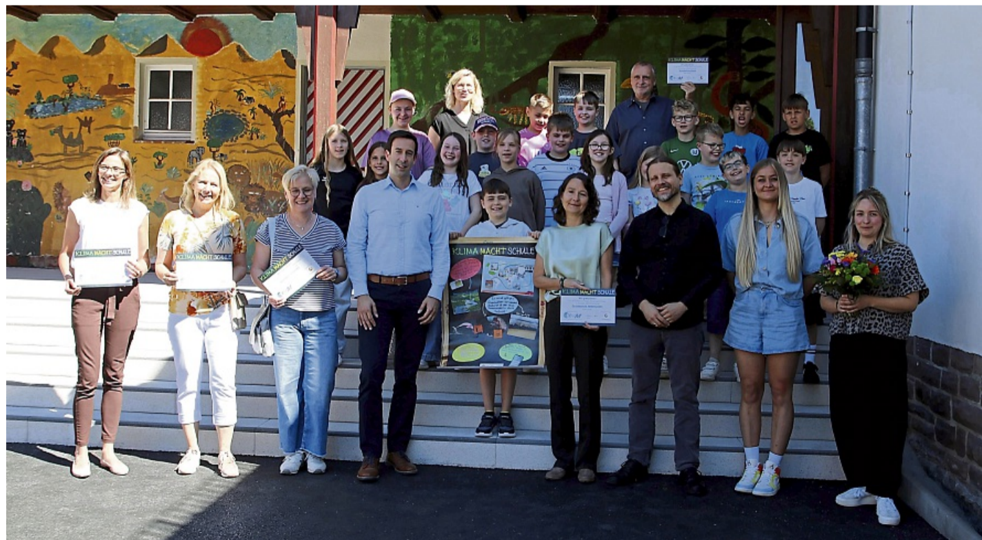
Freuen sich über die Auszeichnung: Die Kinder der Grundschule Gimte mit den Vertretern des Projekts „Klima macht Schule“.

Verschiedene Aktionstage fanden zu den Themen Energie und Klimawandel im Schuljahr statt. Im Mittelpunkt standen dabei das gemeinsame Experimentieren und Ausprobieren sowie die Arbeit der „Energie-teams“. Denn gemeinsam mit den Hausmeistern haben die Kinder ihre Schule auf Einsparmöglichkeiten untersucht, Temperaturen gemessen oder richtig Lüften gelernt. Um Energieverschwendung im Schulall-