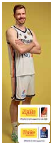
Nationalspieler Andi Obst als Markenbotschafter bei Netto Marken-Discount

sondern im Alltag. Wer mich kennt, weiß, dass ich als Ausgleich zum Sport leidenschaftlich gerne koche. Mit Netto habe ich den perfekten Partner gefunden, der mir für meine Kochabende genau die Frische und Vielfalt bietet, die ich für meine Ernährung brauche“, sagt Andi Obst. Die Partnerschaften mit der easyCredit Basketball Bundesliga und dem Netto BBL Pokal schaffen für den Lebensmittelhändler eine reichweitenstarke, ganzjährige Kommunikationsplattform. Im Mittelpunkt stehen Themen wie bewusste Ernährung, Bewegung, Teamgeist und Leistungsbereitschaft.