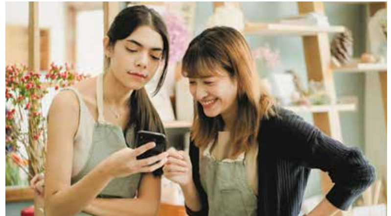
Online-Kampagnen müssen nicht kompliziert sein.

Für viele Kleinbetriebe klingt das zunächst nach einem großen Auf-