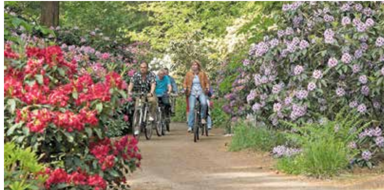
Radeln durch die Rhododendren-Pracht: In kaum einer deutschen Region kann man das farbenfrohe Schauspiel des Frühjahrs so intensiv erleben wie in der Parklandschaft des Ammerlandes im Nordwesten Niedersachsens.

Die weitgehend flache Landschaft ermöglicht entspannte Touren ohne größere Steigungen entlang kleiner Wasserläufe, durch Dörfer und vorbei an Parks. Ein rund 738