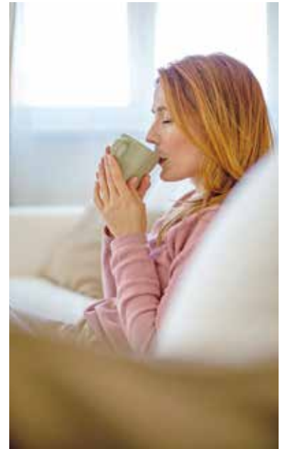
Reichliches Trinken, beispielsweise warmen Tee, fördert das Durchspülen der Harnwege und kann Keime ausschwemmen.

Mit Blick auf die warme Jahreszeit gilt außerdem, feuchte Badesachen möglichst sofort zu wechseln und sich nicht mit dünner Kleidung auf kalte Untergründe wie Steine zu setzen, denn kühlt der Unterleib aus, kann dies das Immunsystem schwächen und Infektionen begünstigen.