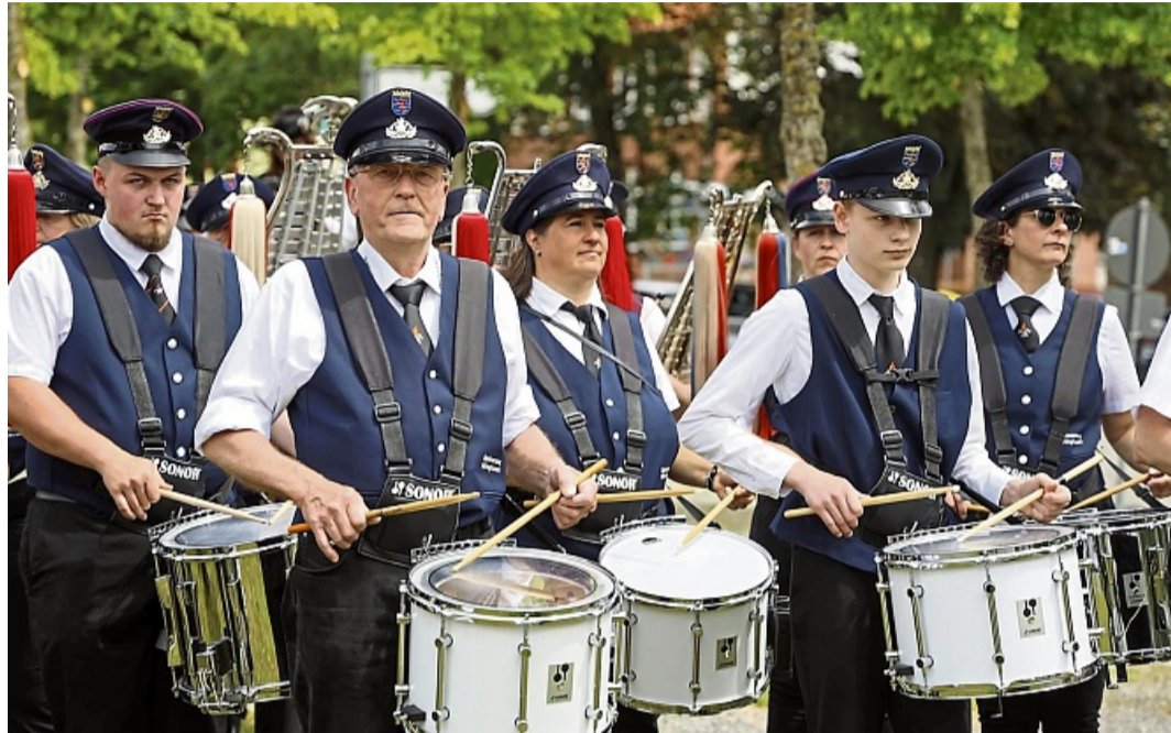
Die Musiker des Höringhäuser Spielmannszuges freuen sich über ihr erfolgreiches Fest zur 66-Jahr-Feier.

Das Festwochenende startete bereits am Freitagabend sehr harmonisch mit einer offenen Probe und einem anschließenden geselligen Beisammensein.