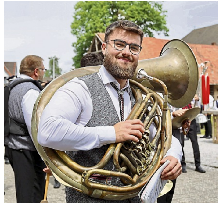
Viele Musikzüge aus den Nachbarorten beteiligten sich am Sternmarsch.