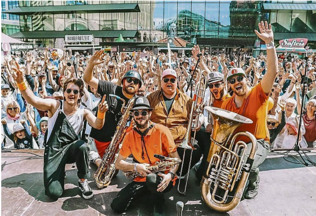
Die Sound Gurus reisen aus Oberösterreich an und präsentieren beim Hansefestival eine Mischung aus Funk, Pop, Disco und Worldmusic.

Weltklasse-Straßenmusik in der Korbacher Fußgängerzone