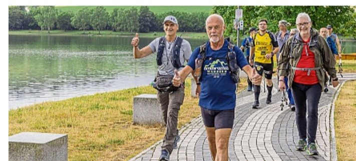
Vom Diemelsee ins Upland, nach Korbach und zurück führt die Wanderung „Extrem Extrem“.

Dass „Extrem Extrem“ in der Szene längst einen Namen hat, zeigen die Anmeldezahlen. Auch 2026 rechnen die Veranstalter wieder mit über 200 Teilnehmern. Zum siebten Mal organisieren die Gemeinden Willingen und Diemelsee sowie die Stadt Korbach das Event gemeinsam – und das mit wachsendem Erfolg. In Heringhausen empfängt der Heimat- und Verkehrsverein Diemelsee-Heringhausen die Ankommenden auf dem Vorplatz des Haus des Gastes – mit Frühstück ab 10 Uhr und einem Platzkonzert des Spielmanns- und Musikzuges der Freiwilligen Feuerwehr Adorf ab 11.30 Uhr. Weitere Informationen gibt es online unter www.extrem-extrem.de .