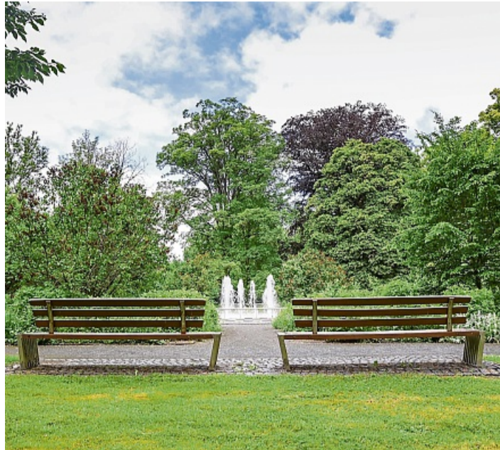
Eine Seniorin hat die Bänke mit ihrem Enkel abgeschliffen und neu gestrichen.

Die Seniorin sei laut Sprecher des Bauhofs nicht nur ehrenamtlich aktiv, sondern sei bereits zur Landesgartenschau 2006 als Fürsprecherin einer Bank engagiert gewesen. Ihr aktueller Einsatz knüpfe somit an ihr langjähriges, persönliches Engagement für die Verschönerung des öffentlichen Raums