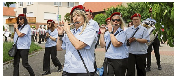
Mit Sang und Klang durch den Ort: Die Musikerinnen und Musiker zogen bei bestem Sommerwetter aus drei Richtungen durch die Straßen Höringhausens.

Dort folgte der emotionale Höhepunkt des Tages: Als alle Musiker gemeinsam die Traditionsstücke „Preußens Gloria“ und „Mit Sang und Klang“ anstimmten, bebte der Platz. Ein echter Gänsehautmoment, der das Publikum sichtlich begeisterte und mit rasantem Applaus belohnt wurde.