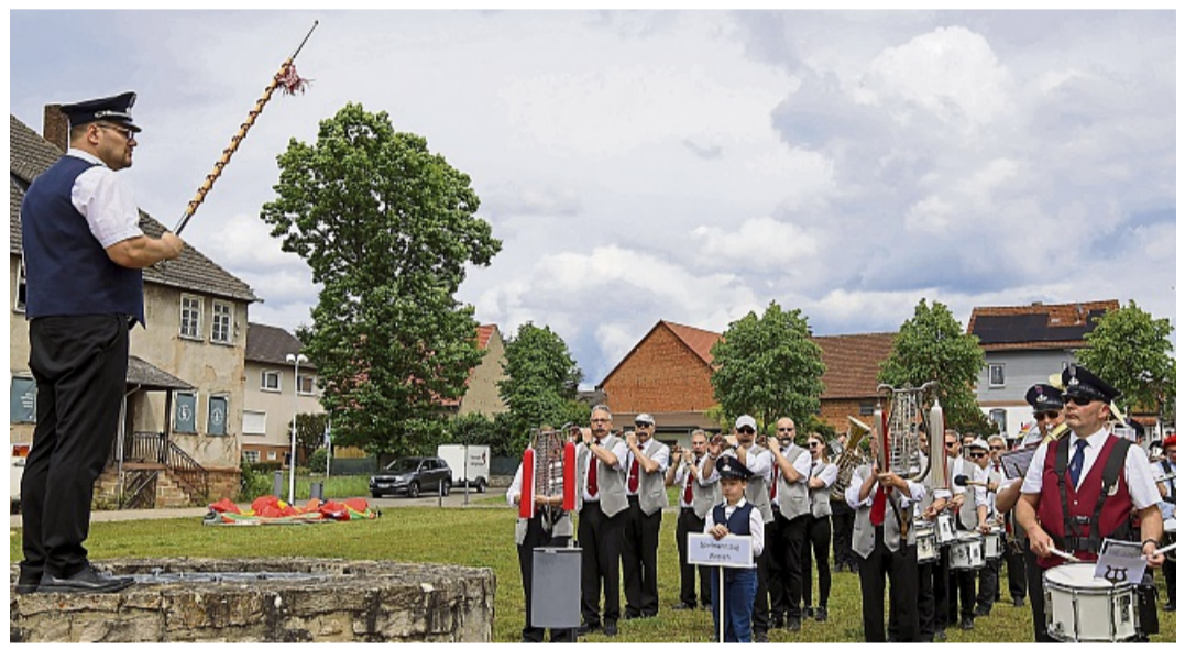
Ein imposantes Klangbild: Sieben Spielmanns- und Musikzüge vereinten sich nach dem Sternmarsch zu einem riesigen Orchester auf dem Dorfplatz.

Im Anschluss formierten sich die sieben beteiligten Formationen für den großen Sternmarsch. Neben den Gastgebern