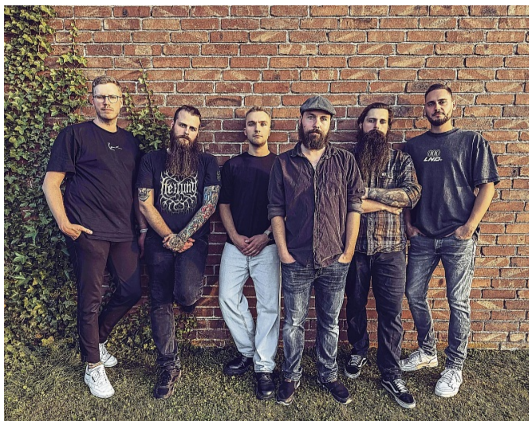
Mittelalterliche Musik führt die Gruppe Fjordvind vor passender Kulisse auf.

und Zeitgeist miteinander vereint. Peppler richtet sich an ein Publikum, das Musik nicht nur hören, sondern fühlen möchte. Abgerundet wird der Konzertabend stilecht von der Band Fjordvind: Mit Mittelalter-Folkrock kommt die Burgruine bestens zur Geltung und verspricht ein besonders Konzerterlebnis. Mit eindrucksvollen Klanglandschaften, kraftvollen Melodien und einer unverwechselbaren nordischen Atmosphäre begeistert Fjordvind ihr Publikum weit über Genre-grenzen hinaus. Die Band steht