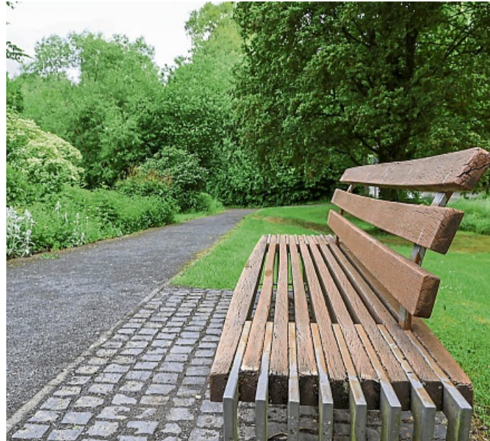
Eine der Bänke direkt vor der Wasserinstallation Aqua-Choros.

an. Mit Geduld und Freude haben sich die Seniorin und ihr Enkel an die Arbeit gemacht. Dass die Bänke nicht professionell ge-