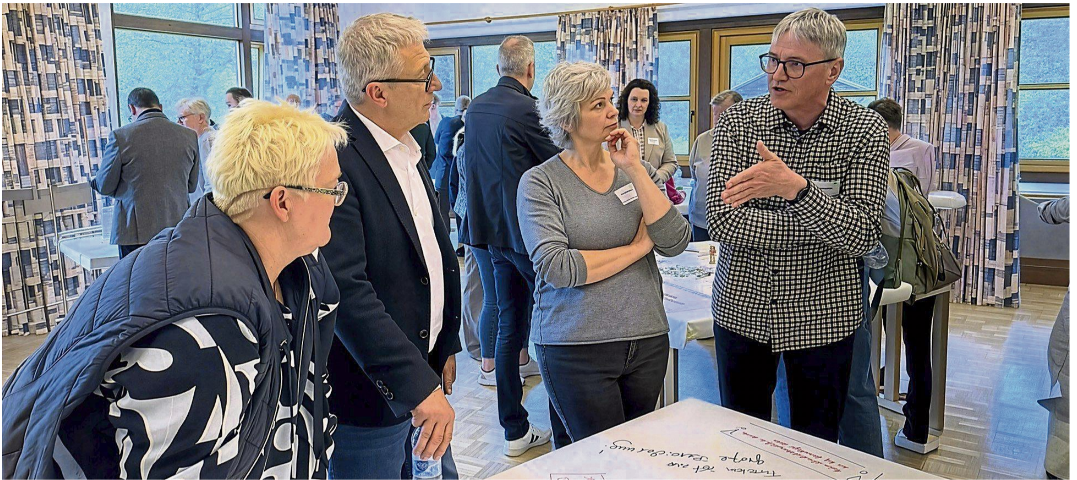
Wie sollen Mitarbeiter und Arbeitsweisen zusammenwachsen? Im Workshop sprachen Mitarbeiter der Kliniken Korbach und Frankenberg über ihre Blickwinkel.

Klinik-Mitarbeiter aus Frankenberg und Korbach trafen sich zu Austausch