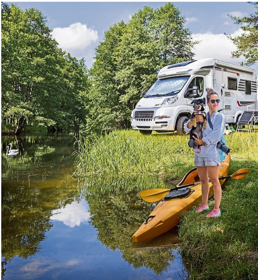
Mit einer guten Vorbereitung gelingt der Campingurlaub im Wohnmobil.

Überladung oder eine ungünstige Gewichtsverteilung wirken sich negativ auf Fahrsta-