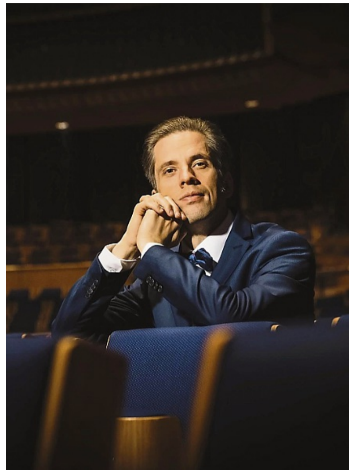
Der Pianist Severin von Eckardstein eröffnet die Reihe der Schlosskonzerte.