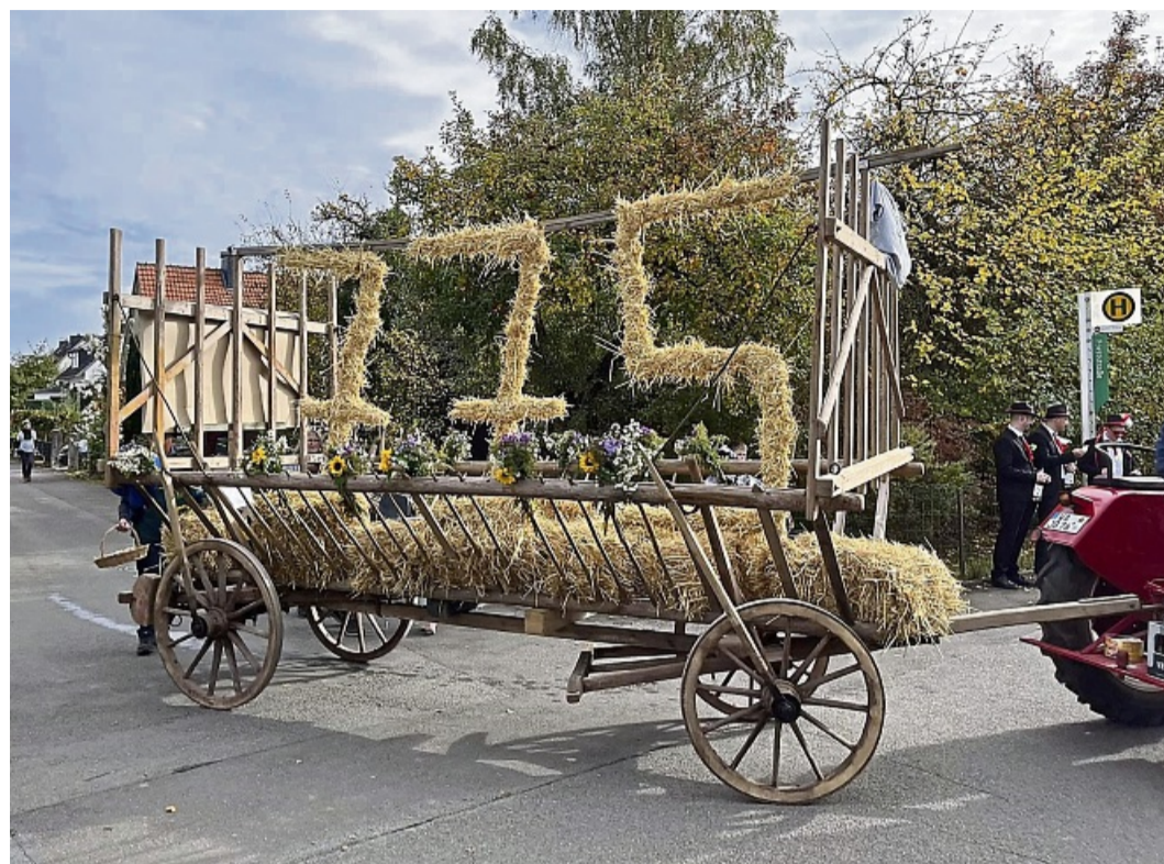
Mit einem Leiterwagen rührten die Strother in diesem Jahr die Werbetrommel für ihr Jubiläum.

Zentral gelegen ist die Festscheune. Im Grünen dahinter befindet sich das Gartencafé, direkt im Innenhof die Bühne. Bewusst verzichten die Strother auf Eintritt, halten die Preise moderat. „Es ist etwas vom Dorf, fürs Dorf – und für Ehemalige und die, die sich mit uns verbunden fühlen.“ Der Rahmen sei „bewusst klein“ gehalten,