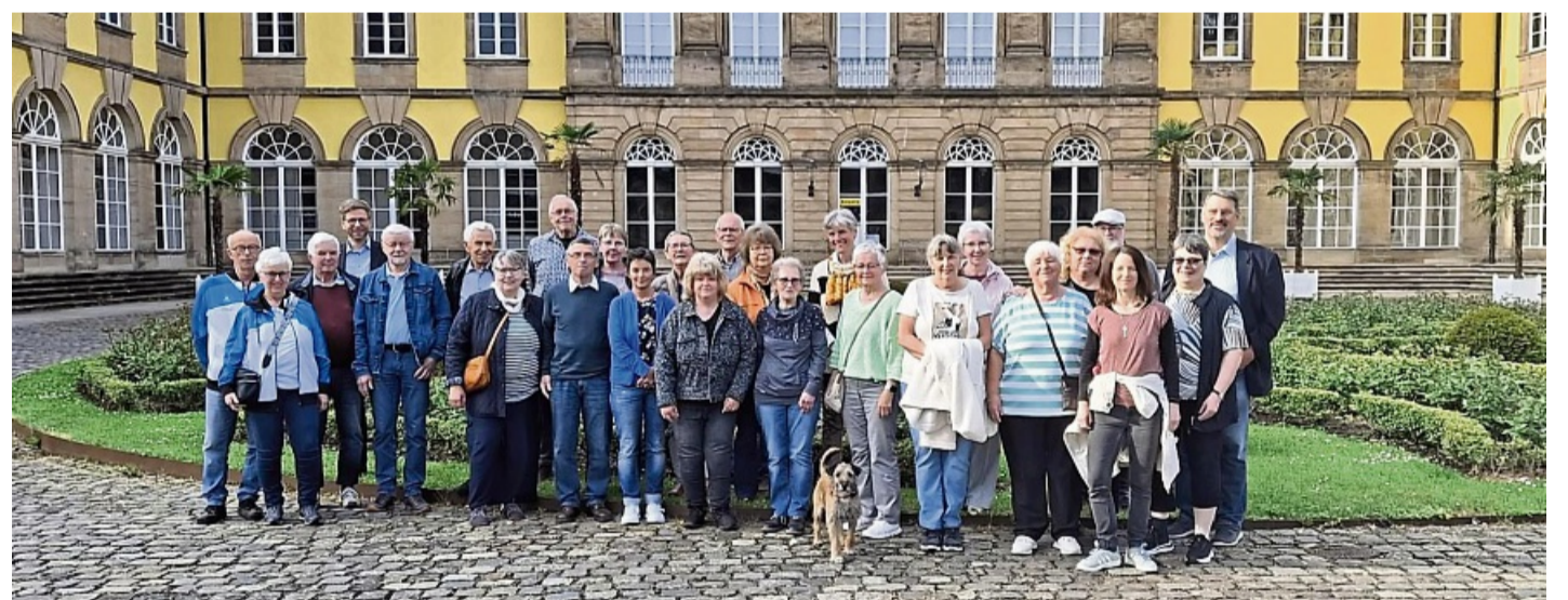
„Schatz für das Bathildisheim“: Die Ehrenamtliche der „Bunten Vielfalt“ erlebten einen interessanten Tag im Schloss von Bad Arolsen.

war das Zusammentreffen der Ehrenamtlichen der Bunten Vielfalt in diesem Jahr geprägt. Rund um den Geburtstag der Namensgeberin des Bathildisheims, Fürstin Bathildis von Waldeck und Pyrmont (21. Mai