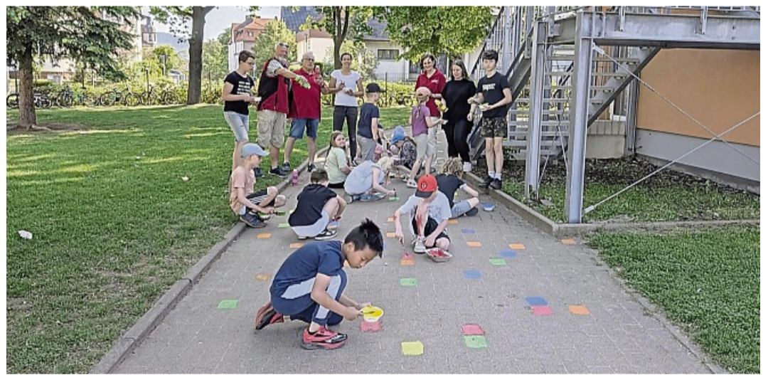
Aktion: „Eschwege hilft“ verschönerte mit Schülern der Struthschule in Eschwege den Schulhof.

„Eschwege hilft“ macht den Struthschulhof bunt