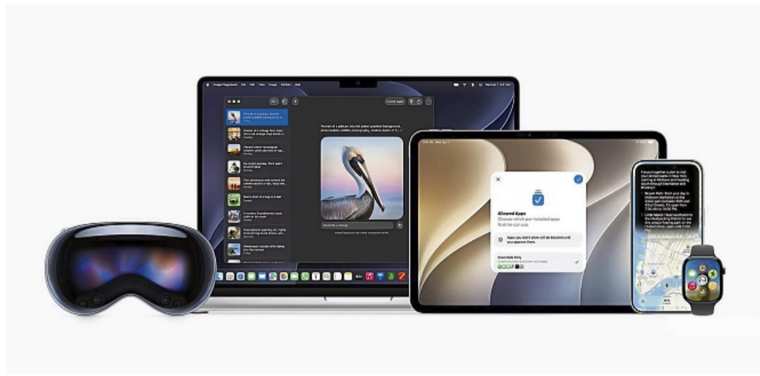
Die Apple-OS-Generation 27 mit visionOS (links), macOS (2. v.l.), iPadOS (Mitte), iOS (2. v.r.) und watchOS (rechts) soll voraussichtlich im September verfügbar sein.

Apples Webbrowser Safari erlernt die Fähigkeit, Veränderungen auf Websites zu bemerken. Wenn man also darauf wartet, dass die Tour einer Band angekündigt wird, saisonale Sorten bei einer Eisdiele vorgestellt werden oder ausverkaufte Artikel in einem Online-Shop zurückkommen - kann man