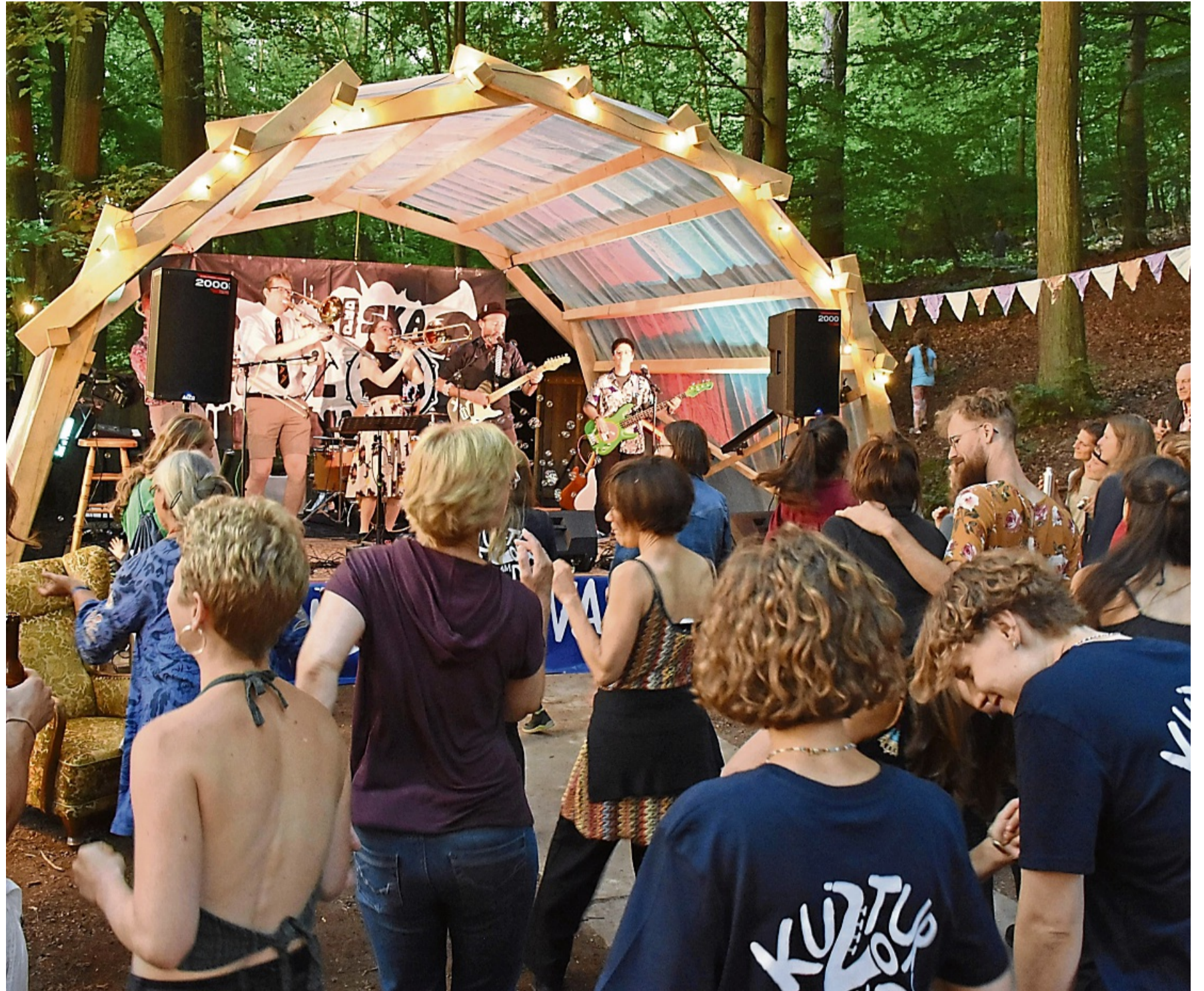
Dorfgefühl gepaart mit Festivalatmosphäre: „Kultur am Walde“ begeistert Jahr für Jahr die Besucher.