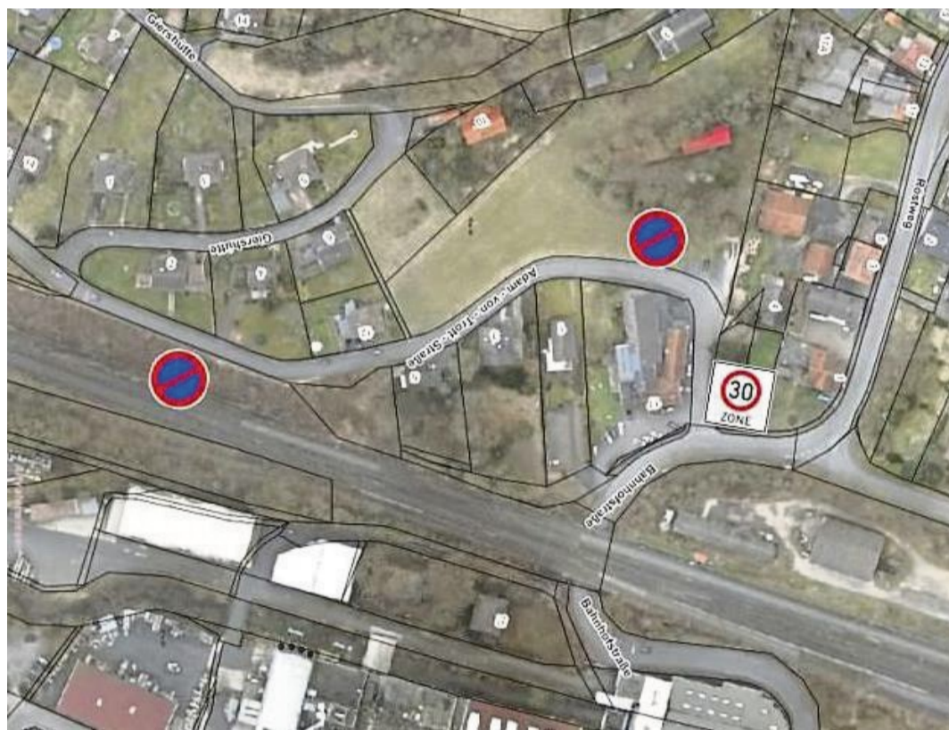
Anpassung der Beschilderung in der Adam-von-Trott-Straße in Sontra verbessert Verkehrssicherheit.