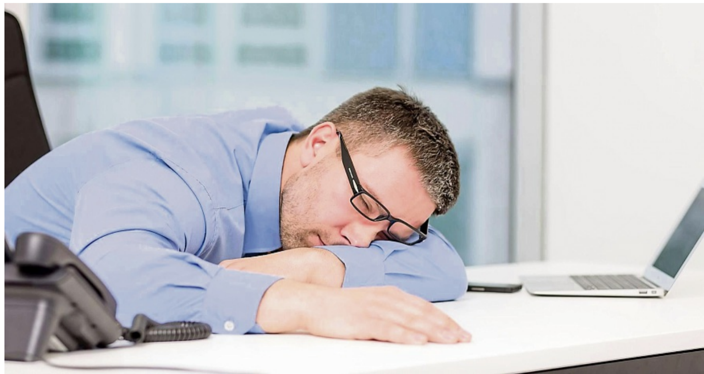
Am Tag nach dem späten WM-Match siegt die pure Müdigkeit? Dann tut ein Nickerchen gut (aber lieber nicht im Büro).

Vorschlafen zur Vorbereitung - ja oder nein?