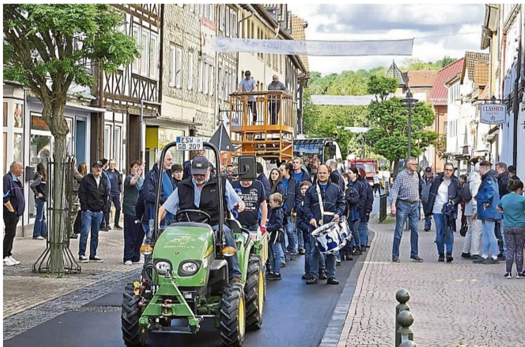
Vereinsbanner weisen in Sontras Straßen auf die BREITWIESN hin.