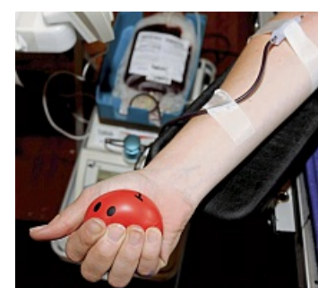
Jede Blutspende ist wichtig, vor allem während der Sommerzeit.

ist am Freitag, 26. Juni, von 16.45 bis 20 Uhr in der Adam-von-Trott-Schule in der Jahnstraße 16. Jetzt Termin buchen: www.blutspende.de/termine . Insbesondere bei hohen Temperaturen ist es wichtig, vor und nach der Blutspende ausreichend Wasser zu trinken und etwas zu essen. Weitere Informationen rund um das Thema Blutspende unter www.blutspende.de oder telefonisch kostenfrei unter 0800/119 49 11.