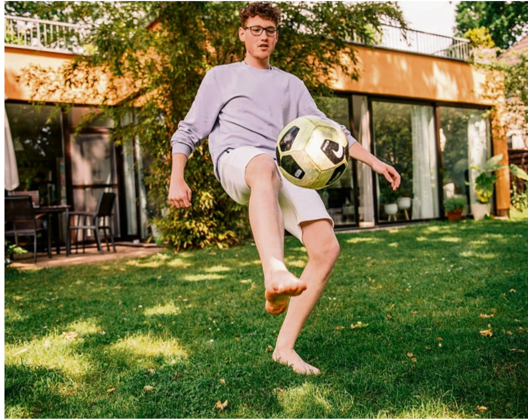
Heute Garten-, morgen Mannschaftstraining: Wer Hüfte, Rumpf und Beine stabilisiert, senkt das Risiko für typische Fußball-Knieverletzungen.

Sportlerinnen und Sportler können aber vermeiden, dass das Knie in diese ungünstige Position gerät - und zwar, indem sie auf die richtigen Übungen setzen. Die Deutsche Kniegesellschaft, die Teil der DGOU ist,