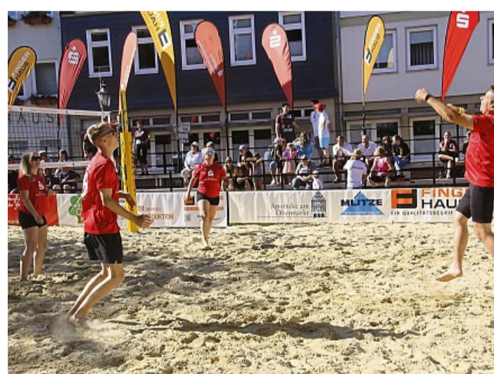
Beachvolleyball vom Feinsten gibt es vom 19. bis 21. Juni auf dem Frankfurter Obermarkt.

Am Samstag, 20. Juni, beginnen die Spiele um 10 Uhr auf dem Obermarkt und in der Sparkassen-Beach-Arena am Sportplatz. Bis in den Abend hinein messen sich die Teams in Vor- und Zwischenrunden auf höchstem Niveau. Als ranghöchstes Beach-Volleyball-Turnier Hessens bietet der Sparkassen Beach-Cup wichtige Punkte für die DVV-Rangliste und damit für die Qualifikation zu den