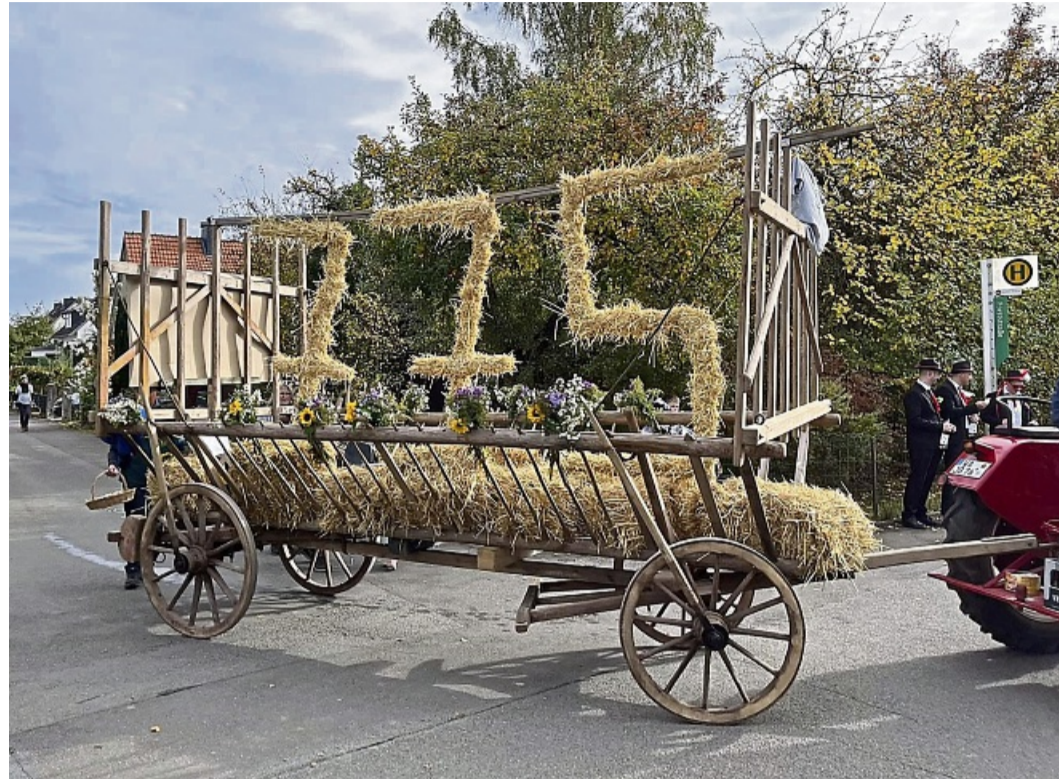
Mit einem Leiterwagen rührten die Strother in diesem Jahr die Werbetrommel für ihr Jubiläum.

Zentral gelegen ist die Festscheune. Im Grünen dahinter befindet sich das Gartencafé, direkt im Innenhof die Bühne. Bewusst verzichten die Strother auf Eintritt, halten die Preise moderat. „Es ist etwas vom Dorf, fürs Dorf – und für Ehemalige und die, die sich mit uns verbunden fühlen.“ Der Rahmen sei „bewusst klein“ gehalten,