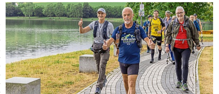
Vom Diemelsee ins Upland, nach Korbach und zurück führt die Wanderung „Extrem Extrem“.

Dass „Extrem Extrem“ in der Szene längst einen Namen hat, zeigen die Anmeldezahlen. Auch 2026 rechnen die Veranstalter wieder mit über 200 Teilnehmern. Zum siebten Mal organisieren die Gemeinden Willingen und Diemelsee sowie die Stadt Korbach das Event gemeinsam – und das mit wachsendem Erfolg. In Heringhausen empfängt der Heimat- und Verkehrsverein Diemelsee-Heringhausen die Ankommenden auf dem Vorplatz des Haus des Gastes – mit Frühstück ab 10 Uhr und einem Platzkonzert des Spielmanns- und Musikzuges der Freiwilligen Feuerwehr Adorf ab 11.30 Uhr. Weitere Informationen gibt es online unter www.extrem-extrem.de .