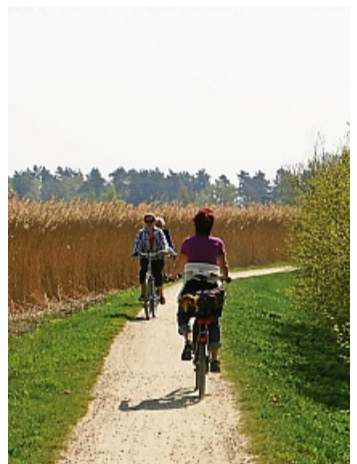
Im Sommer stehen verschiedene Themenradtouren an.