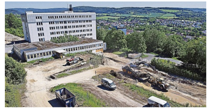
Abriss abgeschlossen: Der OP-Trakt und das Schwesternwohnheim gibt es nicht mehr. Das Bettenhaus bleibt erhalten.

Das Areal wurde in drei Bauabschnitte gegliedert und soll von West nach Ost erschlossen werden. „Es ist wichtig, das Grundstück schrittweise entwickeln zu können“, sagte Ritz. So lasse es sich leichter vermarkten, Abhängigkeiten könnten zudem verringert werden. Das Konzept sieht derzeit Stellplätze auf privaten Grundstücken vor – die Abhängigkeit von einer ursprünglich geplanten Quartiersgarage werde damit verhindert. Eine Garage für das gesamte Quartier bleibe aber weiterhin denkbar, betonte der Bürgermeister. Denn das Ziel sei es, die Verkehrsflächen zu minimieren. „Wenn sich das Quartier gut entwickelt, ist ei-