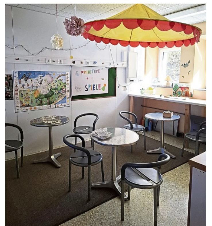
Gemütlich: In der neuen Pausenoase können Schüler sich entspannen.

Spangenberg – Die Grundstufen-Oase der Burgsitzschule Spangenberg ist in das Gebäude der Schulbar umgezogen und dabei vergrößert worden. Das Teil das Grundschulteam mit. Der Name steht für Orientierung, Auszeit, Spiel und Spaß sowie Entspannung. Grundschulkinder können in den großen Pausen vier Funktionsbereiche nutzen: einen Frühstücks- und Tischspielbereich, eine Bau- und Puppenhausecke, eine Kreativecke mit gezielten Pausenangeboten sowie eine Lese- und Ruhezone mit zwei Sofas und einer kleinen Bibliothek. Zu den weiteren Angeboten zählen ein Schach-Tisch, ein Verkaufsladen und ein Nachdenkraum für Kinder, die eine Pause benötigen. Bei Regen nutzen Lehrkräfte mit ihren Klassen die Oase als Alternative zu Schulhof und Spielplatz. Die Elternschaft der Schulbar erklärte sich einstimmig bereit, den Schulbar-Verkauf in die Mensa zu verlegen, um den Umzug der Oase zu ermöglichen. Auch den Schülern wird in der Mitteilung für ihr Verständnis gegenüber der Veränderung gedankt. Es werde etwas dauern, bis sich alle an die neue Grundstufen-Oase gewöhnt hätten. Ein besonderer Dank gilt laut Mitteilung Hausmeister Andreas Ackermann, der die Umsetzung der Erweiterung maßgeblich vorangetrieben habe. Das Grundschulteam freue sich über die neue Oase als Ort der Begegnung.