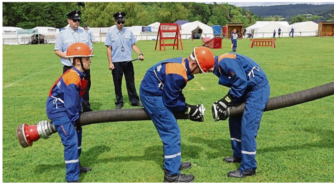
Hand in Hand: Beim Kuppeln der Saugleitung muss jeder Handgriff sitzen.