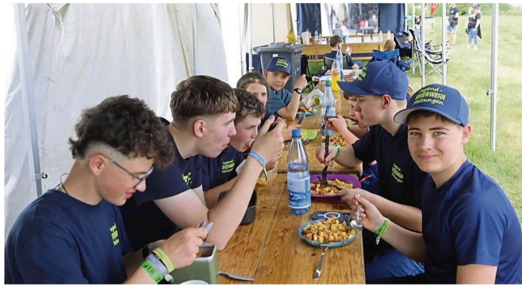
Den Mitgliedern der Melsunger Jugendfeuerwehr schmeckt es