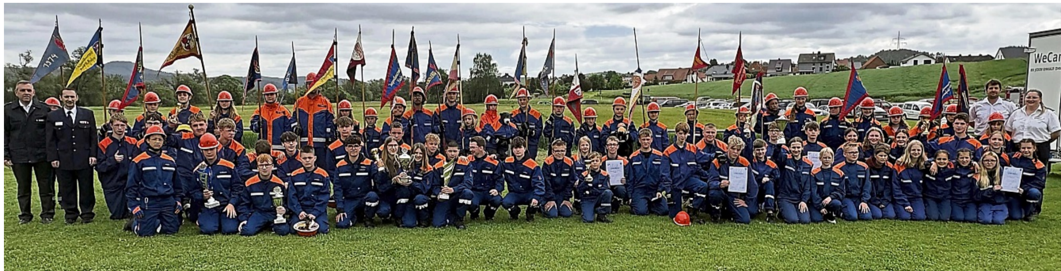
Konnten sich freuen: Die Siegermannschaften können Pokale mit nach Hause nehmen.

Staffeln, zwei Gruppen) begehrten Plätze für den Großkreisentscheid. Von den Staffeln nahmen Elbersdorf, Landetal und Niedervorschütz teil. Bei den Gruppen schafften Günsterode und Rhünda die Qualifikation. Diese beiden Mannschaften haben es im Vorjahr sogar bis zum Landesentscheid geschafft, was sie sich natürlich auch für dieses Jahr erhoffen. zot