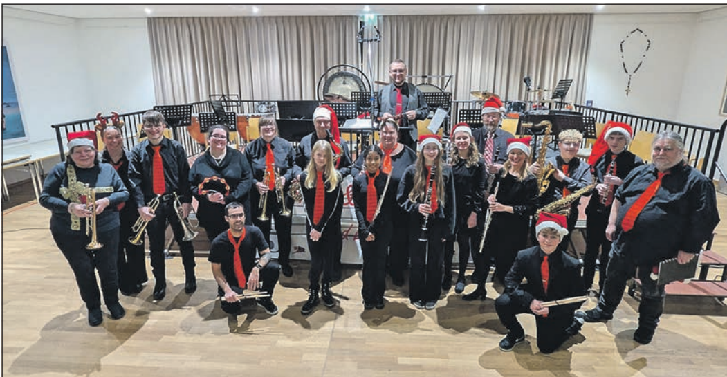
Die „Brass and Marching Band Eschborn“ geht in die Winterpause.

Winterpause. Ein weiteres Konzert steht in Eschborn aber dennoch aus: Am Samstag, 20. Dezember, treten die „Tenores di Neoneli“ in der evangelischen Kirche am Eschenplatz auf. Die Gesangsgruppe aus Sardinien ist für ihren traditionellen Kehlkopfgesang bekannt, der zum immateriellen Kulturerbe der UNESCO gehört. Die Brass and Marching Band Eschborn nutzte ihren Jahresabschluss auch, um auf die Vereinsarbeit hinzuweisen. Gesucht werden Musikerinnen und Musiker sowie Helferinnen und Helfer für organisatorische Aufgaben. Weitere Informationen gibt unter bmb-eschborn.de im Internet.