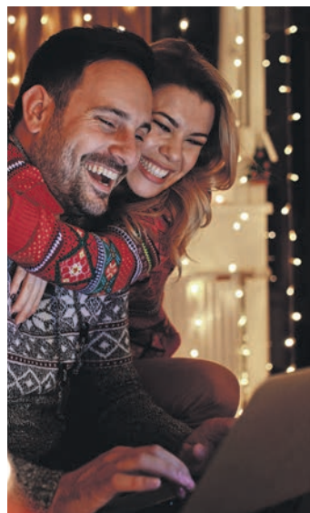
Weihnachtsstimmung kommt erst mit der stimmungsvollen Festbeleuchtung auf.

(DJD). Lichterketten, Sterne und Lampen sorgen in der Weihnachtszeit in den Städten und Privathäusern für eine Atmosphäre, auf die die Mehrheit der Menschen nicht verzichten will. Das bestätigt die diesjährige Weihnachtsumfrage im Auftrag des Energieversorgers LichtBlick. So wünschen sich 78 Prozent der Befragten eine Weihnachtsbeleuchtung an öffentlichen Plätzen und Gebäuden. Rund 20 Milliarden Lämpchen werden 2025 zu Weihnachten in den privaten Haushalten erglühen, das sind etwas weniger als im Vorjahr. „Ein Grund dafür könnte sein, dass viele ältere Leuchtgeräte aus konventionellen Lampen ihre Lebensdauer überschritten haben. Dafür spricht, dass der Anteil der LED-Lampen gleichzeitig gestiegen ist“, so Ata Mohajer, Communication Manager bei LichtBlick.