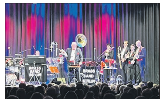
Die „Brass Band Berlin“ begeisterte mit ihrem Swing.

ding Ovationen. Viele ließen es sich auch nicht nehmen während des Konzerts vor der Bühne zu tanzen. Am Ende waren sich alle einig, ein „einmaliges Konzert“ mit meisterhaft gespieltem Jazz besucht zu haben.