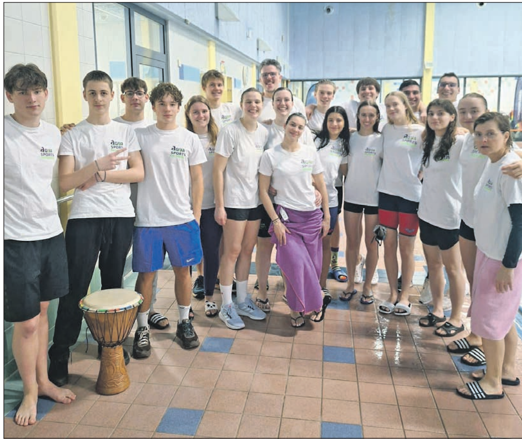
Beim Mannschaftswettbewerb in der Landesliga Hessen schlugen sich die Schwimmerinnen und Schwimmer von Aqua Sports Eschborn gut.