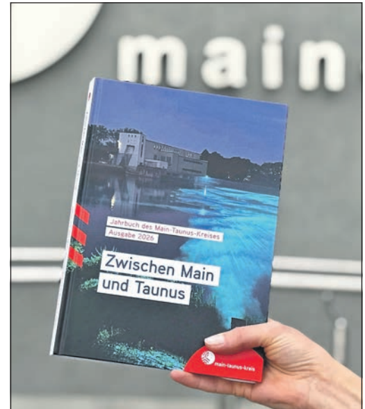
So sieht das neue Jahrbuch des Main-Taunus-Kreises aus.

handlungen im Kreis erhältlich und kann per E-Mail an kultur@mtk.org oder telefonisch unter der Nummer 06192-2011638 bestellt werden.