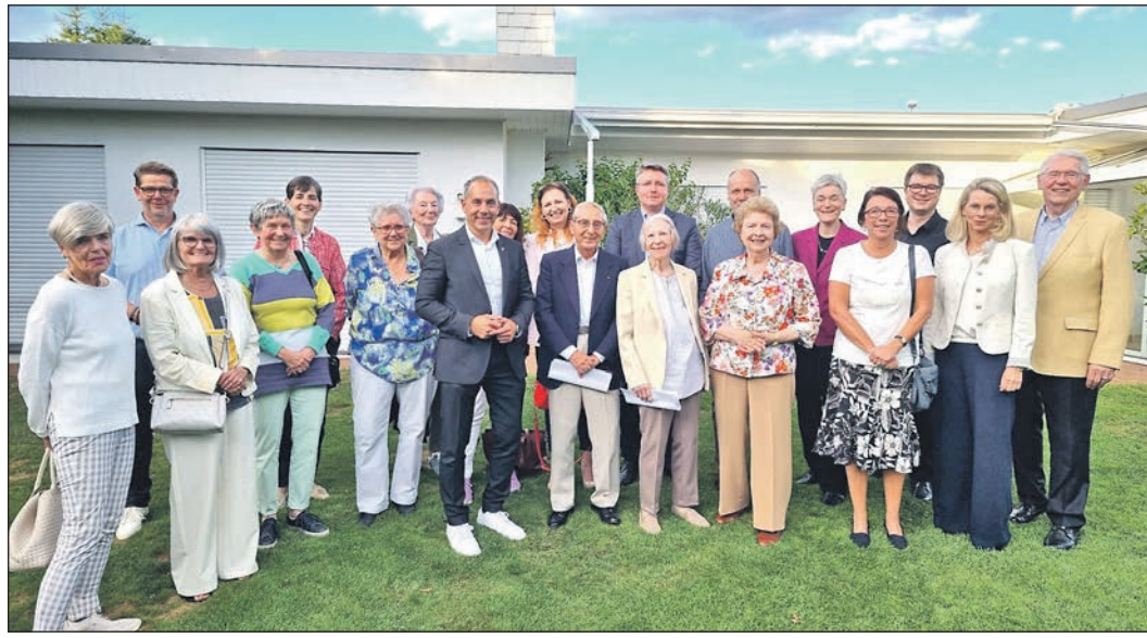
Der Förderkreis der Musikschule Taunus traf sich im Spätsommer in Eschborn zu seiner Mitgliederversammlung im Garten des Vorsitzenden.