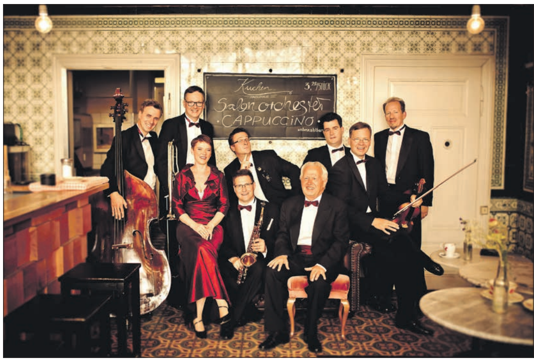
Das „Salonorchester Cappuccino“ spielt am 11. Januar beim Neujahrskonzert im Bürgerzentrum Niederhöhnstadt.

Das Neujahrskonzert ist als musikalischer Auftakt ins neue Jahr gedacht und führt durch bekannte Szenen des heiteren Musiktheaters. Karten kosten 15 Euro. Sie sind im Internet unter frankfurtticket.de erhältlich. Reservierungen sind außerdem telefonisch unter der Telefonnummer 06196-490180 möglich.