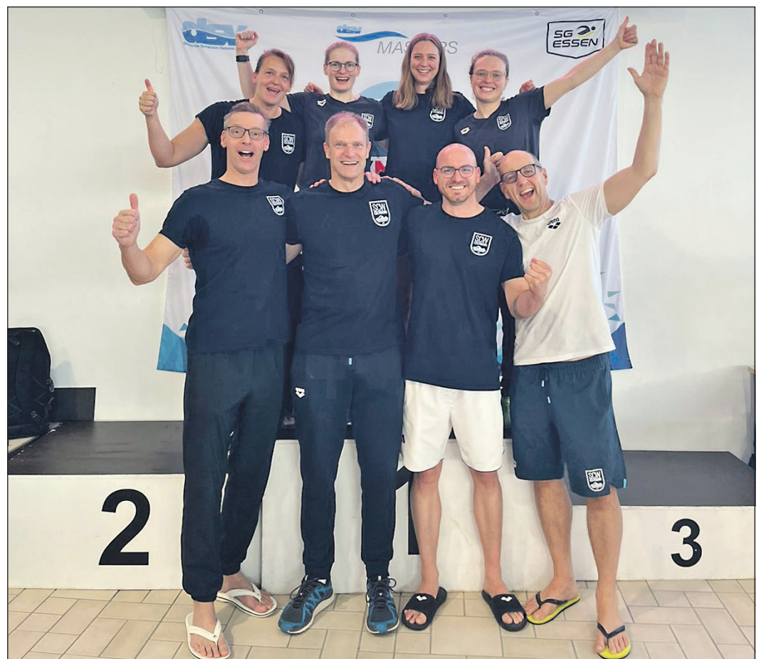
Die „Masters“ des SCW Eschborn gehören deutschlandweit zu den Besten.