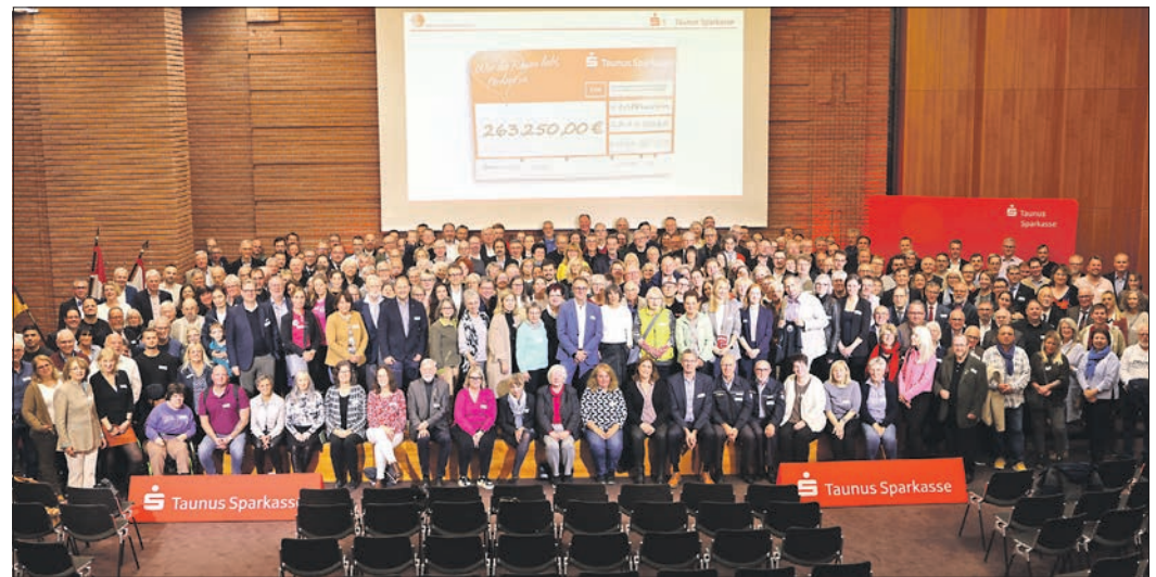
340 Vertreterinnen und Vertreter von Vereinen aus dem Main-Taunus-Kreis kamen am im November im Kreishaus zusammen. Insgesamt erhielten sie Spenden in Höhe von mehr als 260.000 Euro.