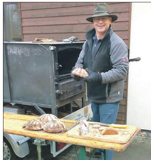
Viel zu tun hatte der Brauchtumsverein Niederhächstadt mit seinem mobilen Backofen.

Schwalbach/Eschborn (sz). Hessenforst hat am vergangenen Samstag gemeinsam mit dem Förderverein Arboretum am Waldhaus einen Weihnachtsbaumverkauf mit kleinem Weihnachtsmarkt organisiert.