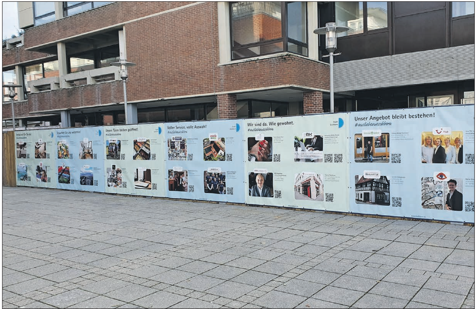
Ein erstes großes Banner mit Kurzinformationen über Eschborner Einzelhändler, Gastronomen und Betriebe rund um die Stadtmitte hängt seit Dienstag am Bauzaun vor der Rathaus-Baustelle.

Bad Soden (sz). Im Familienzentrum „Schatzinsel“ gibt es einmal im Monat einen kostenfreien Väter-Kinder-Treff für Väter mit Kindern bis drei Jahren. Sie können andere Väter kennenlernen, sich austauschen und mit ihren Kindern spielen. Auch ältere Geschwisterkinder sind willkommen. Das nächste Treffen ist am Samstag, 17. Januar, von 10 bis 12 Uhr mit der neuen Kursleitung. Eine Anmeldung ist nicht erforderlich, für die Planung aber willkommen. Weitere Informationen gibt es unter evangelische-familienbildung.de im Internet.