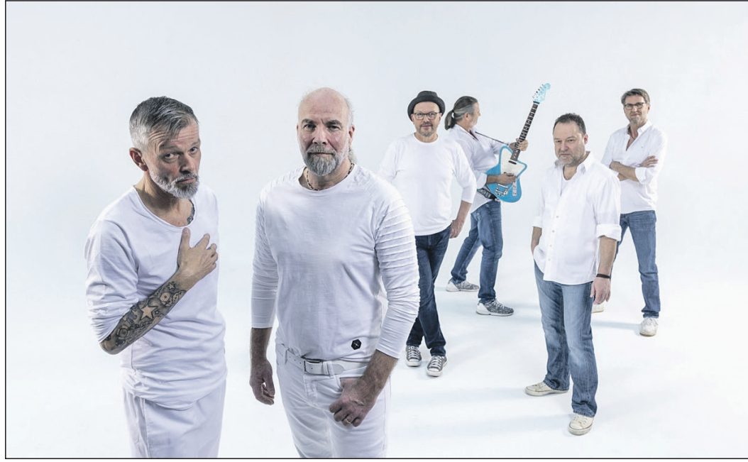
Die Band „Kharma“ wird im kommenden April beim nächsten Benefizkonzert des Lions Clubs Eschborn auf der Bühne des Bürgerzentrums stehen.