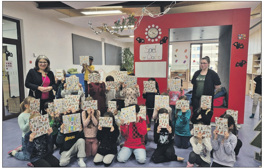
Erste Stadträtin Bärbel Grade (links) teilt im Hort Berliner Straße die Preise für die Kinder aus, die am Malwettbewerb der Stadt teilgenommen hatten.

Fische Verweigern Sie den Rat nicht, um den man Sie bittet. Dadurch kann ein aufkommender Streit, der auszuarten droht, mit relativ wenig Aufwand geschlichtet werden. 20. 2. – 20. 3.