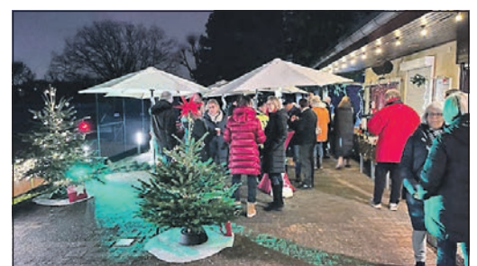
Auf der Clubterrasse feierten rund 40 Mitglieder den Jahresausklang.

Unterstützung im Laufe des Jahres. Auch Helferinnen und Helfer, die Veranstaltungen begleitet hatten, wurden erwähnt. Die erste Veranstaltung im neuen Jahr ist die Mitgliederversammlung am Freitag, 19. März.