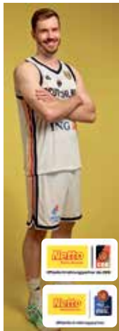
Nationalspieler Andi Obst als Markenbotschafter bei Netto Marken-Discount

sondern im Alltag. Wer mich kennt, weiß, dass ich als Ausgleich zum Sport leidenschaftlich gerne koche. Mit Netto habe ich den perfekten Partner gefunden, der mir für meine Kochabende genau die Frische und Vielfalt bietet, die ich für meine Ernährung brauche“, sagt Andi Obst. Die Partnerschaften mit der easyCredit Basketball Bundesliga und dem Netto BBL Pokal schaffen für den Lebensmittelhändler eine reichweitenstarke, ganzjährige Kommunikationsplattform. Im Mittelpunkt stehen Themen wie bewusste Ernährung, Bewegung, Teamgeist und Leistungsbereitschaft.