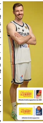
Nationalspieler Andi Obst als Markenbotschafter bei Netto Marken-Discount

sondern im Alltag. Wer mich kennt, weiß, dass ich als Ausgleich zum Sport leidenschaftlich gerne koche. Mit Netto habe ich den perfekten Partner gefunden, der mir für meine Kochabende genau die Frische und Vielfalt bietet, die ich für meine Ernährung brauche“, sagt Andi Obst. Die Partnerschaften mit der easyCredit Basketball Bundesliga und dem Netto BBL Pokal schaffen für den Lebensmittelhändler eine reichweitenstarke, ganzjährige Kommunikationsplattform. Im Mittelpunkt stehen Themen wie bewusste Ernährung, Bewegung, Teamgeist und Leistungsbereitschaft.