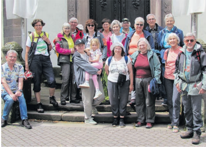
Geschafft: Die Wanderer des OWK Eppertshausen am Ziel ihrer vierägigen Moseltour.

pe perfekt auf die kommenden Tage im geschichtsträchtigen Moseltal ein.