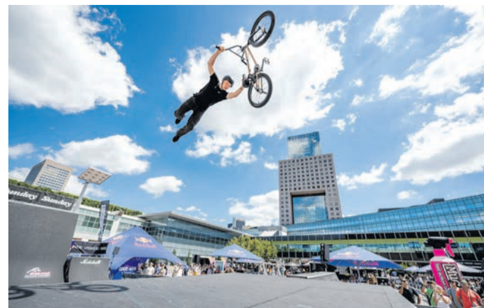
Auf der EUROBIKE 2026 vom 24. bis zum 27. Juni sieht man das ganze Spektrum von den Radherstellern, Zubehöranbietern bis zu den Nutzern jeder Altersklasse.

Ein Publikumsmagnet ist die Demo Area mit erweitertem Test Track. Dort können aktuelle Mo-