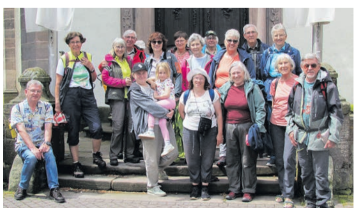
Am Sonntag machten sich die Teilnehmer der Lang- und Kurztour auf den Weg nach Gersfeld und erlebte die reizvolle Landschaft der Rhön mit ihren Wäldern, Höhenzügen und schönen Ausblicken.

ist herzlich willkommen und trägt zu einem vielfältigen Kuchenbuffet bei. Rund um den Otzberg: Wer möchte, kann unter Wanderverein „Frisch-Auf“ am 38. Wandertag „Rund um den Otzberg im Odenwald“ am Samstag und Sonntag, 20. und 21. Juni teilnehmen. Inmitten der schönen Landschaft rund um den Otzberg werden abwechslungsreiche Strecken über 6 km, 11 km und 21 km angeboten – ideal für Familien, Genusswanderer und sportlich Ambitionierte. Die Startgebühr beträgt 3 Euro. Besonders freuen sie sich auf die jüngsten Wanderfreunde: