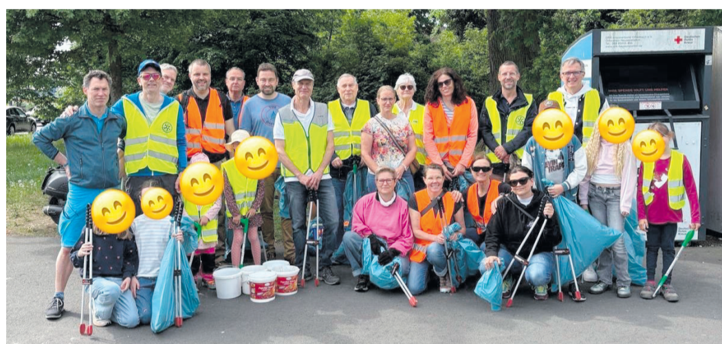
Gemeinsam für Heusenstamm: Rotarier (ROC Offenbach-Dreieich) und Naturengel.

Zwischen Plastikverpackungen, achtlos entsorgten Windeln und abgestellten Müllsäcken waren die Naturengel gemeinsam mit rotarischen Unterstützern unterwegs. Ausgerüstet mit Greifzangen und Müllbeuteln ging es bewusst auch abseits der Wege dorthin, wo Müll oft liegen bleibt. Bereits zum fünften Mal unterstützten die Naturengel Heusenstamm den Rotary Club Offenbach-Dreieich bei seiner