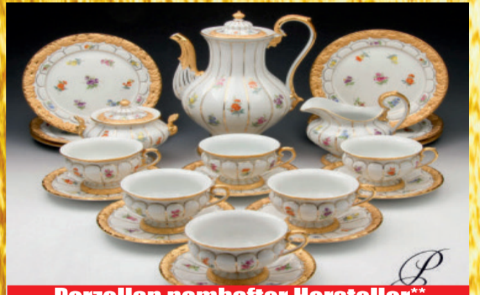
Porzellan namhafter Hersteller**