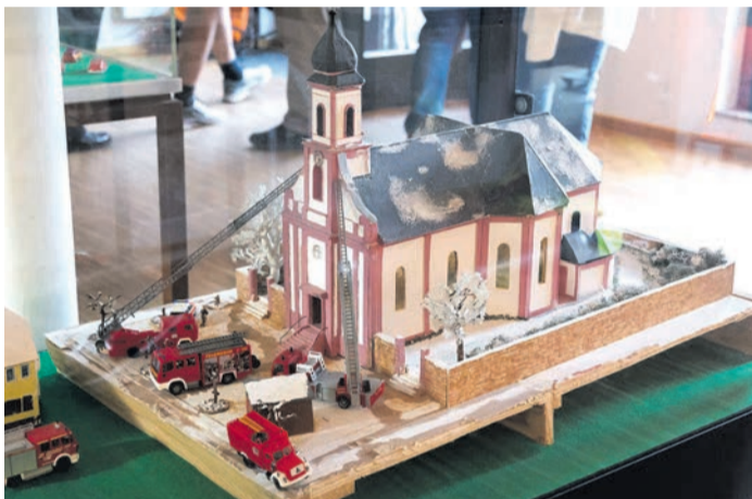
Ein Modell der Kirche St. Cäcilia mit Feuerwehrautos erinnert an den großen Brand.

ein Gemeinschaftswerk vieler Beteiligten. Zahlreiche historische Dokumente, Modelle und Tafeln wurden zusammengetragen, unter anderem mit Unterstützung des Modellsportclub Heusenstamm. Grundlage vieler Inhalte ist außerdem das neue Heusenstammer Heft „Wintergewitter“, das die Geschichte der Feuerwehr beleuchtet. Am Ende stand vor allem eines im Mittelpunkt: der Dank an die vielen Frauen und Männer, die seit 150 Jahren Verantwortung übernehmen und ihre Freizeit in den Dienst der Gemeinschaft stellen.