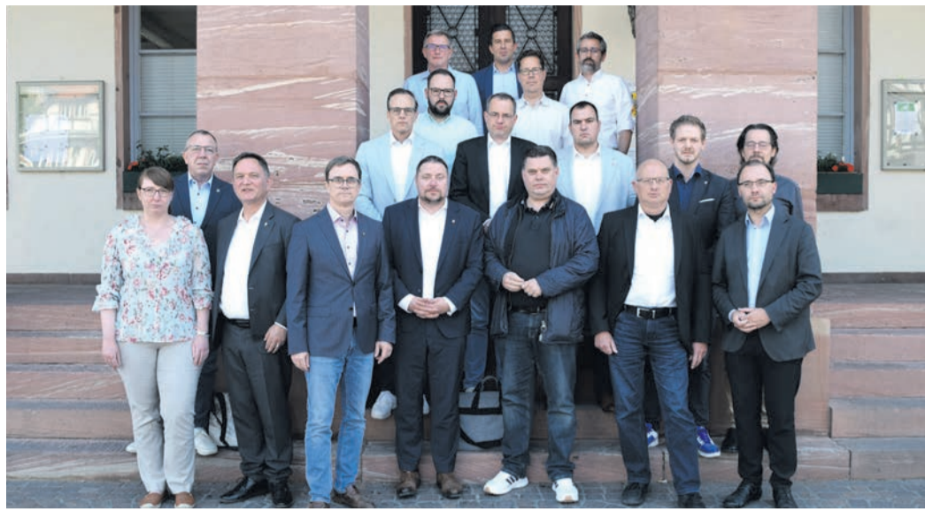
Gruppenfoto der Bürgermeister und Hauptamtlichen des Kreises Offenbach.

Die Städte und Gemeinden geraten zunehmend unter Druck. Ursache sind vor allem stetig wachsende Pflichtaufgaben, stark steigende Personal- und Sachkosten, einbrechende Steuereinnahmen sowie eine Dynamik bei den Sozialausgaben, die kommunale Haushalte vielerorts an ihre Belastungsgrenze bringen und nicht mehr genehmigungsfähig sind. Bereits im Vorjahr wurde mit der „Mainhäuser Erklärung“ auf die Situation aufmerksam gemacht. Diese hat zumindest beim Land Hessen in Teilen für Gehör gesorgt. Leider aber nur mit einem Einmaleffekt