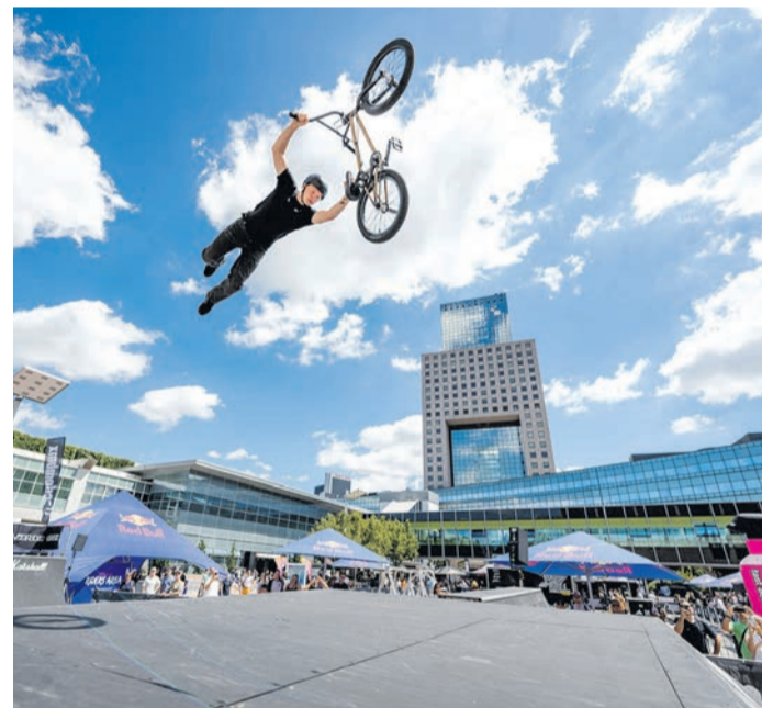
Auf der EUROBIKE 2026 vom 24. bis zum 27. Juni sieht man das ganze Spektrum von den Radherstellern, Zubehöranbietern bis zu den Nutzern jeder Altersklasse.

Die EUROBIKE findet vom 24. bis 27. Juni auf dem Messegelände Frankfurt statt. Geöffnet ist täglich von 9 bis 18 Uhr. Tickets und weitere Informationen gibt es unter www.eurobike.com .