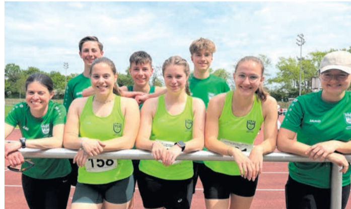
trotzdem an den Start gehen. weitere Athleten in Neu-Isenburg bei den Kreis-Einzel-Meisterschaften weiter. Viel Zeit

Obertshausen (NZO) Sonnencreme, Mützen und Wasser waren die wichtigsten Utensilien beim ersten Kinderleichtathletik-Wettkampf in Windecken am 2. Mai. Wie immer gut organisiert vom Team des erfahrenen Ausrichters absolvierten die Kinder einen Drei- bzw. Vierkampf und sammelten Punkte für ihre Teams. Leider waren diesmal nicht genügend Kinder für eine eigene TGO-Mannschaft zusammengekommen, aber Dank der Kooperationsregel konnten alle