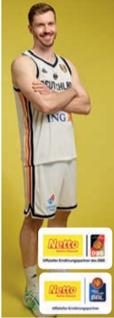
Nationalspieler Andi Obst als Markenbotschafter bei Netto Marken-Discount

Treffericherheit, Tempo und Teamgeist: Damit überzeugt Basketball-Weltmeister Andi Obst auf dem Court - und künftig auch die gemeinsame Markenkommunikation mit Netto Marken-Discount. Im Rahmen der Ernährungspartnerschaft mit den Nationalmannschaften des Deutschen Basketball Bundes (Deutscher Basketball Bund) gewinnt der Lebensmittelhändler den Profi-Basketballer als Markenbotschafter. Gleichzeitig baut Netto sein Engagement im deutschen Basketball weiter aus und ist künftig offizieller Ernährungspartner der easyCredit Basketball Bundesliga (BBL) sowie Namensgeber des Netto BBL Pokals. „Basketball ist Teamarbeit - und Leistung beginnt für mich nicht erst auf dem Court, sondern im Alltag. Wer mich kennt, weiß, dass ich als Ausgleich zum Sport leidenschaftlich gerne koche. Mit Netto habe ich den perfekten Partner gefunden, der mir für meine Kochabende genau die Frische und Vielfalt bietet, die ich für meine Ernährung brauche“, sagt Andi Obst. Die Partnerschaften mit der easyCredit Basketball Bundesliga und dem Netto BBL Pokal schaffen für den Lebensmittelhändler eine reichweitenstarke, ganzjährige Kommunikationsplattform. Im Mittelpunkt stehen Themen wie bewusste Ernährung, Bewegung, Teamgeist und Leistungsbereitschaft.