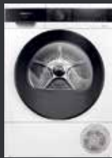
Siemens Wärmepumpentrockner iQ500 WQ35G2D00 8kg

Nur 61 dB Betriebsgeräusch | speedPack für schnelles und effizientes Trocknen | Halbe Beladung mit automatischer Programmanpassung | Großes LED-Display für einfache und komfortable Bedienung