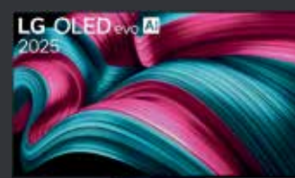
LG OLED65C57LA OLED evo TV (Flat, 65 Zoll / 165 cm, OLED 4K, SMART TV)

OLED evo Technologie mit brillanten Farben und hoher Helligkeit | 65 Zoll (165 cm) 4K-UHD-Auflösung | Smart TV mit Streaming-Diensten und KI-Unterstützung | AI-Optimierung für Bild und Ton | Elegantes, ultraflaches Design mit schmalem Rahmen