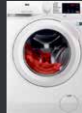
AEG L6FBF57480 Serie 6000 ProSense mit Mengenautomatik Waschmaschine (8 kg, 1351 U/Min., A)