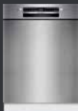
Bosch SMU4HTS14E Unterbau-Geschirrspüler 60 cm Edelstahl

VarioFlex-Körbe für mehr Flexibilität und Platz | 3-fach Rackmatik mit bis zu 5 cm Höhenverstellung | Silence Programm für besonders leisen Betrieb | Smart Start für günstige Stromzeiten | Hygienelevel bestätigt im Eco 50 °C Programm | Erhöhte Hygiene bei Intensiv 70 °C und Maschinenpflege