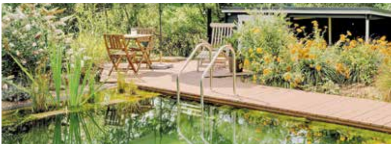
Natur, Komfort und Design vereint: Der Garten wird mit einer individuellen Gestaltung zum privaten Naherholungsraum.

DJD | Der Garten wird zunehmend als erweitertes Wohnzimmer genutzt. Damit steigen auch die Ansprüche an die Einrichtung und Gestaltung. Im Trend für diesen Sommer liegen vor allem natürliche Optiken, langlebige Materialien und durchdachte Lösungen für mehr Komfort im Alltag. So gilt etwa WPC, ein Verbundwerkstoff aus Holz und Kunststoff, als clevere Lösung, die eine warme Holzoptik mit hoher Witterungsbeständigkeit vereint. Neben der Ästhetik zählt Funktionalität durch clevere Befestigungen und dezente Aufbewahrungssysteme zum Beispiel für Mülltonnen. Viele weitere Inspirationen bietet der aktuelle Gartenkatalog von Raab Karcher, Keramundo und Balzer, der praktische Lösungen und alle Trends rund um Materialien, Gestaltung und Nutzung aufgreift.