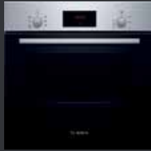
Bosch HBF 133 BR 0 Backofen 3D Heißluft Edelstahl