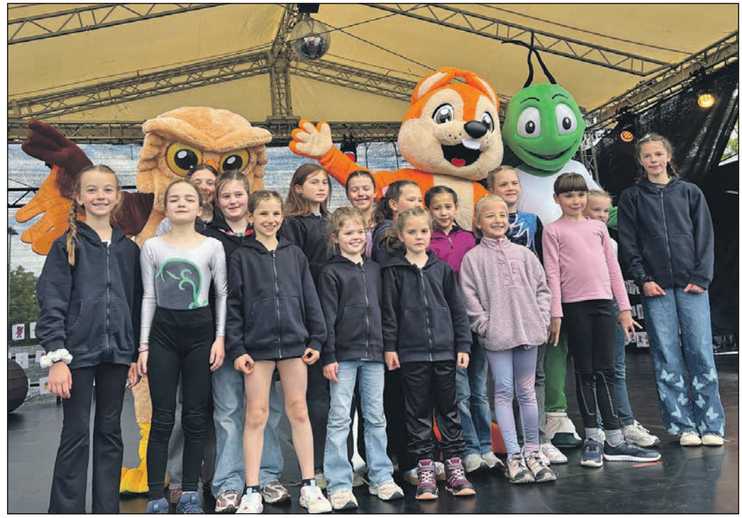
Mit mehreren Gruppen reiste der TV Eschborn zum Landeskinderturnfest nach Limburg, wo gleich drei Maskottchen für Fototermine bereit standen.