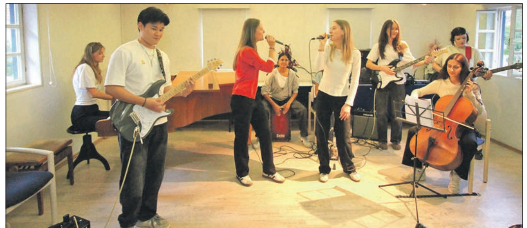
Die Band „Till the End“, die aus Schülerinnen und Schülern der HvK besteht, trat beim jüngsten Museumskonzert auf.

Programm. Erstmals trat die Band „Till the End“ bei den Museumskonzerten auf. Die Schülerinnen und Schüler des Abiturjahrgangs der Heinrich-von-Kleist-Schule spielten unter anderem Songs von Bryan Adams und Samu Haber. Außerdem standen Musik aus Musicals und Fernsehserien sowie Werke von Frédéric Chopin und Edvard Grieg auf dem Programm.