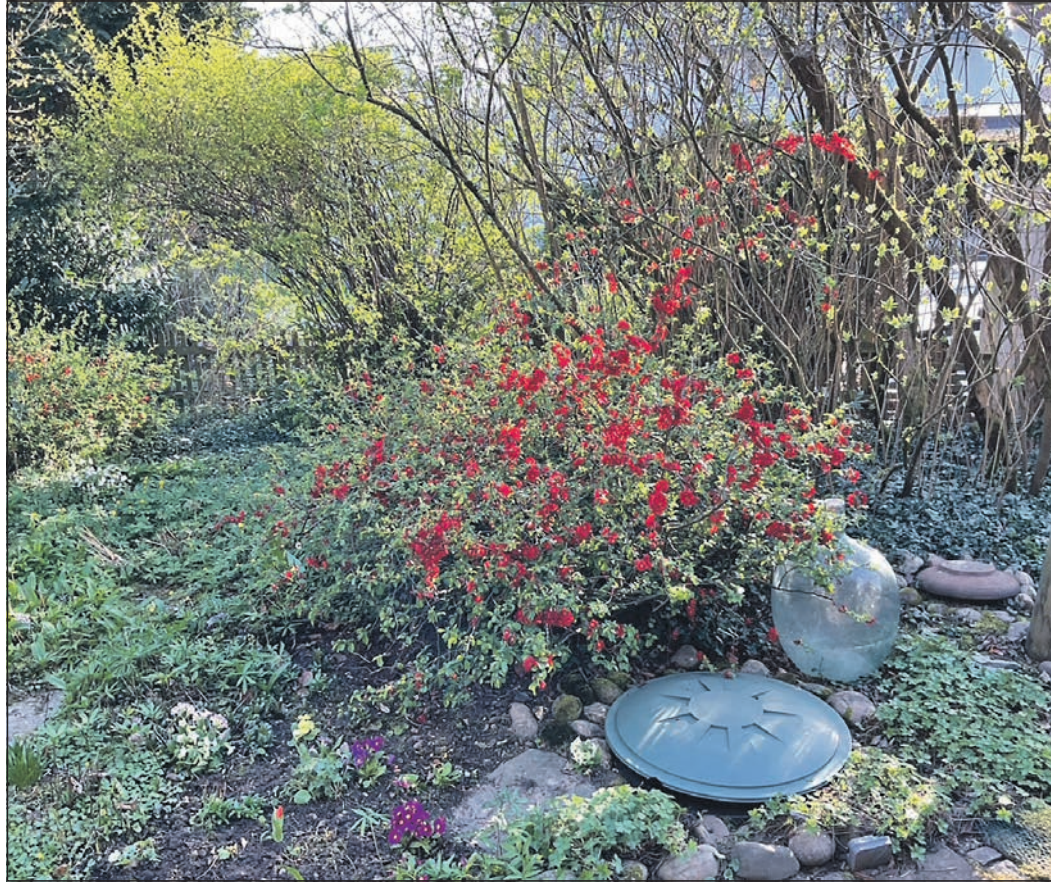
Die wilde Zierquitten blüht feuerrot und liefert schmackhafte Früchte.