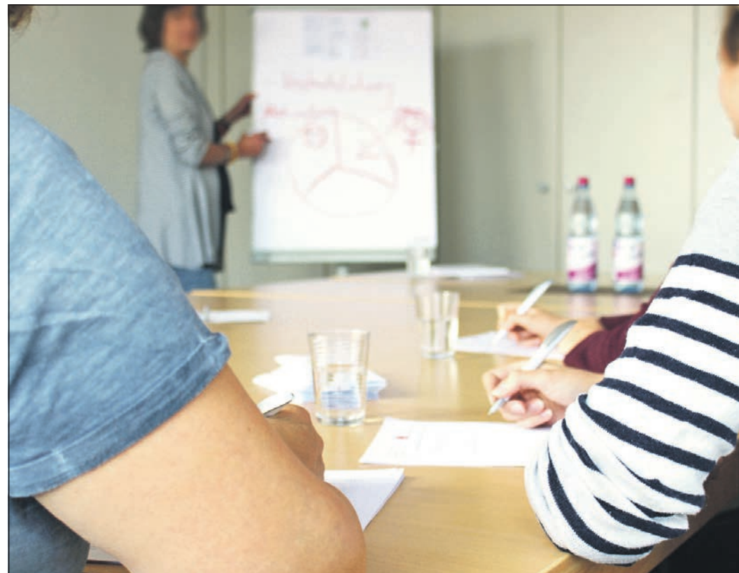
Der Main-Taunus-Kreis bietet im Rahmen des Programms „Frau & Job“ auch im Juni zahlreiche Kurse und Workshops an.

Das Frühjahrsprogramm mit allen Details kann auf der Internetseite des Main-Taunus-Kreises unter mtk.org/frauundjob heruntergeladen werden. Informationen gibt es auch per E-Mail an frauen-events@mtk.org oder unter der Telefonnummer 06192-2011845.