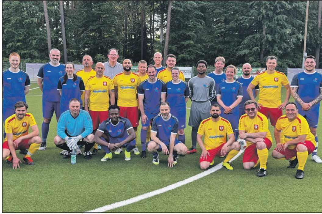
Die Mannschaft der städtischen Körperschaften (gelbe Trikots) setzten sich in Zellhausen gegen die „TPI Vermessungsgesellschaft“ durch.