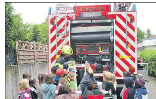
Höhepunkt der Brandschutzwochen der Kita „Rosenweg“ war der Besuch bei der Feuerwehr in Niederhöhnstadt.

spritzen und Feuerwehrkleidung anprobieren. Zum Abschluss fand eine Räumungsübung mit der Feuerwehr statt.