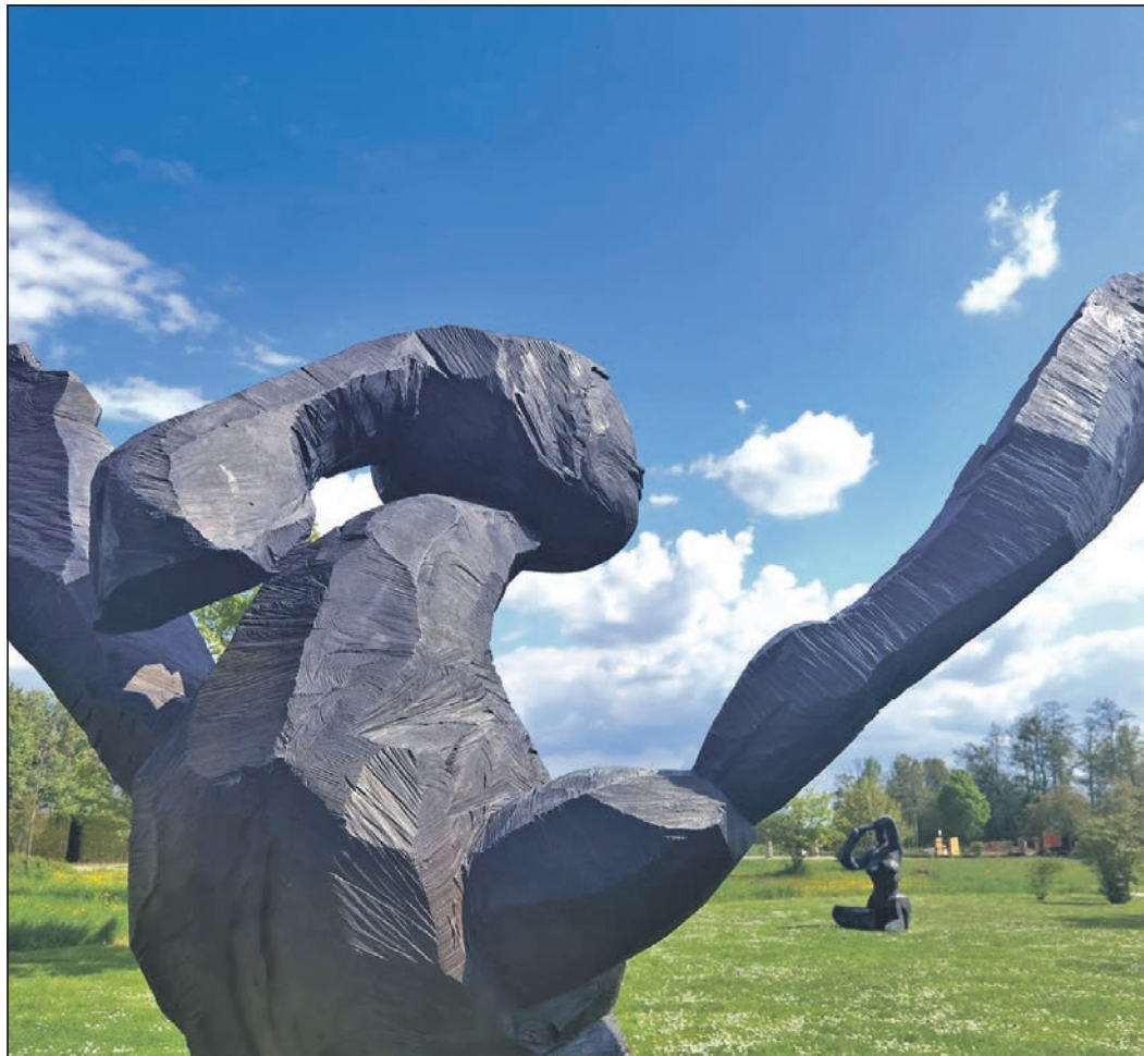
Eine Führung zu den 13 Kunstwerken im Skulpturenpark Niederhöhnstadt gibt es zum Gartenfestival „Rendezvous im Garten“ am 6. Juni.