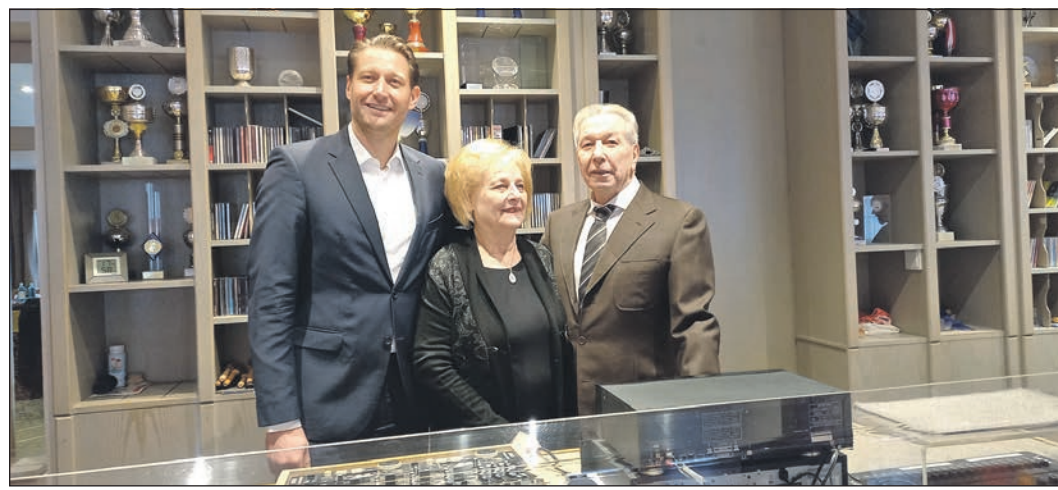
Hinter dem Mischpult der Tanzschule von Renate und Rüstem Karabey fühlt sich Oberbürgermeister Alexander Hetjes sichtlich wohl.