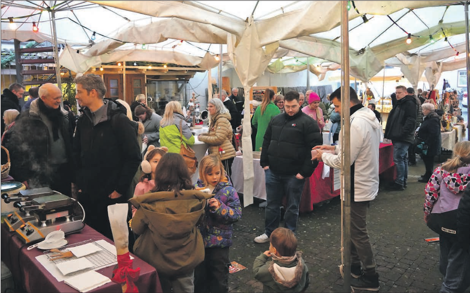
Die Besucher schlendern durch den Hof des Heimatmuseums Seulberg.