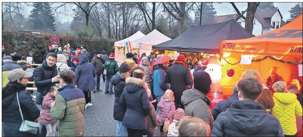
Klein, aber fein. Auf dem Kirdorfer Weihnachtsmarkt, der auf dem Parkplatz vor dem Schwesternhaus stattfindet, rücken die Besucher gesellig zusammen.