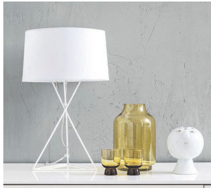
Weniger ist mehr: Wände in Sichtbeton-Optik verleihen der Wohnung einen industriellen Charme.

(DJD). Sichtbeton setzt markante Akzente im Innendesign. Der elegante, rohe Look prägt nicht nur Restaurants und Hotels, sondern zunehmend auch private Wohnräume. Der angesagte Stil lässt sich zum Beispiel mit der Trendstruktur „Sichtbeton-Optik“ von Schöner Wohnen-Farbe erstaunlich realistisch nachbilden. Zwei Schichten, zuerst die Grundfarbe und dann der Effektpachtel, erzeugen Farbe, Tiefe sowie die typischen Ausbrüche. Mit einer Kreativfolie entstehen kleine Luftporen, die später wie echte Materialporen wirken. Glatte Untergründe und eine sorgfältige Vorbereitung sorgen für ein authentisches Ergebnis. So entsteht eine Wandgestaltung mit industriellem, minimalistischem Flair. Unter www.schoener-wohnen-farbe.com finden sich weitere Tipps zur kreativen Wandgestaltung.