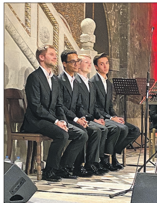
Die vier Sänger des A-Cappella-Quartetts „German Gents“ aus Berlin.