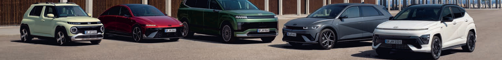
Abb. zeigen Sonderausstattung