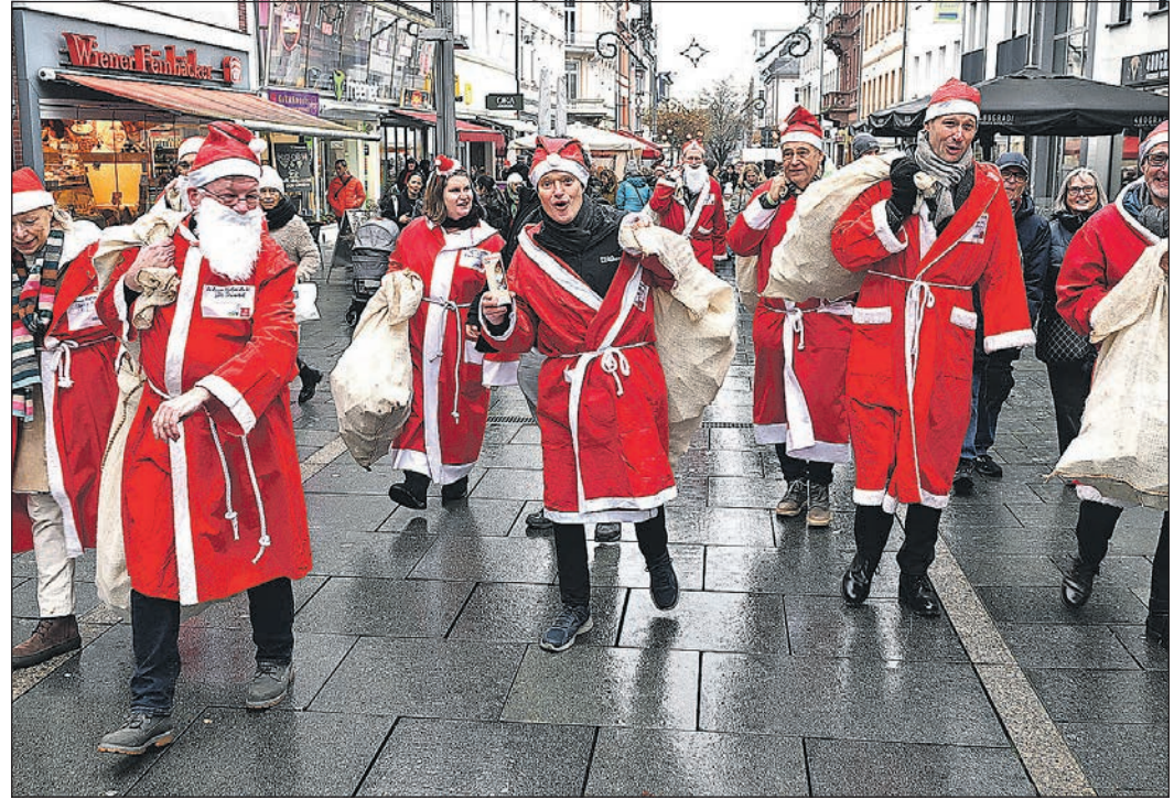
Die prominenten Nikoläuse ziehen durch die Stadt und verteilen fair produzierte und gehandelte Nikoläuse.