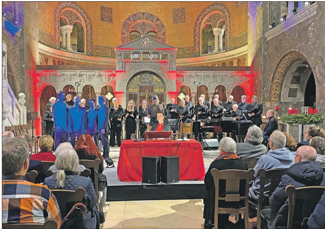
Im festlichen Ambiente der Erlöserkirche liest die Schauspielerin Katharina Wackernagel Märchen aus aller Welt.

An Chanukka, das in diesem Jahr auf den Zeitraum vom 14. bis zum 22. Dezember fällt, wird der Wiedereinweihung des zweiten jüdischen Tempels in Jerusalem gedacht. Die Menora soll niemals erlöschen. Sie besteht aus acht beziehungsweise neun Armen, jeden Tag des Lichterfestes wird eine Kerze angezündet.