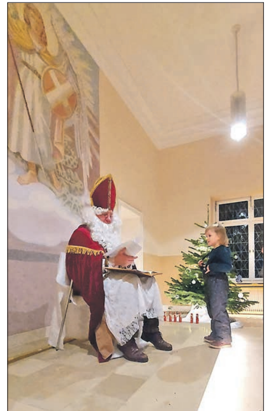
Der Nikolaus weiß alles. Das kleine Mädchen schaut gespannt, was der Heilige über sie in sein Buch geschrieben hat.

Während die Kinder geduldig in der Schlange warteten, versanken die Eltern in Erinnerungen. Viele dachten daran, wie sie sich früher vor dem Fest besonders gut benommen hatten, damit im Buch nichts „Unangenehmes“ stand. Manche erinnerten sich sogar an einen Rat des Nikolaus, der ihnen wichtig wurde und bis heute nicht vergessen ist. Genau darin liegt das Geheimnis dieses Festes. Nikolaus ist nicht nur ein Verteiler von Süßigkeiten. Er ist ein Hüter der kleinen, aber wichtigen Werte: Freundlichkeit, Mut, Fürsorge, Ehrlichkeit. Er hilft dabei, sich daran zu erinnern, dass gute Taten Bedeutung haben und dass das Verbessern von Fehlern keine Strafe ist, sondern ein Weg. Deshalb kommt der Nikolaus jedes Jahr zurück. Nicht um zu kontrollieren, sondern um zu inspirieren.