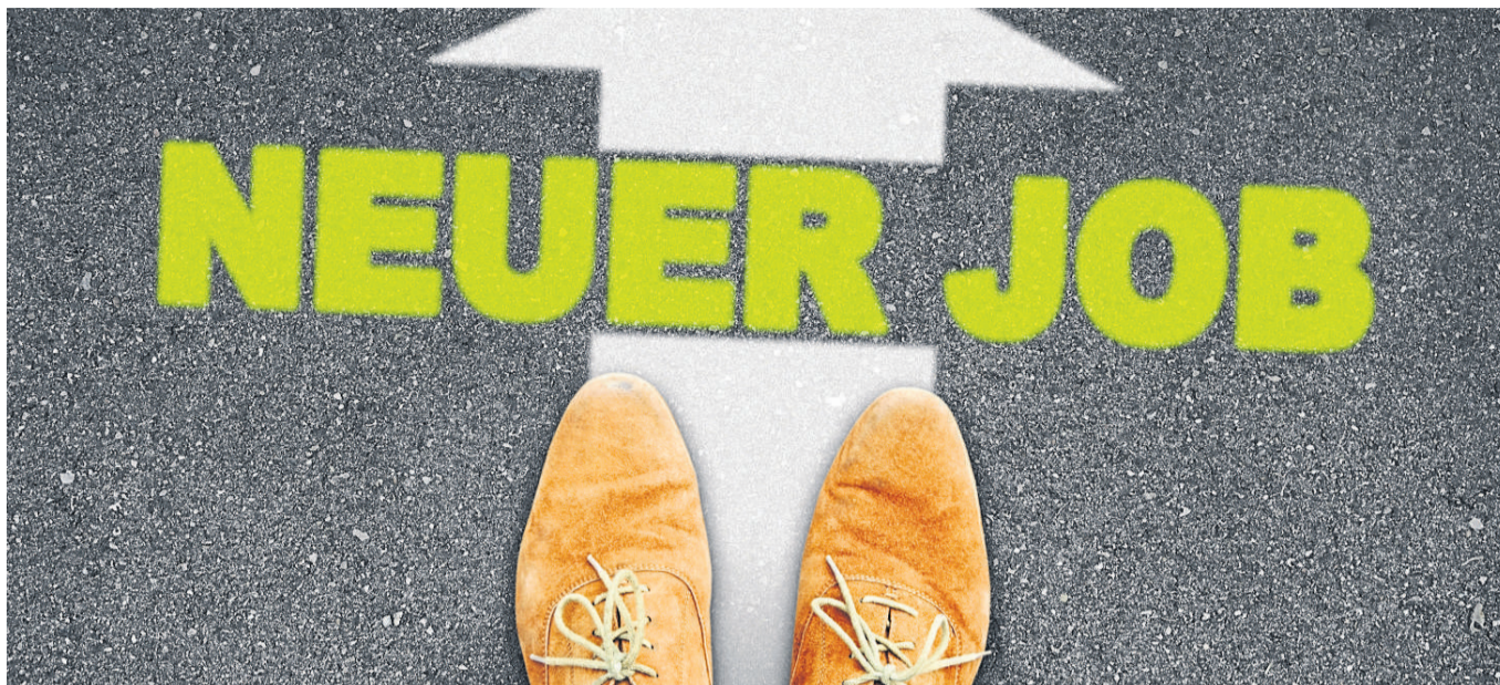
Bescheidenheit ist zwar eine Zier, aber im Vorstellungsgespräch muss man schon ein bisschen trommeln, um an einen neuen Job zu kommen.