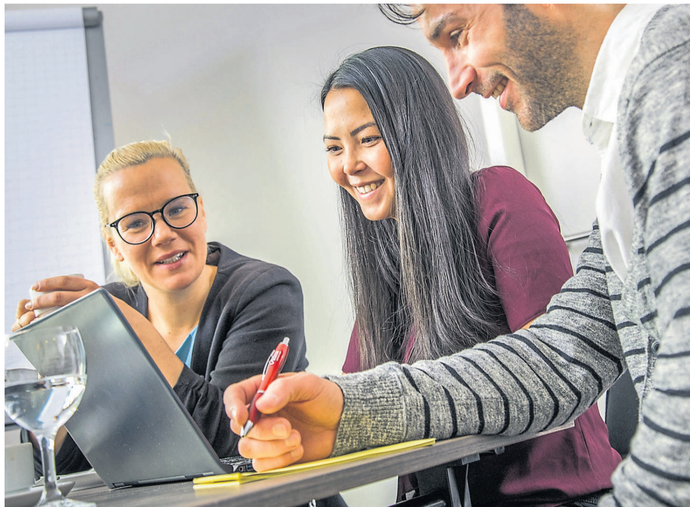
Divers, flexibel und hybrid: In einer sich verändernden Arbeitswelt braucht es die passenden Soft Skills.