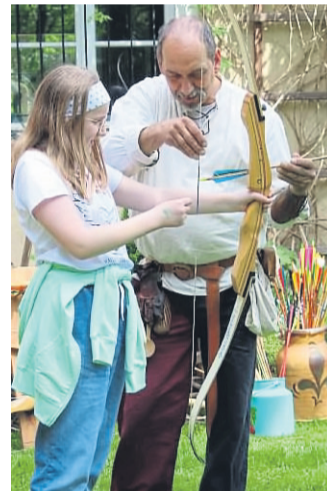
Im Burggarten konnte man sich im Bogenschießen üben.

Zwei Jahre konnte das beliebte Apfelblütenfest auf der Burg Brandenstein wegen der Pandemie nicht stattfinden. Am vergangenen Wochenende war es wieder mal soweit – punktgenau zur derzeitigen Blüte der Apfelbäume fand die Veranstaltung eine gute Resonanz. Die zweitägige Veranstaltung fand nunmehr zum 22. Mal statt. Dass es nicht nur Besucher aus dem Bergwinkel-Bereich gab, sondern auch weit darüber hinaus, war an den Auto-Kenn-