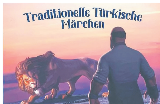
Die im türkischen Gaziantep erstellte Märchenbroschüre liegt in deutscher Sprache vor.

Die in Steinau ansässigen Märchenerzählerinnen tragen dazu natürlich einen großen Teil bei. Eine Delegation