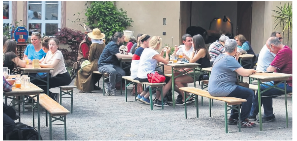
Viele Besucher hatten den Weg zur Burg Brandenstein zum traditionellen Apfelblütenfest gefunden.