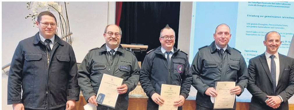
Auf der Jahreshauptversammlung wurden Einsatzkräfte befördert.

Neue Wege geht die Feuerwehr mit der Einrichtung ei-