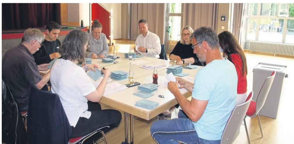
Die Briefwahlvorstände sorgen für zeitnahes Auszählen der abgegebenen Stimmen.

bewegt und sich diesen Vertrauensbeweis redlich verdient.“ Wichtig sei, dass trotz Corona, Lieferproblemen der Wirtschaft und Ukraine-Krieg der Haushalt nicht gefährdet sei. Die Stadt habe ausreichend Rücklagen gebildet, sodass auf die Bürgerinnen und Bürgern in den kommenden Jahren keine höheren steuerlichen Belastungen zukommen würden.