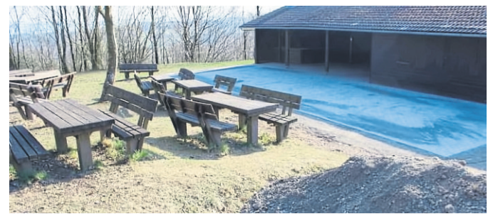
Die Grillanlage in Breitenbach mit dem neuen gepflasterten Vorplatz.