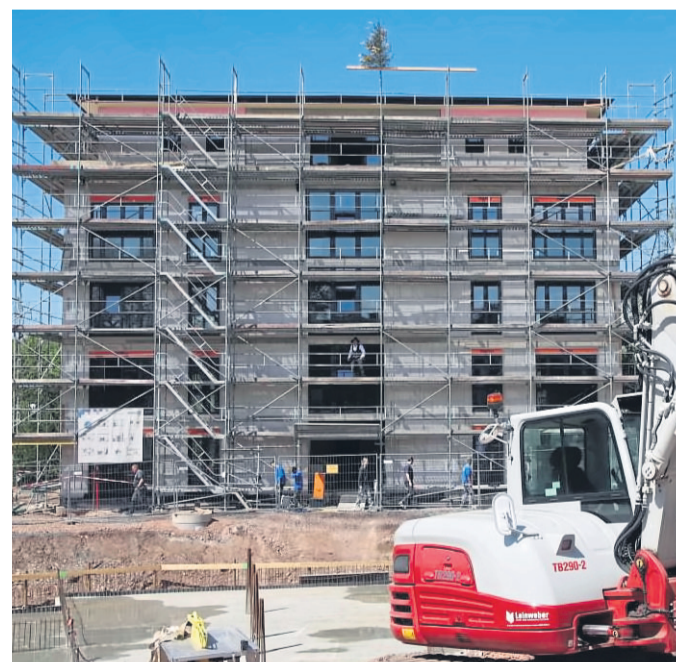
Für die erste von vier Wohneinheiten bei „Elmland 1“ wurde jetzt Richtfest gefeiert.