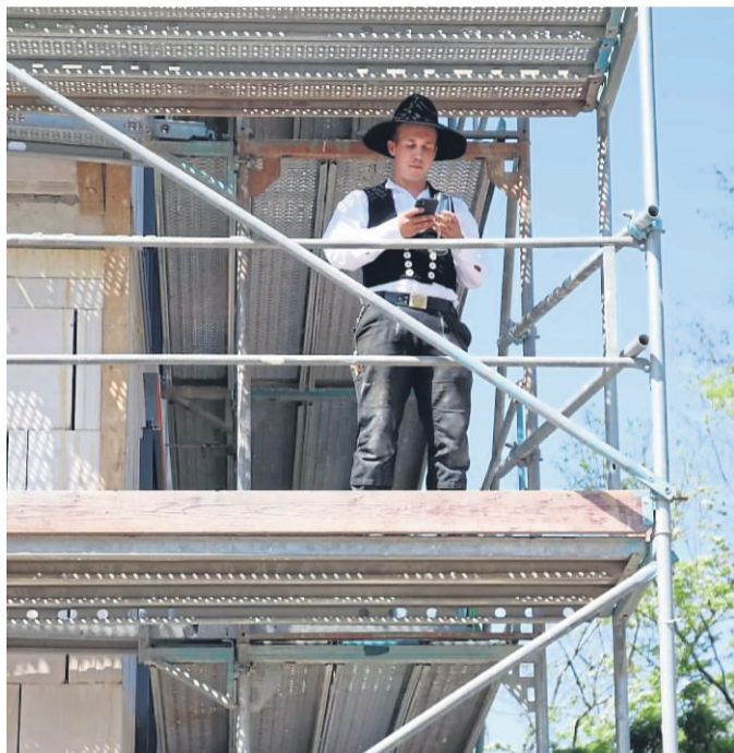
Traditionell wurde der Richtspruch von hoher Position vorgelesen.

denplatte für Haus 3 gegossen. Von diesem ist bereits ebenfalls ein Großteil der Einheiten verkauft. In einem weiteren Bauabschnitt sollen noch die Häuser 1 und 2 entstehen. Auch hier gibt es nach Angaben der Investoren eine große Nachfrage. RI