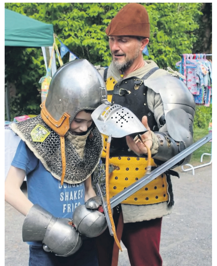
Kinder konnten sich in mittelalterlicher Rüstung an den Schwertern ausprobieren.

Zwei Jahre konnte das beliebte Apfelblütenfest auf der Burg Brandenstein wegen der Pandemie nicht stattfinden. Am vergangenen Wochenende war es wieder mal soweit – punktgenau zur derzeitigen Blüte der Apfelbäume fand die Veranstaltung eine gute Resonanz. Die zweitägige Veranstaltung fand nunmehr zum 22. Mal statt. Dass es nicht nur Besucher aus dem Bergwinkel-Bereich gab, sondern auch weit darüber hinaus, war an den Auto-Kenn-