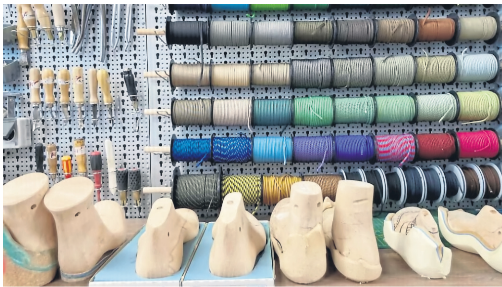
Orthopädische Maßschuhe und Therapieschuhe sowie Schurzurichtungen und Sicherheitsschuhe gehören zu den Leistungen von Footopia in Steinau.