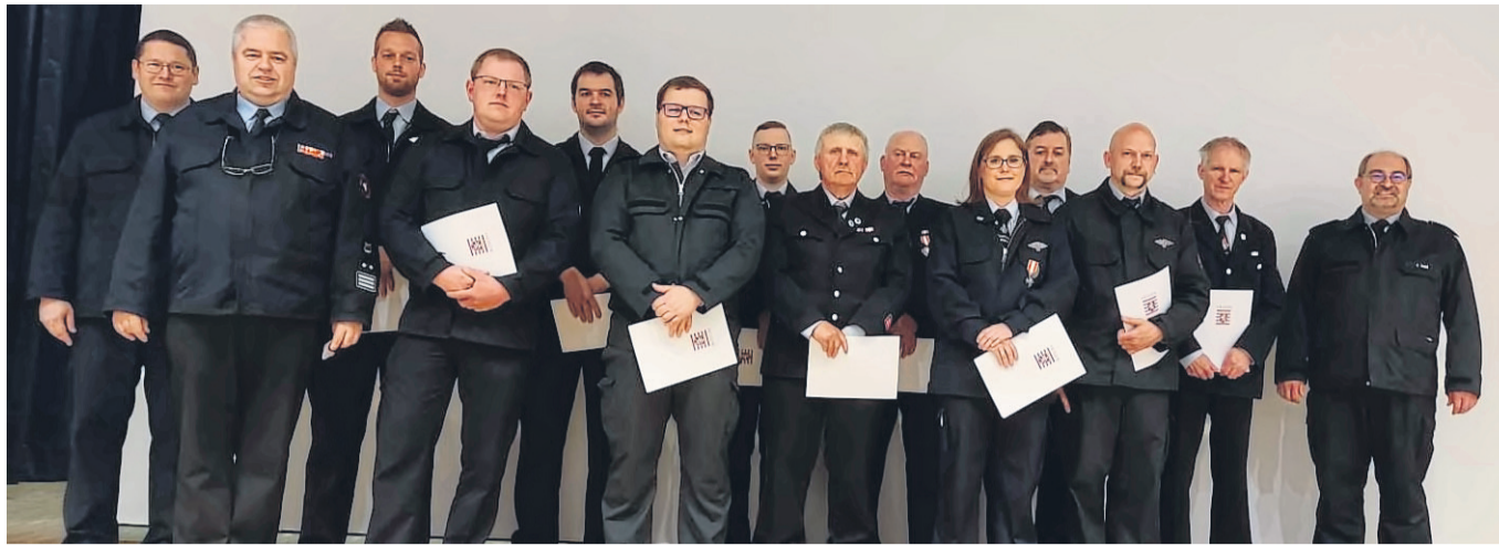
Für jahrelangen aktiven Einsatzdienst erhielten zahlreiche Wehrleute Anerkennungsprämien.