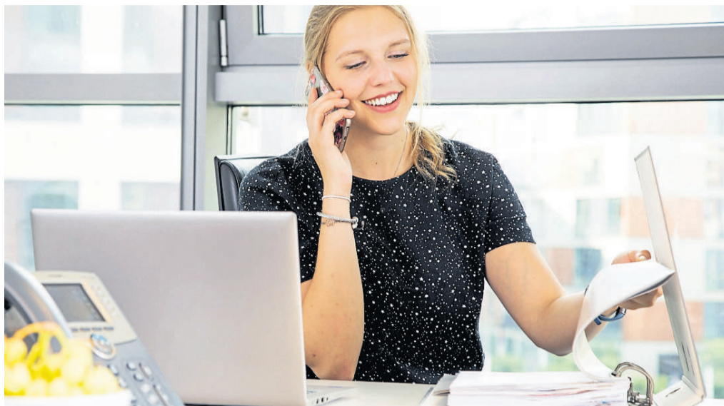
Wer beruflich viele verschiedene Kompetenzen mitbringt, wird auf dem Arbeitsmarkt oft als Generalistin bezeichnet.