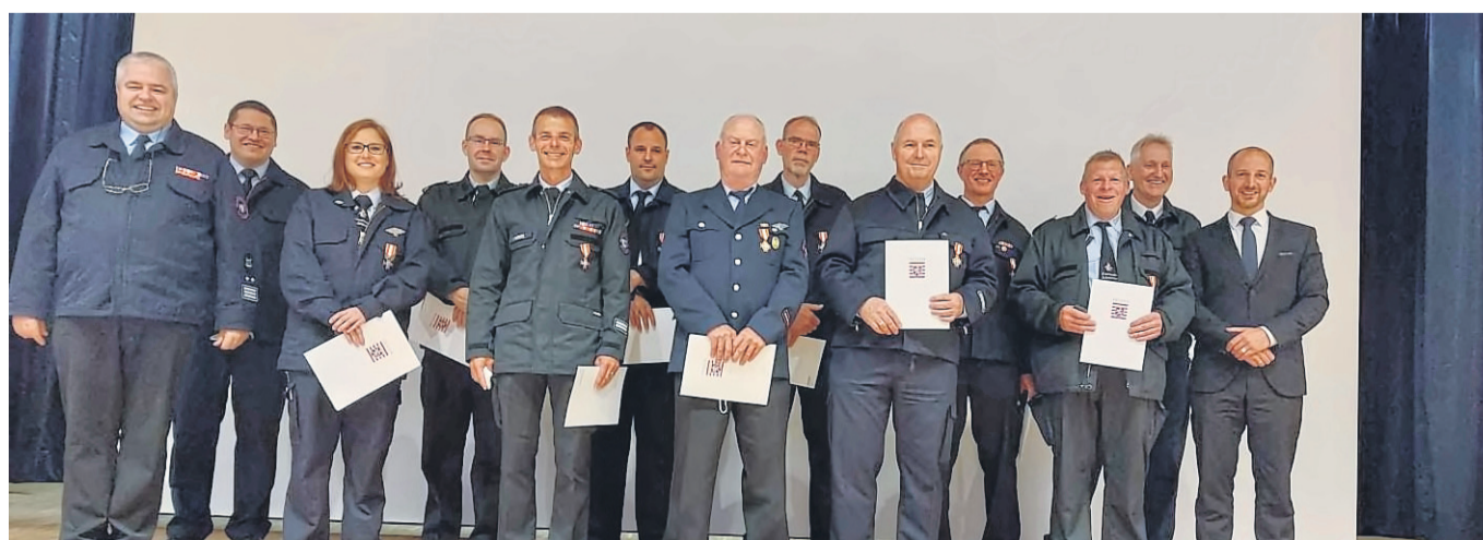
Verdiente Wehrleute wurden mit dem Brandschutzehrenzeichen des Landes Hessen ausgezeichnet.