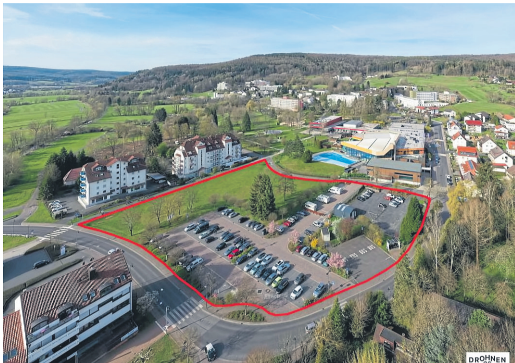
Mit einer Neuarrondierung ihrer Kureingangszone beabsichtigt Bad Soden-Salmünster eine umfassende Neuausrichtung ihres Kongress-, Gesundheits- und Freizeitbereichs.