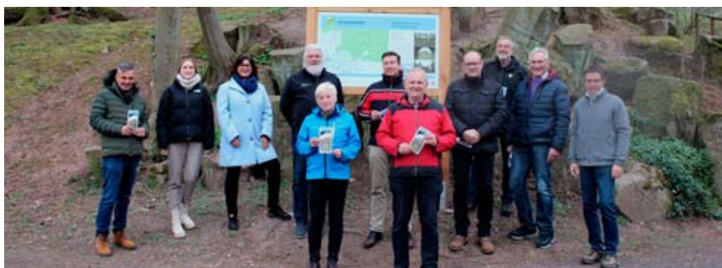
Das Gruppenbild entstand bei der offiziellen Eröffnung der Spessartspur „Ramholzer Schlosspark und Burg Steckelberg“ auf dem Parkplatz der Schloss-Orangerie.

Internet naturpark-hessischer-spessart.de spessart-tourismus.de