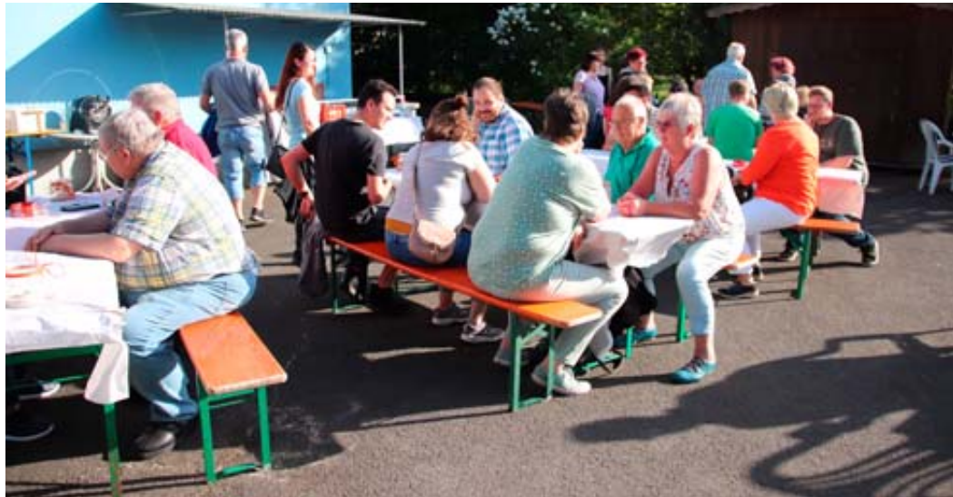
Erst das Pflichtprogramm, dann das Vergnügen: Nach der Jahreshauptversammlung der Karnevalisten saßen alle noch fröhlich bei einem Grillfest zusammen.