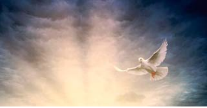
Seit etwa Ende des vierten Jahrhunderts wird das Pfingstfest 50 Tage nach Ostern gefeiert.

Schlüchtern: Samstag, 17.30 Uhr: Vortrag „Vortrag „Ist die Dreieinigkeit eine biblische Lehre?““. Anschließend wird das Thema: „Was Älteste von Paulus lernen können“ besprochen. – Mittwoch, 19 Uhr: Dreiteiliges Programm „Unser Leben und Dienst als Christ“. Zugang zu den virtuellen Treffen gibt es für alle Interessierten unter der Telefonnummer (01577) 3434237. Gottesdienste in Präsenz: Königreichssaal, Schlierbacher Straße 41, Wächtersbach.