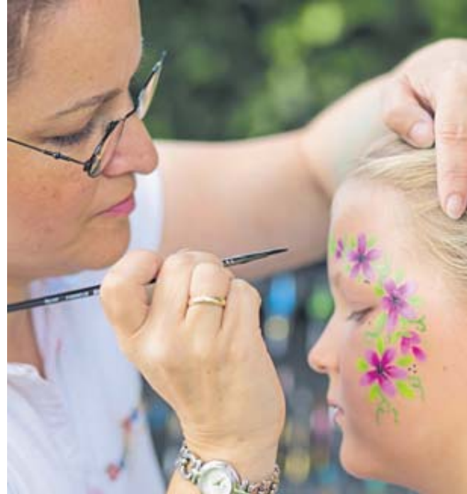
Fantasievolle Motive werden am Samstag die Kindergesichter zieren.

Mit dem SunnyFACES-Kindersmink & Partyevent zehnjähriges Firmenbestehen. Mit dem SunnyFACES-Kindersmink & Partyevent zehnjähriges Firmenbestehen. Mit dem SunnyFACES-Kindersmink & Partyevent zehnjähriges Firmenbestehen.