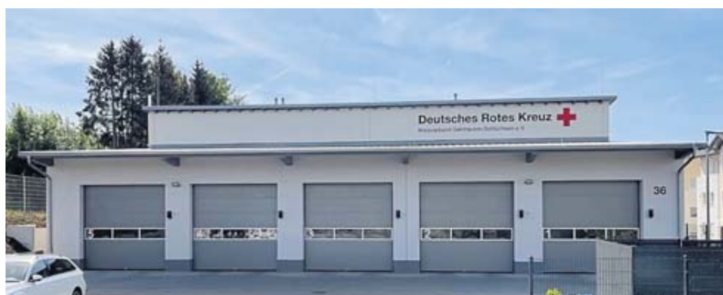
Von hier starten die Retter zu ihren Einsätzen.

ten. Für die jüngsten Gäste steht die Kletterwand der Bergwacht und eine Hüpfburg in Form eines Rettungswagens bereit, sie können zudem den Pflaster-Führerschein erwerben. Eine Foto-Ausstellung vermittelt einen Eindruck von den unterschiedlichen Bauphasen. Auch kulinarisch ist das DRK bestens vorbereitet: Das Grillteam serviert den Gästen Bratwurst und Hamburger vom Grill, das Jugendrotkreuz bietet Waffeln an. BWB