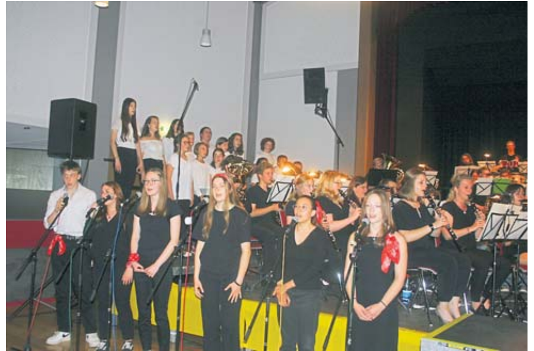
Vocalensemble und Chor ließen das Musical „Les Misérables“ wieder aufleben.