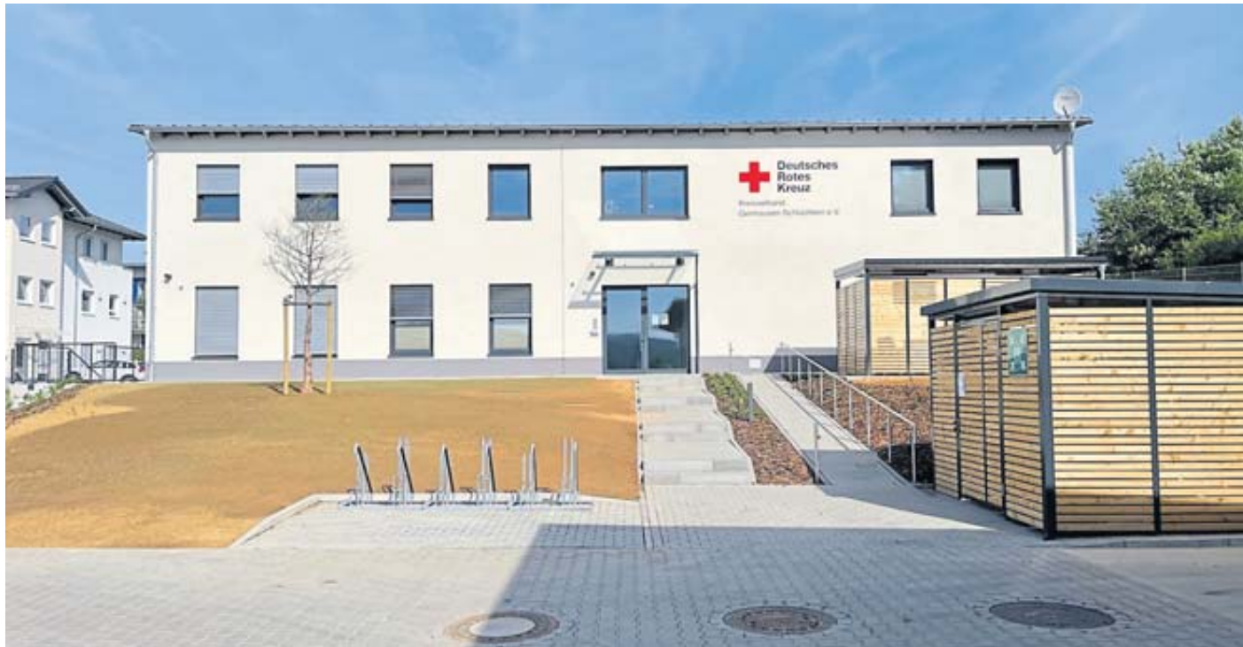
Ein Tag der offenen Tür ermöglicht am 11. Juni Neugierigen Einblicke in das moderne Gebäude.