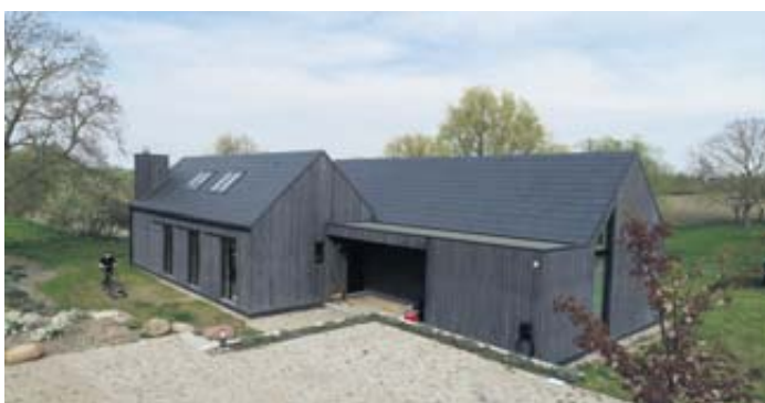
Wohnen mit der Natur: Beim Bau des Scheunenhauses achteten die Besitzer auf natürliche Materialien. Die Wände sind aus Holz, das Dach aus modernen rechteckigen Schiefersteinen.

„Green Building“ – das war für den Interieurdesigner und die Szenenbildnerin nicht nur eine Leidenschaft, sondern auch eine Kosten-Nutzen-Abwägung: „Mit dem Werkstoff Holz konnte ich vieles selbst machen“, erzählt der im Erstberuf gelernte Zimmermann. Bereits beim Neubau hat das Paar dabei an die Zukunft gedacht: Nahezu alle verwendeten Materialien versprechen einen langen Lebenszyklus bei hoher Wiederverwertungsquote. Zwei Beispiele: Weil das Haus in Holzrahmenbauweise gebaut wurde kann diese Konstruktion einfach auseinandergenommen und weiter verwendet werden. Die Dachsteine aus Schiefer halten nach Erfahrungen des Bundes Technischer Experten 70 Jahre und länger, können durch Solarmodule ersetzt,