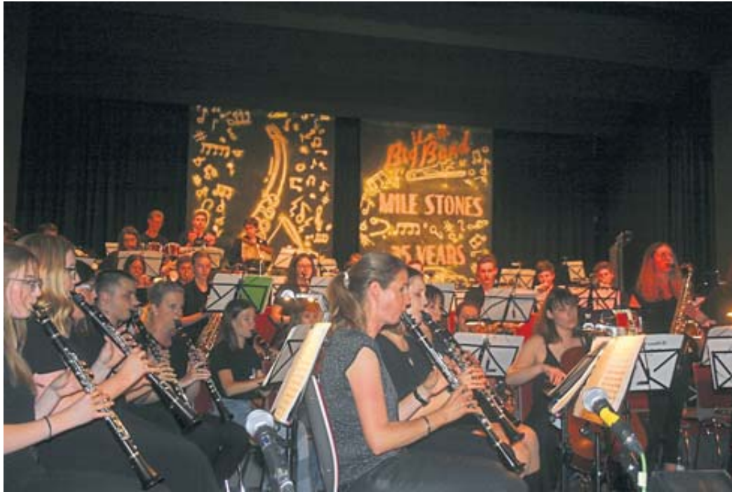
Magische Momente mit der Bigband des Ulrich-von-Hutten-Gymnasiums.