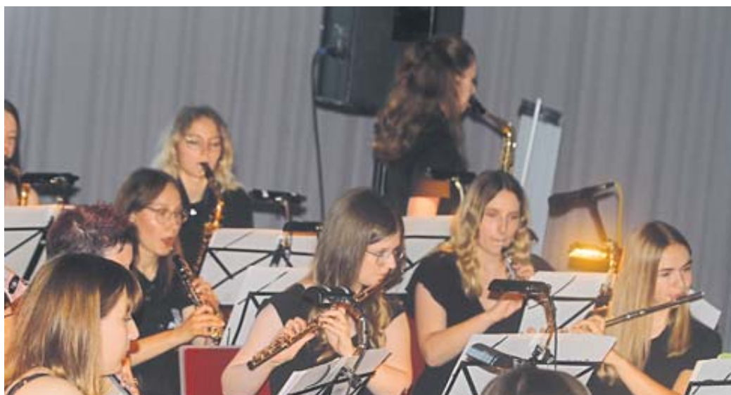
Die hoch konzentrierten Musikerinnen und Musiker überzeugten mit hervorragenden Leistungen.

SERVICE Der Bergwinkel www.Wochen-Bote.de