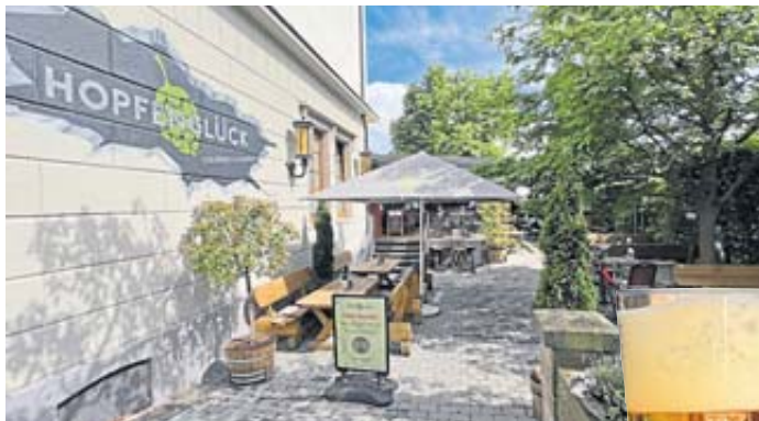
Natur-Feeling pur im „Hopfenglück“-Biergarten.

Sieben Monate Lockdown, so Bachmann, seien einfach eine zu lange Zeit gewesen, „das wirkt erst jetzt richtig nach“. Der Markt an verfügbarem Personal sei quasi leergefegt. Das wiederum eröffne Quereinsteigern Chancen, die in der Branche mittlerweile auf dem Niveau von Fachkräften bezahlt würden, erzählt Bachmann. „Doch man ist heute über jede Kraft froh, die man bekommen