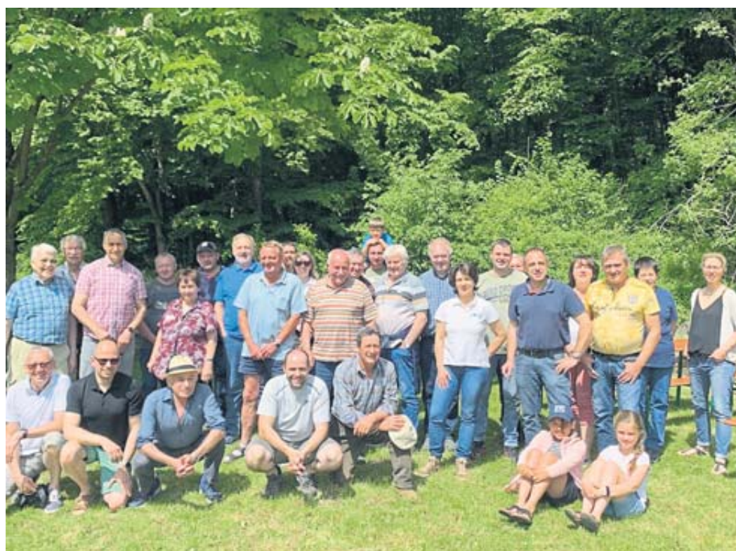
Viele freiwillige Helfer in einem aktiven Dorf

Würstchen, Steaks, Getränke und gemütliches Beisammensein: Der Wallrother Ortsbeirat und die Interessengemeinschaft IG Wallroth haben am Grillplatz das Helferfest für alle Unterstützer bei der Errichtung des Wabenhonighauses und bei der Sanierung des Mühlendorfer Backhauses veranstaltet. Insgesamt packten circa 80 Menschen bei beiden Projek-