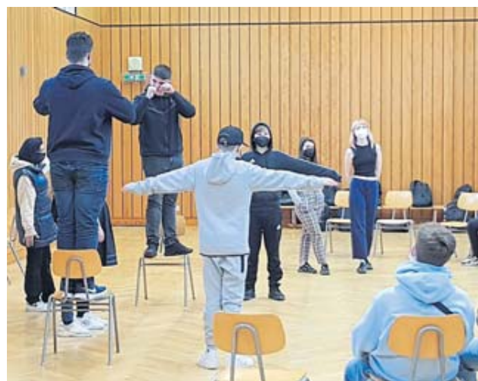
Die Schüler erfuhren anhand von Rollenspielen mit den in Konfliktsituationen entstehenden Ängsten und Aggressionen umzugehen.

SALMÜNSTER – Unter Leitung von vier Theaterpädagogen fand an der Henry-Harnischfeger-Schule in Salmünster ein Workshop zum Thema Gewalt statt. 21 Schüler und Schülerinnen einer 7. Klasse wurden in altersadäquater und spielerischer Form zum Thema Gewalt und ihre Erscheinungsformen sensibilisiert. Anhand von Partnerübungen und Improvisationstheater, welches sie selbst lenken konnten, lernten sie ihre Gefühle besser wahrzunehmen und auch durch Körperhaltung auszudrücken. Ferner erfuhren sie anhand von Rollenspielen mit den in Konfliktsituationen entstehenden Ängsten und Aggressionen umzugehen, ihre eigenen Grenzen und die der Anderen zu erkennen und zu respektieren. Die Schüler lernten Methoden zur Konfliktbewältigung