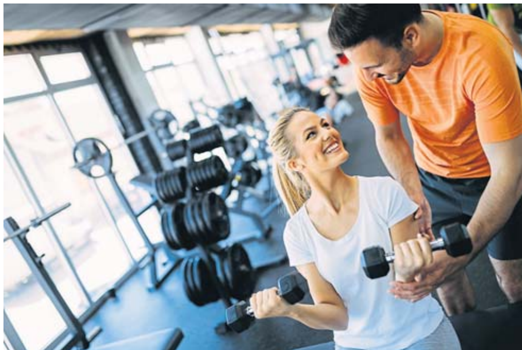
Die Fachleute von Fit&Fun helfen bei der Erstellung eines individuellen Trainingsplans und geben Tipps zum Abnehmen.