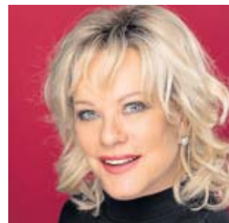
Lisa Fitz kommt am 26. Juni zu einem Auftritt nach Schlüchtern.

Weitere Infos und Tickets (Vorverkauf: 25 Euro, Abendkasse: 28 Euro) gibt es bei der Tourist Information, Telefon (06661) 85361. BWB