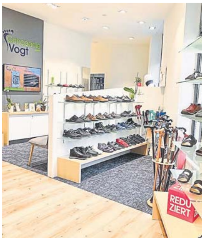
Auf 300 Quadratmetern kümmern sich zehn Mitarbeiter um das Fußwohl der Kunden. Foto: Orthopädie Vogt

Insgesamt zehn Mitarbeiter kümmern sich ums Fußwohl. In der eigenen Werk-