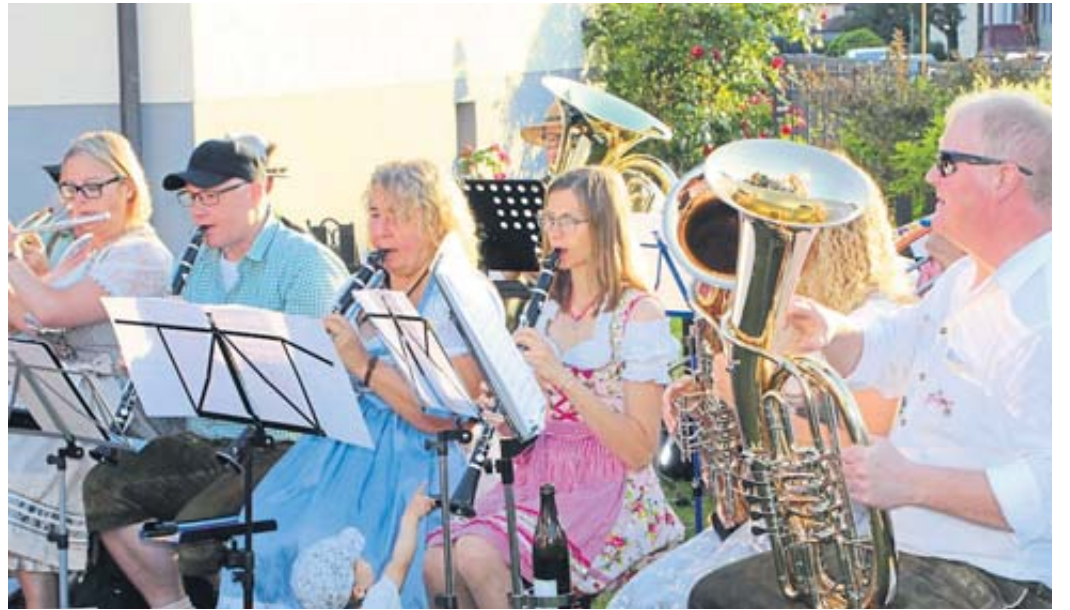
Für den musikalischen Auftakt sorgten die Elmbachtaler Musikanten.

unter anderem dem „Irischen Segenswunsch“.