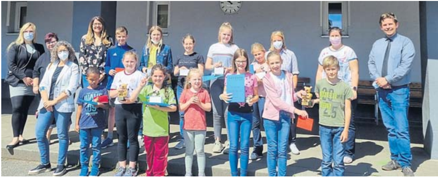
Vertreterinnen und Vertreter des Fördervereins und der Schulleitung der Henry-Harnischfeger-Schule mit den Preisträgerinnen und Preisträgern von Klasse 1 bis 10...