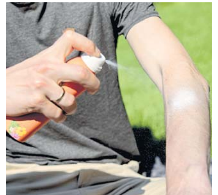
Damit die Sonnenmilch auch zuverlässig vor der UV-Strahlung schützt, sollte sie nicht zu alt sein.

Eine Studie französischer und amerikanischer Wissenschaftler, die im März 2021 veröffentlicht wurde, hat neue Belege für die These geliefert: Demnach haben sich bei Cremes mit dem UV-Schutzfilter Octocrylen im Laufe der Zeit Benzophenone gebildet, die als möglicherweise krebserregend gelten.