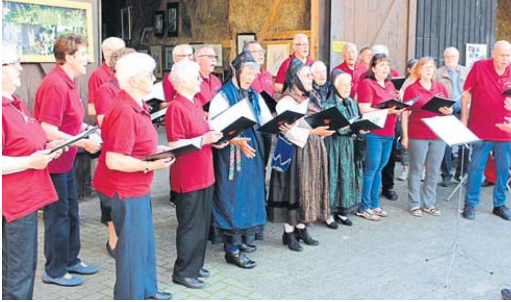
Die Elmer Chorgemeinschaft begleitete die Vernissage mit ihrem Gesang.