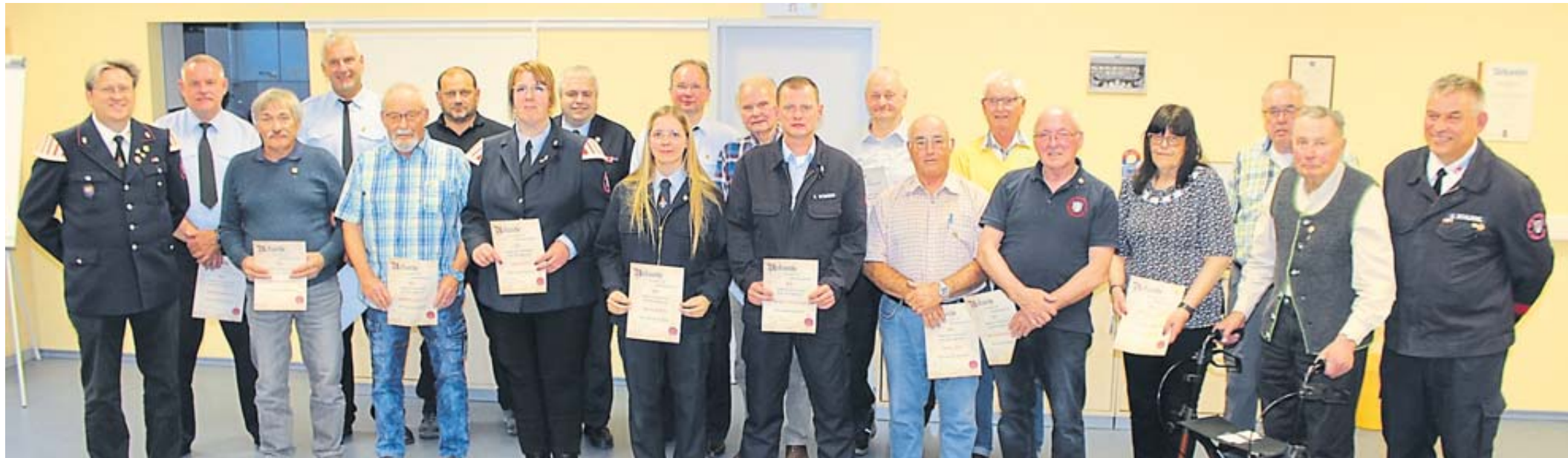
Eine Vielzahl von Mitgliedern wurde in der Jahreshauptversammlung der Freiwilligen Feuerwehr Steinau geehrt.