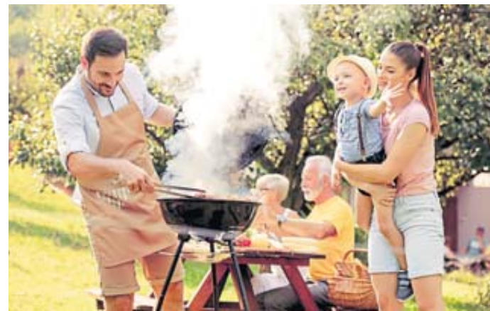
Kinder sollten beim Grillen durchgängig von Erwachsenen beaufsichtigt werden.

Rügamer empfiehlt daher den Einsatz von festen Grillanzündern.