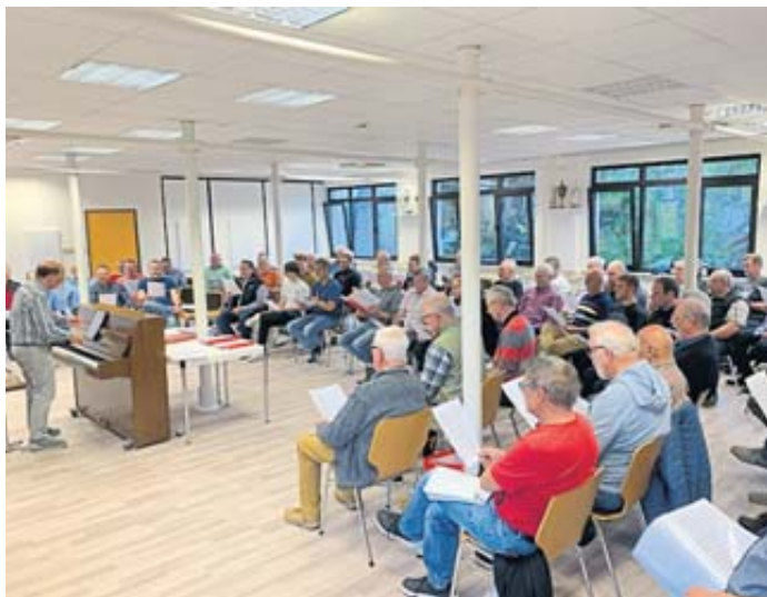
Die Sänger des Männerchores Frohsinn Bad Soden proben in ihrer neuen Heimstätte „1866“.

Falls Sie diese Zeitung nicht mehr erhalten möchten, bitten wir Sie eine E-Mail an vertrieb@wochen-bote.de zu senden und einen Aufkleber mit dem Hinweis „Bitte keine kostenlosen Zeitungen“ an Ihrem Briefkasten oder Zeitungsrohr anzubringen.