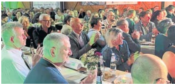
Super Stimmung herrschte auf der Party des Kreisbauernverbandes Fulda-Hünfeld im Hofbieberer Ortsteil Wiesen.