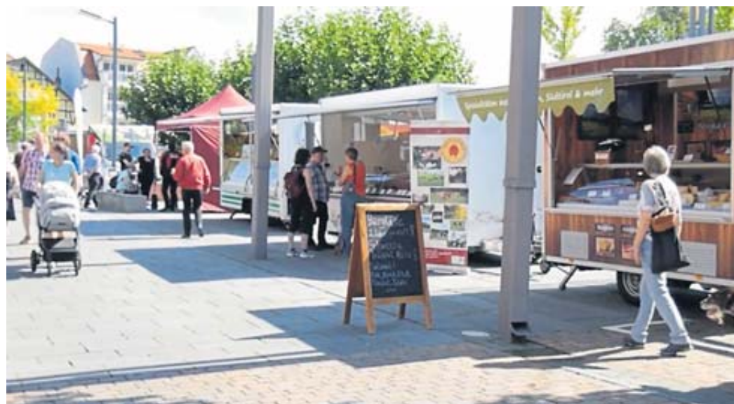
In der Regel findet der Markt an jedem ersten Sonntag im Monat zwischen März und November von 11 bis 17 Uhr statt.

Neben den permanenten Ausstellern gibt es zusätzlich wechselnde Beschicker mit besonderen Angeboten, wodurch es immer zwischen 15 und 18 Stände gibt. In der Regel findet der Markt an jedem ersten Sonntag im Monat zwischen März und November