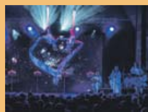
SPIRIT DREAMS SOMMERVARIETE 11.08.2022