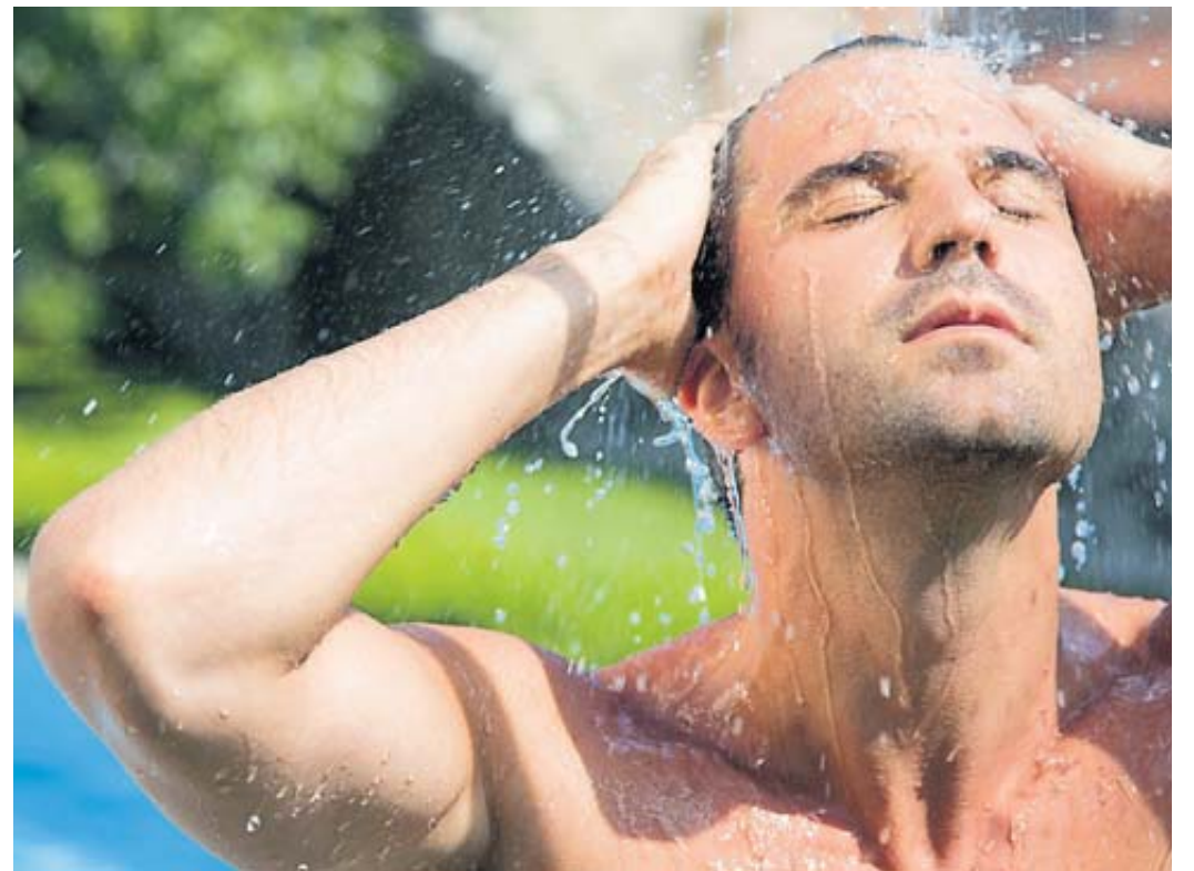
Es hilft der Haut, wenn man sich nach dem Schwimmen duscht.

Besondere Pflege empfehlen die Experten auch für die Haut vor und nach dem Schwimmen: Man sollte sich nach jeder Einheit im Becken abduschen. Denn