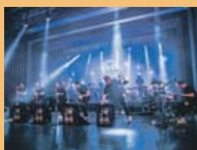
JAZZRAUSCH BIGBAND 14.08.2022