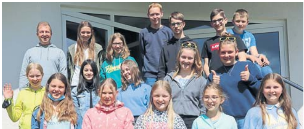
Seit Anfang des Jahres probt der Kinder- und Jugendchor „Kirchturmspatzen“ für die beiden Aufführungen des Musicals „Martin Luther King“.