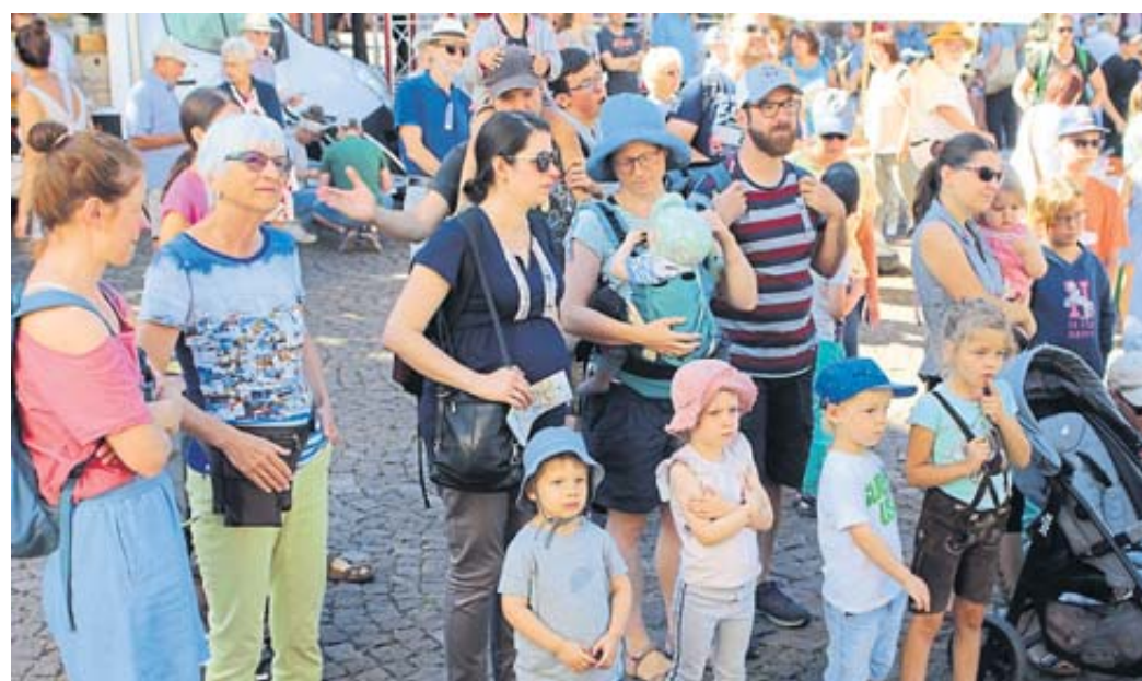
Große und kleine Besucher lauschten am Kumpen der offiziellen Eröffnung.

SERVICE Der Bergwinkel www.Wochen-Bote.de