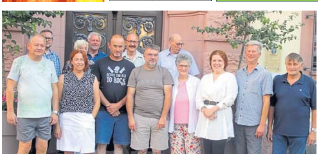
In alter Tradition werden Kleintierzüchter, Kleingärtner und Landwirte zum Weitzelfest in Schlüchtern ausgezeichnet.