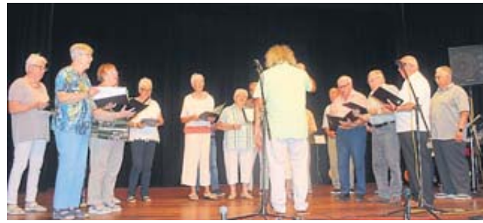
Der Gesangverein Eintracht bereicherte den Seniorennachmittag mit seinem Gesang.