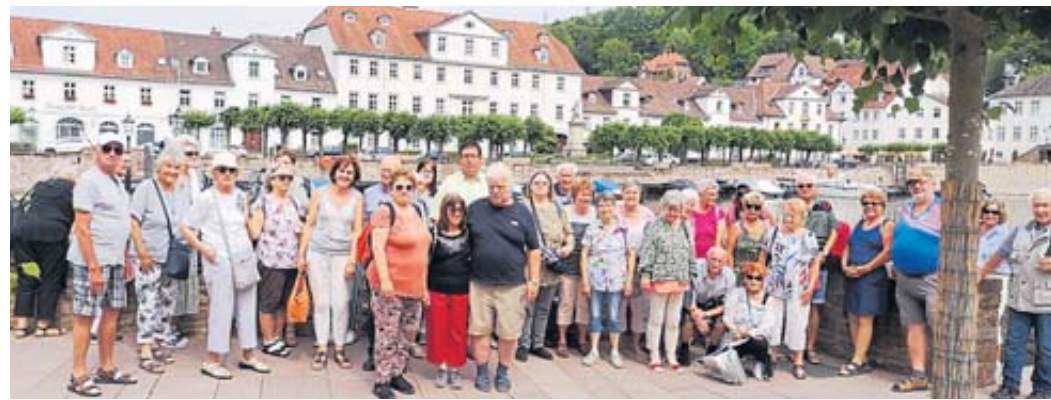
Einen schönen Tag verbrachten die Mitglieder des Wanderverein Bellings in Höxter und Bad Karlshafen.