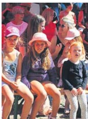
Ein besonderes Erlebnis war für die Kinder ein Open-Air-Theater im Amtshof.

STEINAU – Die Steinauer Altstadt war am vergangenen Sonntag eine Märchenstadt. Nach zweijähriger Pandemie bedingter Unterbrechung fand jetzt wieder ein Märchensonntag statt – und er war ein großer Erfolg. Kernthema waren diesmal „Die Bremer Stadtmusikanten“.