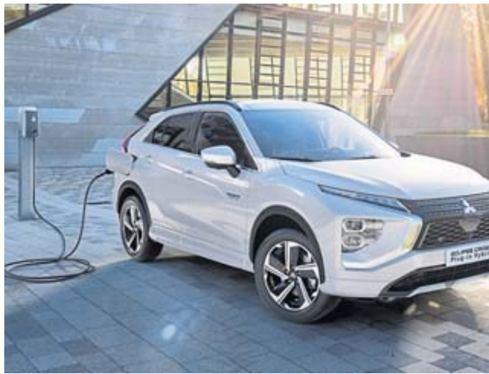
Das flexible Laden des Eclipse Cross Plug-in Hybrid begeistert – mit und ohne Stecker.

rienmäßig mit 18-Zoll-Leichtmetallfelgen, Privacy Verglasung (ab der B-Säule), Sitzheizung vorn, einem Smart-Key-System, einer Zwei-Zonen-Klimaanlage und einem Multifunktionslenkrad in Leder ausgestattet. Ebenfalls immer dabei sind ein modernes Infotainment-System sowie neben Notbrems-, Spurhalte- und Fernlichtassistent,