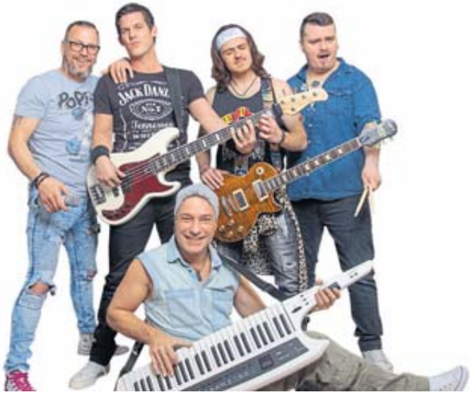
Mit einem breiten musikalischen Repertoire tritt die Partyband „Bayernmän“ auf dem Kurparkfest auf. ...