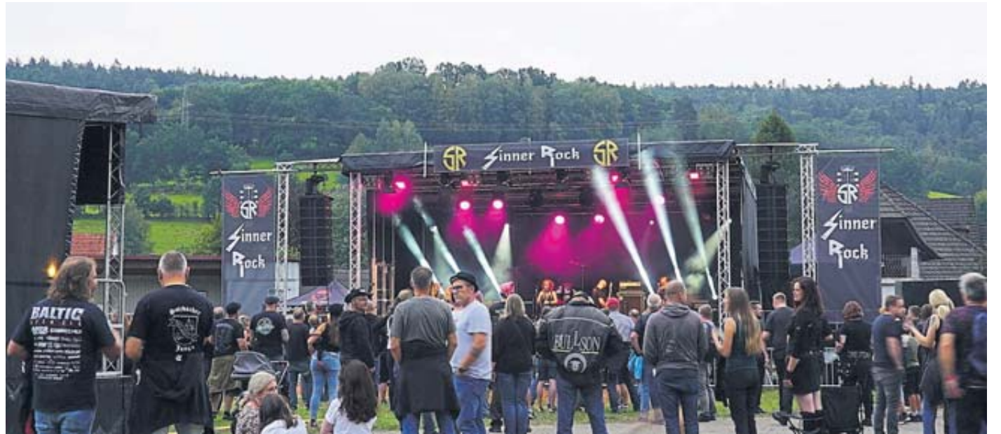
Der Kartenvorverkauf für das Sinner-Rock-Festival ist gut angelaufen, wer dabei sein will, sollte sich beeilen.