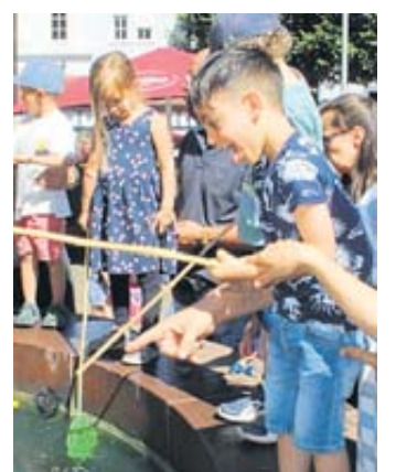
Viel Betrieb herrschte am Märchenbrunnen.