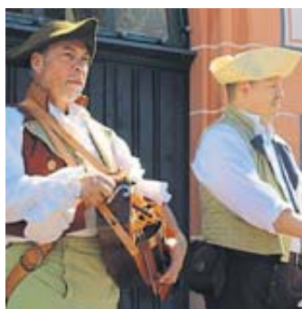
Allerorten erklang in der Steinauer Altstadt Musik.