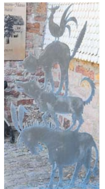
Die Bremer Stadtmusikanten sind am Brüder-Grimm-Haus dargestellt.

2023 lädt die Stadt Steinau kleine und große Märchenfreunde ein, zu Gast zu sein, wenn das Motto heißt: „Die zertanzten Schuhe“. FGW