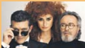
Sommerkino: DER BESTE FILM ALLER ZEITEN 18.08.2022