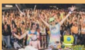
ALLES 90ER UND 2000ER PARTY MIT BUFFALO & WALLACE 03.09.2022

INFOS & TICKETS UNTER KULTURFINDETSTADT-FULDA.DE