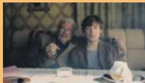
Sommerkino: STASIKOMÖDIE 20.08.2022