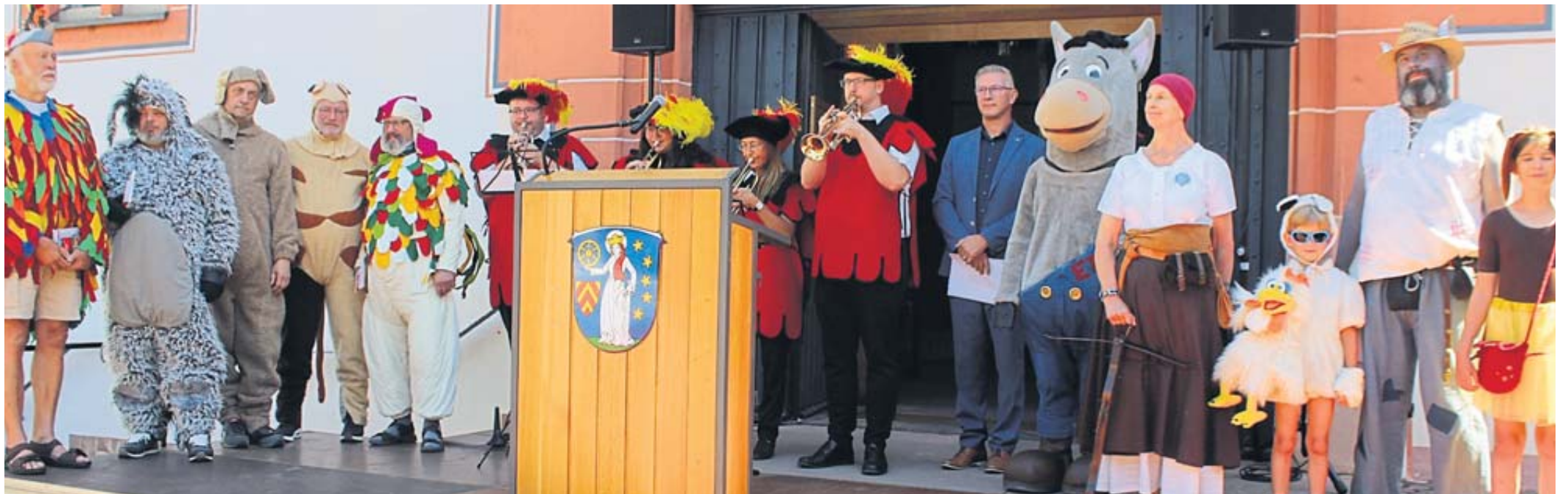
Bereits die Eröffnungszereemonie zum Steinauer Märchensonntag vor dem Rathaus gestaltete sich musikalisch und fröhlich-bunt.