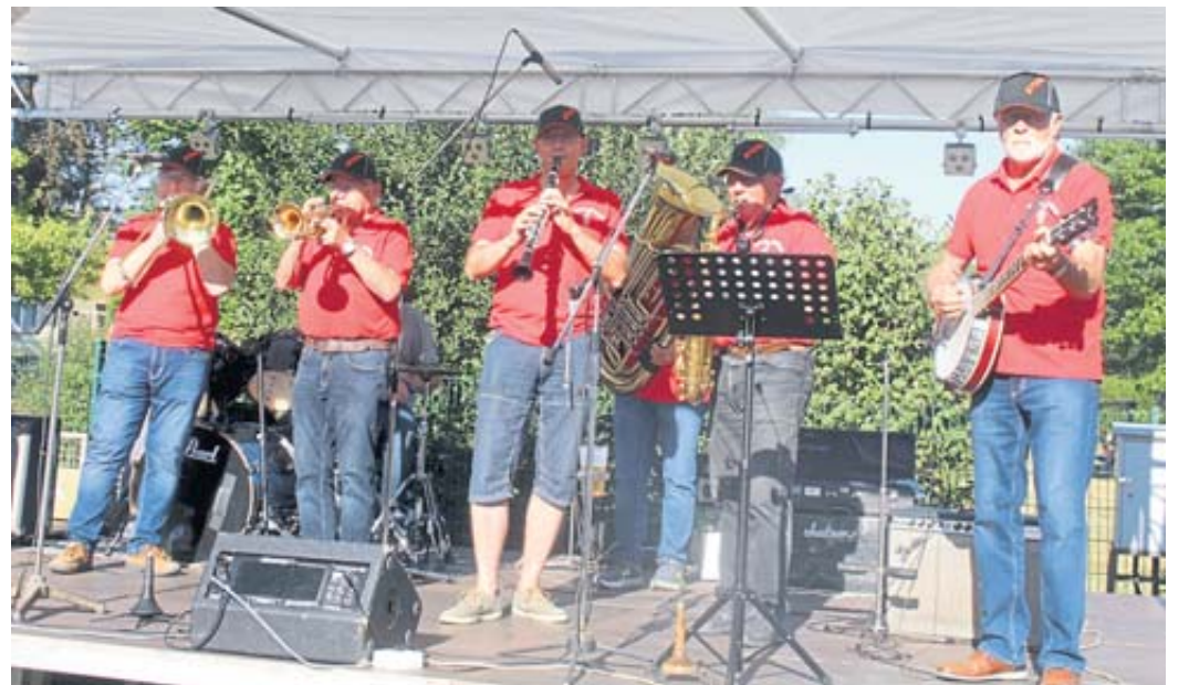
Die Dixie Oldies begeisterten mit ihrem New Orleans Jazz.

Glücklicherweise war das Fasschen Bier rechtzeitig eingetroffen, so dass der noch amtierende Kalte-Markt-Prä-