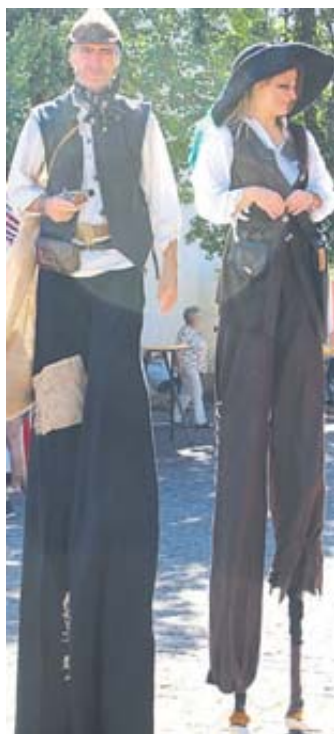
Auch Räuber auf Stelzen waren unterwegs.

„Die Bremer Stadtmusikanten“ am Märchensonntag