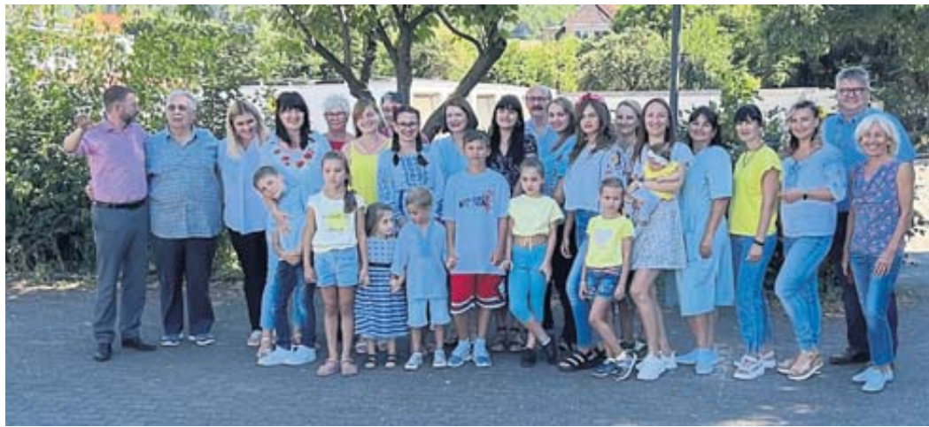
Ukrainische Flüchtlingsfrauen unterstützten den Seniorennachmittag.