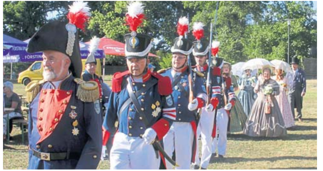
Bürgergarde und Biedermeiergruppe bilden einen festlichen Rahmen für das kleine, aber feine Weitzelfest.