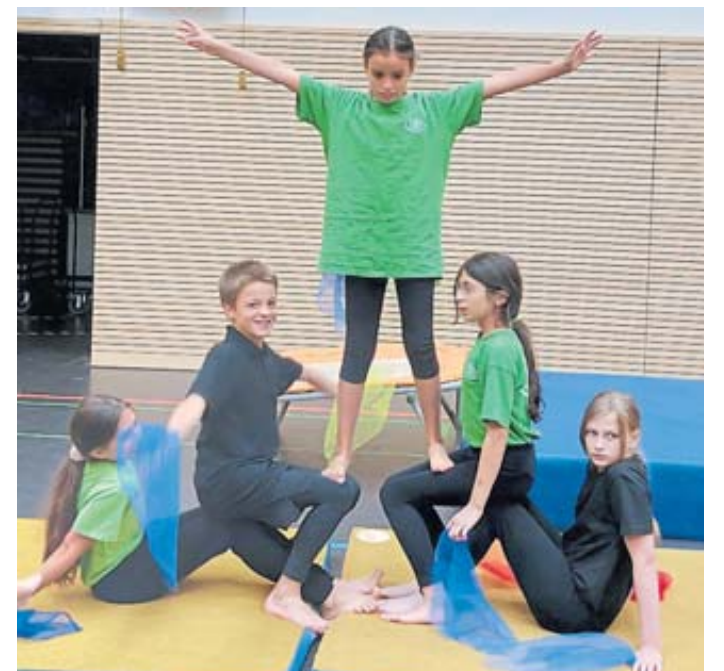
Akrobatischer Abschluss der Geräteturnkinder.