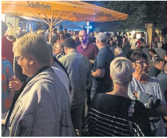
Die Menschen haben Lust zu feiern: Am Altstadtfest ist die Hölle los.