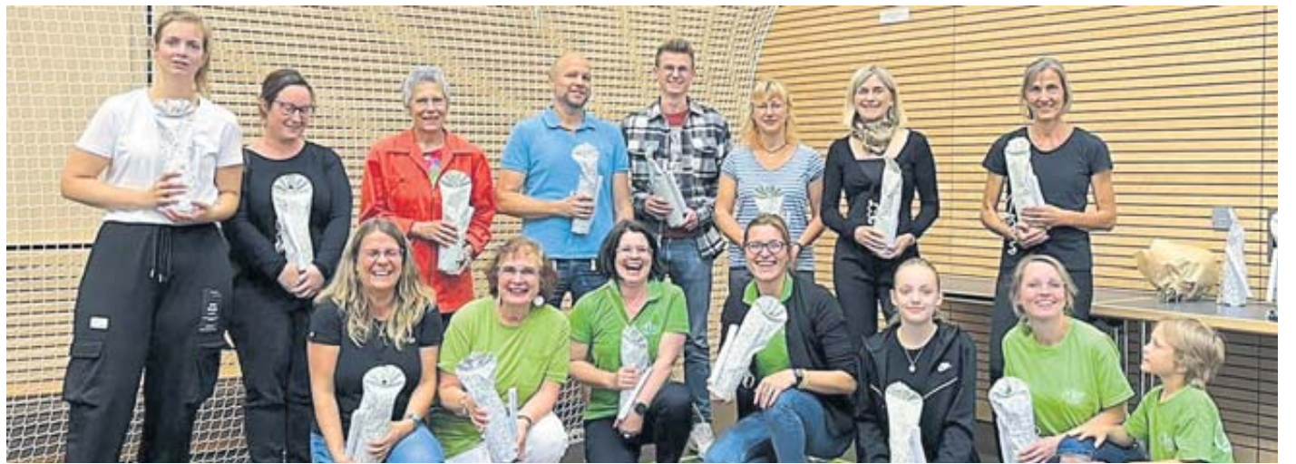
Viel Anerkennung erhielten die Übungsleiterinnen und -leiter für ihr beständiges Engagement.