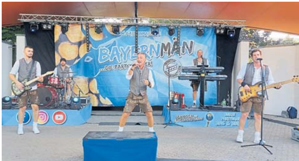
Die Band „Bayernmän“ rockte den Kurpark.