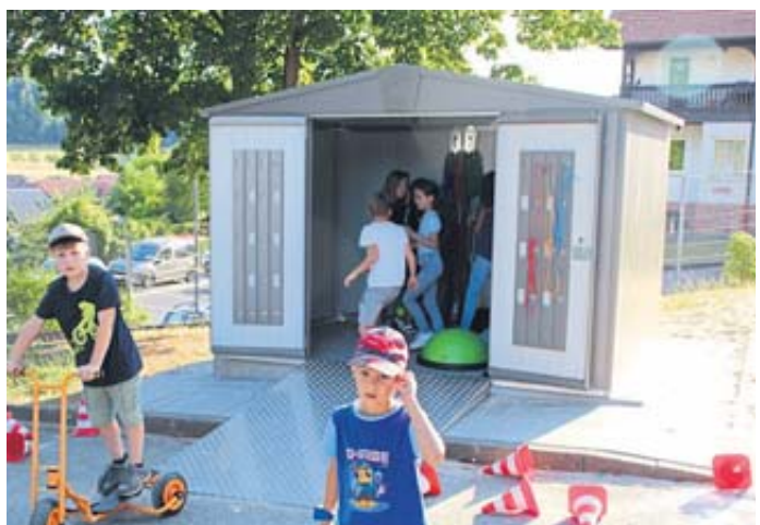
Die Kinder haben das neue Spielgerätehaus mit Begeisterung eingeräumt und die neu gemalten Spielfelder freudig ausprobiert.