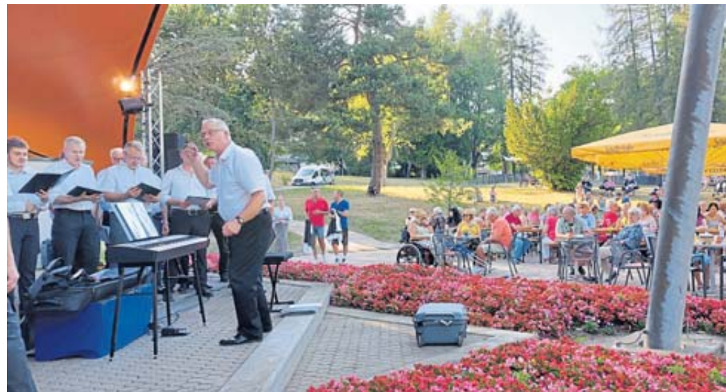
Der Männerchor Frohsinn eröffnete vor zahlreichen Gästen das Fest musikalisch.