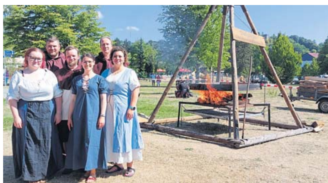
Die Salziedergruppe des Schützenvereins Stolzenberg demonstrierte die Kunst des Salzsiedens.

Als „Party-Kracher“ war die Band „Bayernmän“ angesagt, und tatsächlich ließen es die Musiker aus Nordbayern ordentlich krachen. Mit Party-Hits, Musik der Neuen Deutschen Welle, Hits aus den „80ern“ bis zu den aktuellen Toptiteln hatten die „Bayernmän“ alles zu bieten. Sie ließen Nenas „99 Luftballons“ steigen, wollten „Zurück nach Westerland“ und versicherten ihrem Publikum „You're simply the best“. Bis Mitternacht rockten die Musiker durch ihr vielseitiges Repertoire, und die Zuhörer sangen und tanzten begeistert mit.