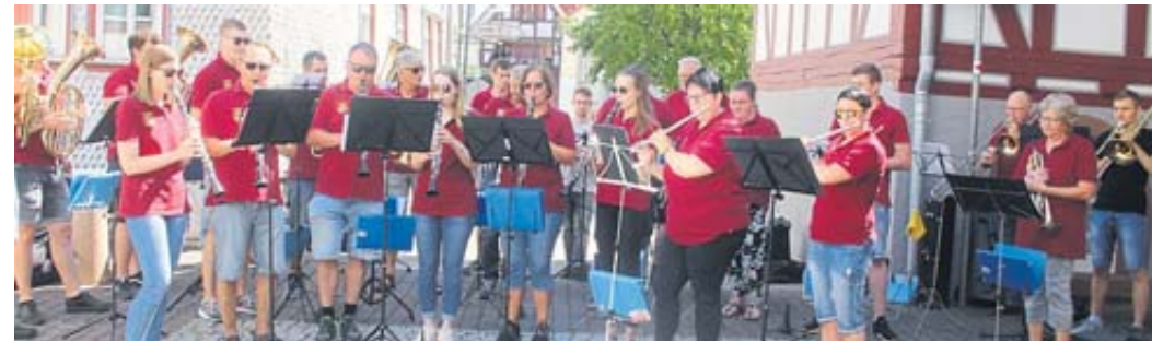
Der Musikverein Salmünster spielte bei der Eröffnung.