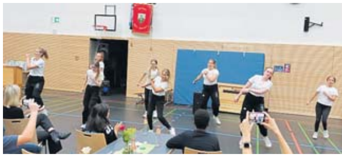
Die TV-Tanzformation „Wild fires“ begeisterte mit ihrem Auftritt beim Festnachmittag zum 125-jährigen Bestehen des TV Soden-Stolzenberg.