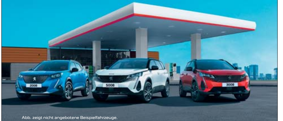
Abb. zeigt nicht angebotene Beispielfahrzeuge.