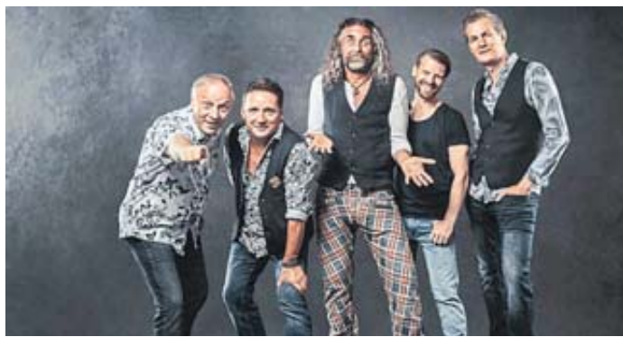
„The Jets“ haben zur Kirmes ihren Auftritt.