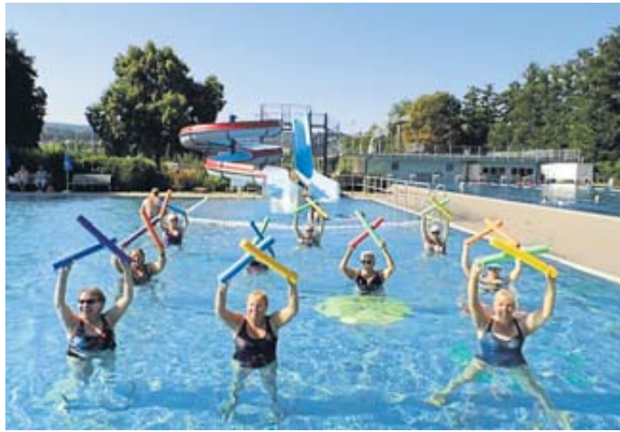
Einem strahlend blauen Himmel und Gymnastik im Wasser – das bietet das Sommerprogramm des TV Steinau.