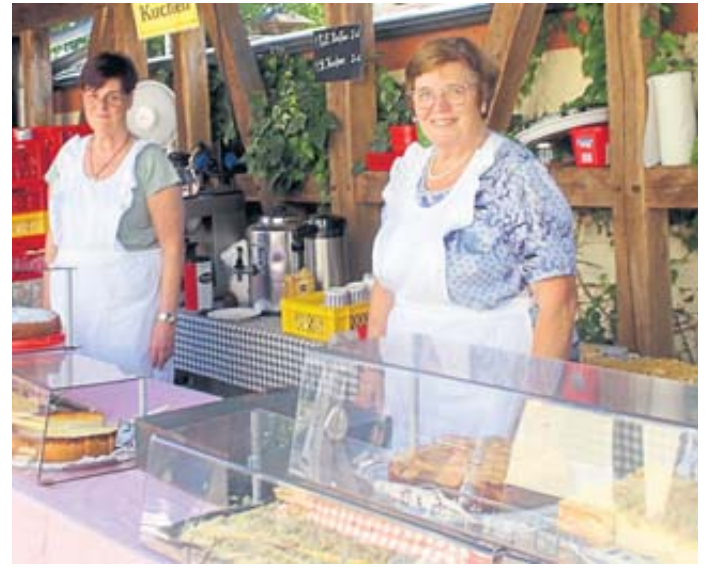
Duftenden Kaffee und leckeren Kuchen gab es im Heimatmuseum.