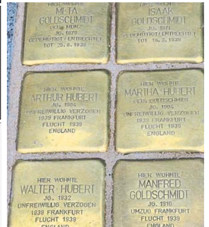
Schlüchtern erinnert mit Stolpersteinen an die Schicksale ehemaliger Bewohner.