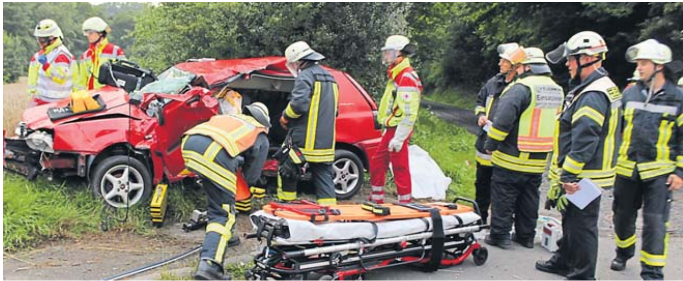
Das Besondere an der Feuerwehr Schlüchtern Innenstadt ist, dass sie als Stützpunktwehr die meist geforderte Feuerwehr der Region ist. .