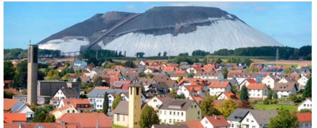
Bei den Workshops in den Ortschaften haben sich insgesamt über 350 Bürger beteiligt.

Nachdem Dr. Winfried Kösters, ehemaliger Berater der Bundesregierung und langjähriger Experte bei Fragen zum demografischen Wandel, im September 2021 seine Strategie für die Erstellung eines Leitbildes in der Gemeindevertreterversammlung vorstellte, wurde schnell ei-