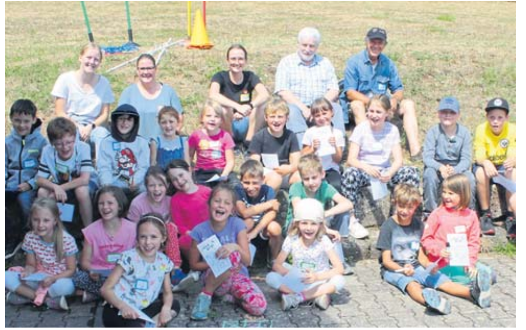
Der Sterbfritzer Dorfverein veranstaltete für die Ferienspiele-Kinder eine Spiel- und Spaßolympiade.

Ihren Abschluss fanden die zwei Ferienspiele-Wochen bei der Feuerwehr Sterbfritz. An mehreren Stationen auf dem Gelände des Feuerwehrhauses gab es für die Kinder Action und wissenswerte Informationen. Christ