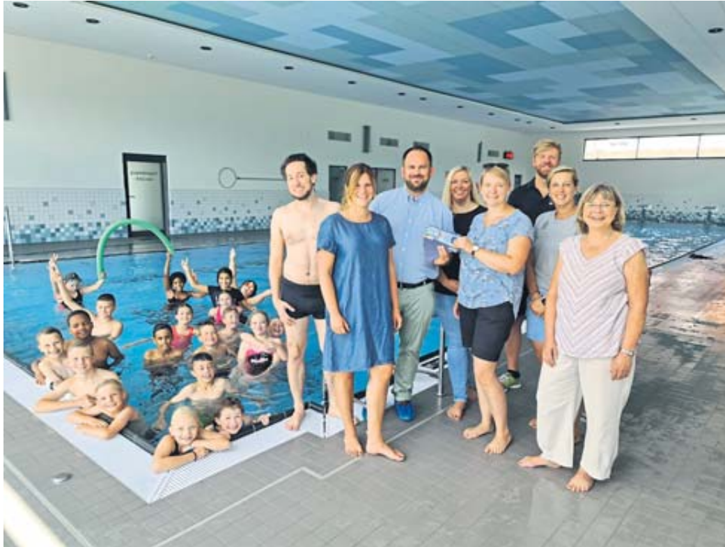
In Kooperation mit der Spessart Therme ermöglichte die Grundschule an der Salz, den ukrainischen Flüchtlingskindern einen Schwimmkurs.

SCHLÜCHTERN – Die Erlöse des Schulfestes der Grundschule im Juni sollten ursprünglich für die Anschaffung einiger Spielsachen gespendet werden. Doch die Eltern und Gäste waren so spendabel, dass den ukrainischen Familien, die in Bad Soden-Salmünster eine neue Heimat gefunden haben, sogar eine sinnvolle Feriengestaltung bieten konnte. In Kooperation mit der Spessart Therme ermöglichte die Grundschule an der Salz, den ukrainischen Flüchtlingskindern einen Schwimmkurs mit dem Ziel das Seepferdchen zu erlangen. Kurdirektor Stefan Ziegler zeigt sich begeistert von der Idee, die in Kooperation zwischen der Schulleitung Birthe Schäfer, des Elternbeirates in Person von Anja Noll und Melanie Salomon sowie Sandy Jaschik vom Förderverein der Grundschule, umgesetzt wurde. Mit seinen Mitarbeitern Yvonne Habig, Schwimmlehrer und Meister Malte Habig sowie den Auszubildenden zum/zur Fachangestellten für Bäderbetriebe wurden die Dienstpläne erweitert um den Schwimmkurs schnellstmöglich in den Sommerferien stattfinden zu lassen. So haben die Kinder an zehn Terminen zügig die Möglichkeit Schwimmen zu lernen. Der Kurs wird mit Unterstützung einer Lehrkraft und einer Übersetzerin von Malte Habig und einer Auszubildenden im 25 Meter-Schwimmbecken der Spessart Therme durchgeführt.