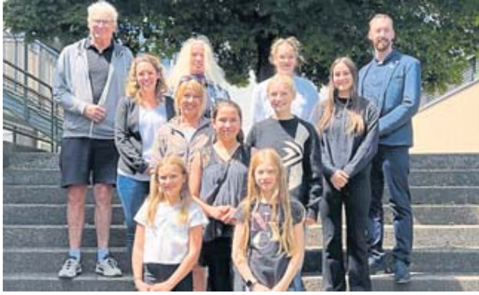
Glückliche Gesichter nach der Preisverleihung.