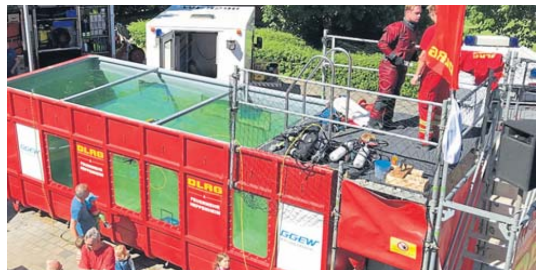
Dieses Archivbild zeigt den Tauchcontainer des DLRG_Heppenheim.

Für die Kleinsten gibt es Spiel und Spaß mit einer Feuerwehr-Hüpfburg und einem Spritzspiel der Jugendfeuerwehr. Am besten Sie planen gleich einen Besuch bei der Feuerwehr am Sonntag ein, denn wie gewohnt, ist selbstverständlich auch für das leibliche Wohl mit Fire-Fighter-Burger, Steaks, Würstchen, Pommes bestens gesorgt und nachmittags gibt es zudem Kaffee und Kuchen.