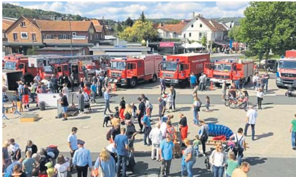
Vor dem Feuerwehr Stützpunkt präsentieren sich etliche Hilfsorganisationen.

Um Retter auf vier Pfoten geht es dann um 13:30 Uhr, wenn die Rettungshundestaf-