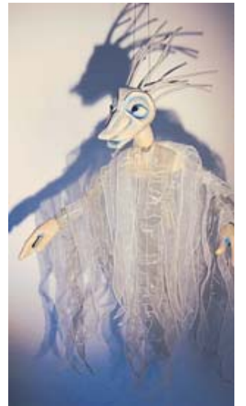
„Der Sturm oder Die Insel der zauberhaften Wesen“, frei nach „The Tempest“ von William Shakespeare.

Während der 28. Steinauer Puppenspieltage gibt es Puppen jeglicher Couleur zu sehen: Tisch-, Klappmaulfiguren und Handpuppen, große und kleine Puppen, Schattenfiguren und bespielte Objekte. Es gibt offenes Spiel und