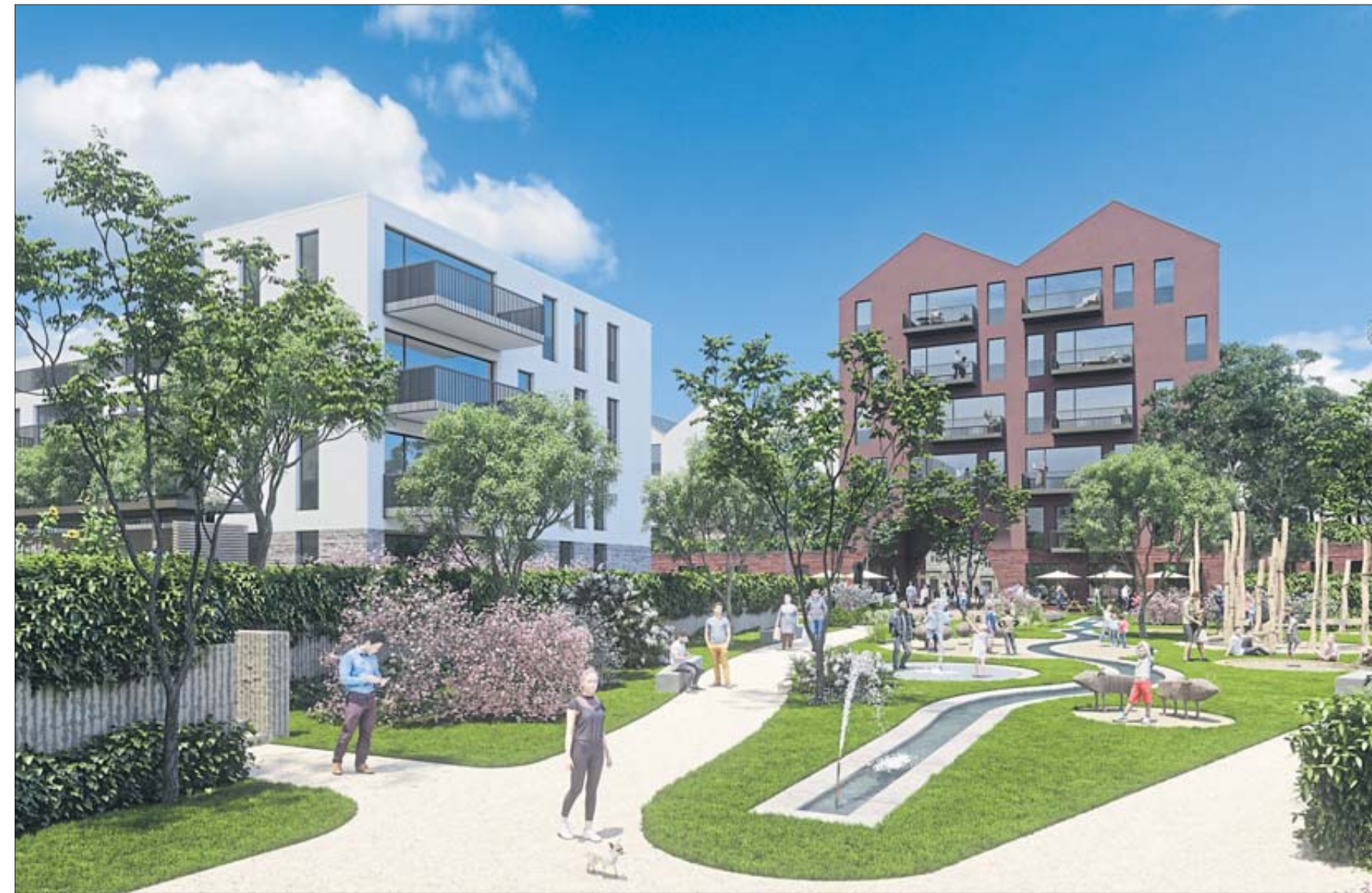
Geplant ist ein Park mit Spielplatz und Teich.