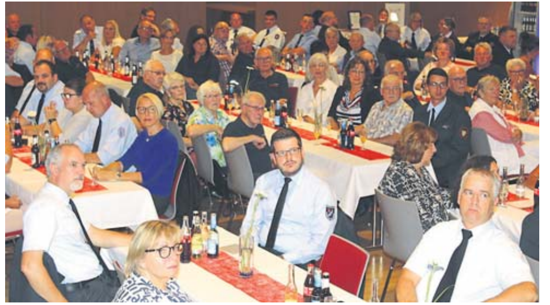
Die Schlüchterner Stadthalle war beim Festkommers voll besetzt.