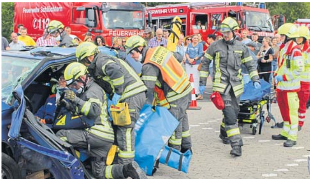
Die Einsatzkräfte demonstrierten die Rettung eines eingeklemmten Unfallopfers.

Bei der beeindruckenden Demonstration des Brand-