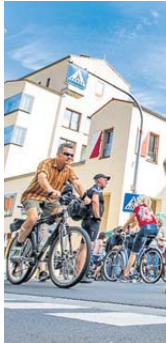
Nach zwei Jahren Pause freuen sich nicht nur die Radler auf Kinzigtal total.

Am 11. September kann man sich nicht nur sportlich betätigen: Entlang der Strecke bieten zahlreiche Vereine und Initiativen ein buntes Programm mit musikalischer Unterhaltung und Mitmach-Aktionen. Für die Verpflegung ist natürlich auch mit vielfältigen Angeboten gesorgt. Da an diesem Tag gleichzeitig der Tag des offenen Denkmals stattfindet, haben kulturell Interessierte die Möglichkeit, auf ihrer