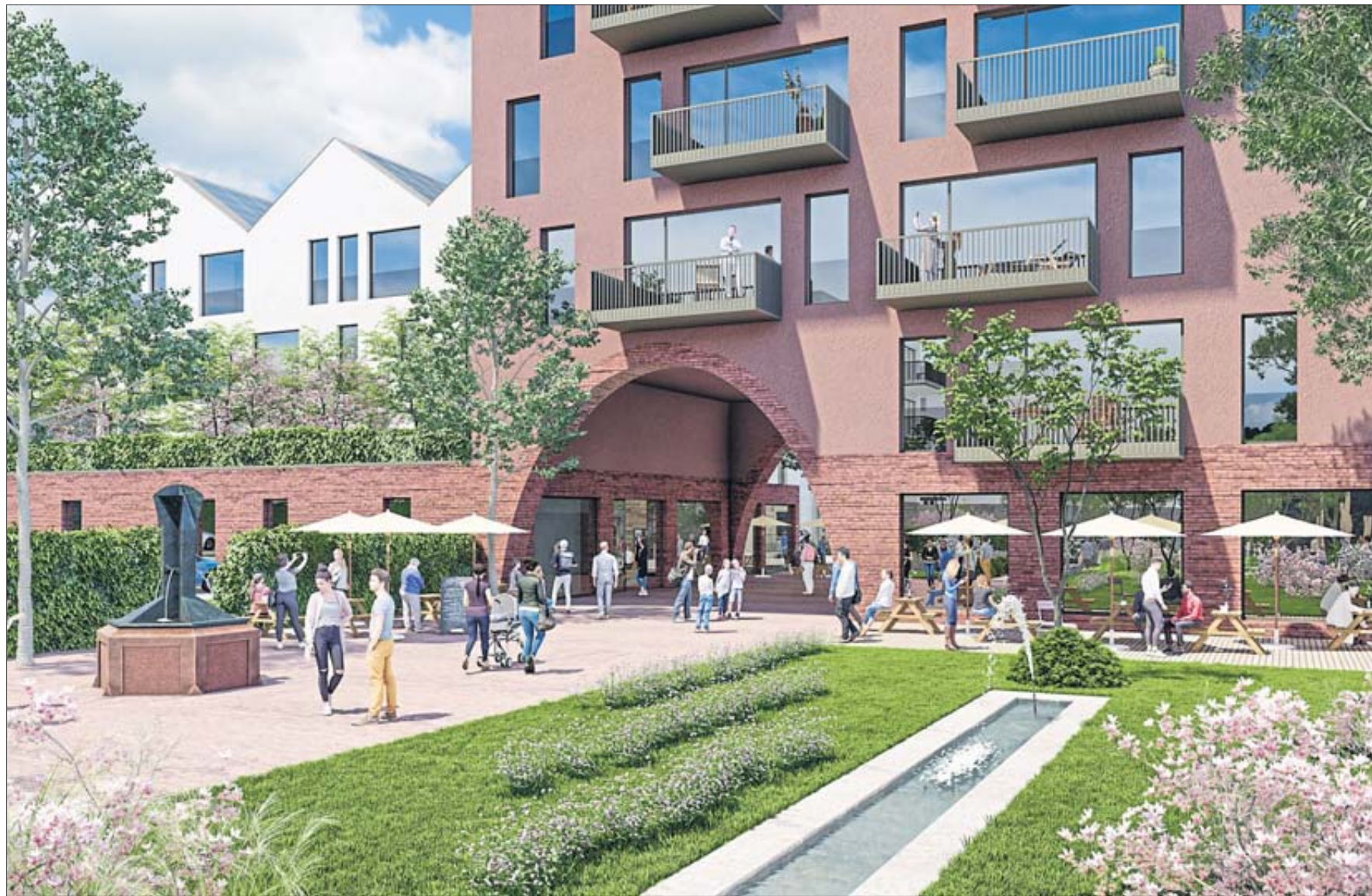
Der Torbogen ist eine sichtbare Erinnerung an das frühere Obertor.