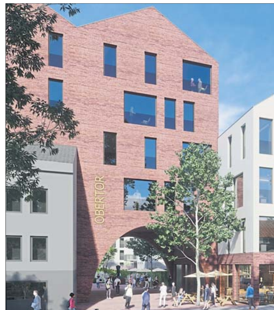
Blick auf die neue Ladenzeile im Bereich des ehemaligen Kaufhauses Langer.

keit, sich bei den Verantwortlichen umfassend über Bauprojekte der Stadt zu informieren. Von 13.30 Uhr bis 15 Uhr werden Stadtrundgänge mit den Stationen Schloßchengarten, Stadtplatz, Synagoge, Obertorcenter, Langer Areal sowie Kultur- und Begegnungszentrum für die Bürgerinnen und Bürger angeboten. Für Essen und Getränke sorgt das Gastronomie-Team von „Jedermanns“.