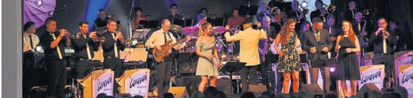
Tritt die Caravan Big Band auf, dann ist auf der Bühne mächtig was los.

Tickets im Vorverkauf Touristinformation Bad Orb Kurparkstraße 2 Kinzigtal Nachrichten, Oberdorferstraße 16, Schlüchtern Verkehrsbüro Steinau, Brüder-Grimm-Straße 70 Tourist Information, Frowin-von-Hutten-Straße 5, Bad Soden caravanbigband.de