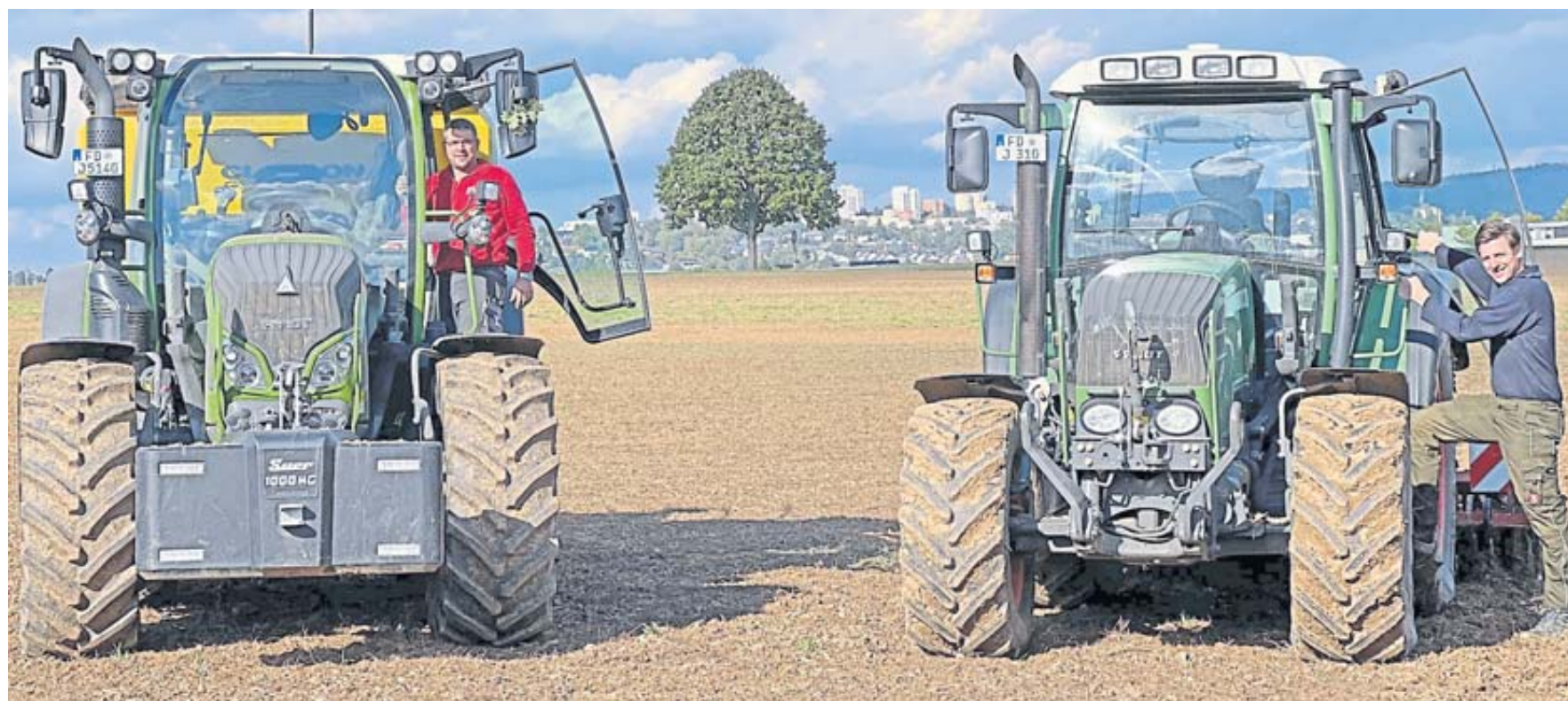
Startschuss für das „Abenteuer Landesgartenschau“ auf dem „FuldaAcker“, der so groß wie zwölf Fußballfelder ist und Landwirtschaft in Echtzeit zeigen soll.