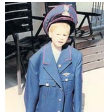
Feuerwehrmann von Kindesbeinen an.