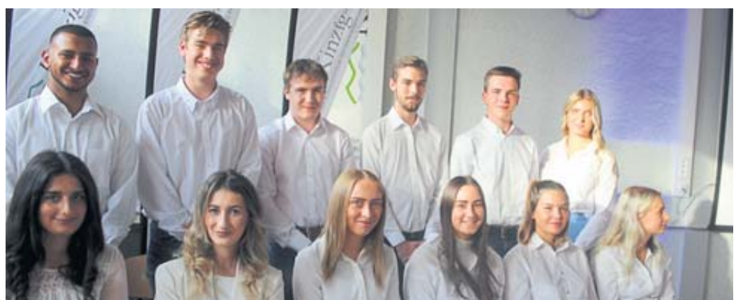
Diese Kinzigsschüler haben ein Marketingkonzept erarbeitet.