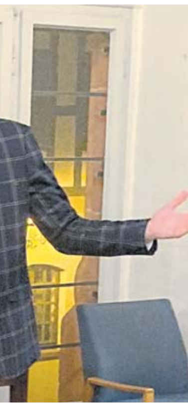
Antrittsrede humorvoll und pointiert in all den Jahren seiner Katharinenmarktmeisterei.