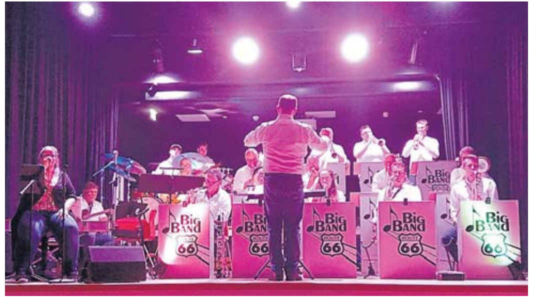
Zum Konzert der Big Band Route 66 präsentierte sich die Bühne in der Aula der Stadtschule komplett in Blautöne getaucht.