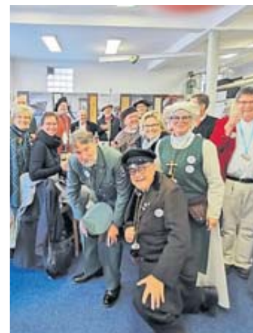
Ein fröhlicher Schnappschuss: Ein Teil der Katharinenmarktmeisterinnen und -meister in 2021.

Los geht es am Freitag, 14. Oktober, mit dem Lampionumzug, in dessen Reihen schon viele Generationen von Kindern mit bun-