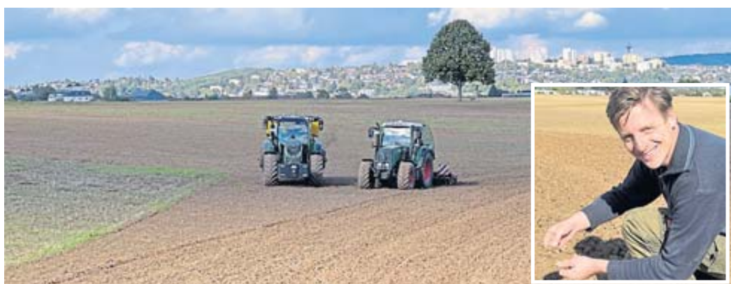
Imposante Größenverhältnisse: Traktoren-Duo auf dem „FuldaAcker“, im Hintergrund die Skyline der dynamischen ostthessischen Wirtschaftsmetropole. Rechts unten: Sebastian Schramm nimmt eine Bodenprobe.