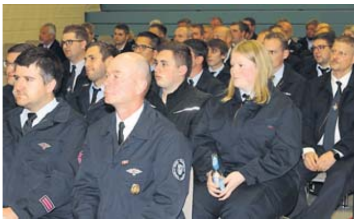
Die gemeinsame Versammlung in der Halle am Steines war gut besucht.