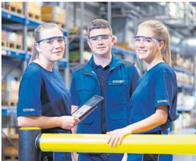
Eckart Hydraulik veranstaltet am 12. November wieder seinen Ausbildungstag.