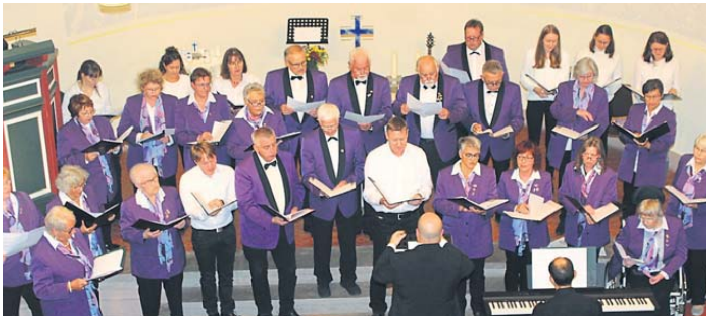
Der Stammchor des Lamm'schen Chores Niederzell beim Jubiläumskonzert in der örtlichen Kirche.