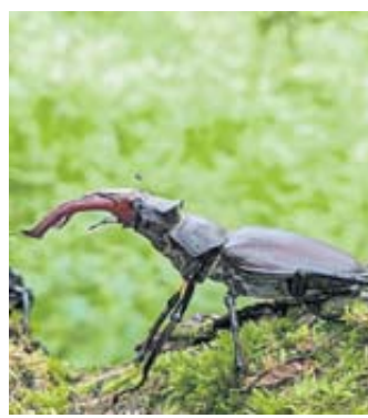
Hirschkäfer im natürlichen Habitat.

Schlüchtern: Sonntag, 10 Uhr: Videokonferenz: Übertragung eines besonderen Programms aus dem Zweigbüro in Selters. Zum Programm gehört auch ein Kurzvortrag mit dem Thema „Baut einander auf“. – Mittwoch, 19 Uhr: Dreiteiliges Programm „Unser Leben und Dienst als Christ“. Zugangsdaten für die Videoübertragung unter (01577) 3434237. Gottesdienste in Präsenz im Königreichssaal, Schlierbacher Straße 41, in Wächtersbach.