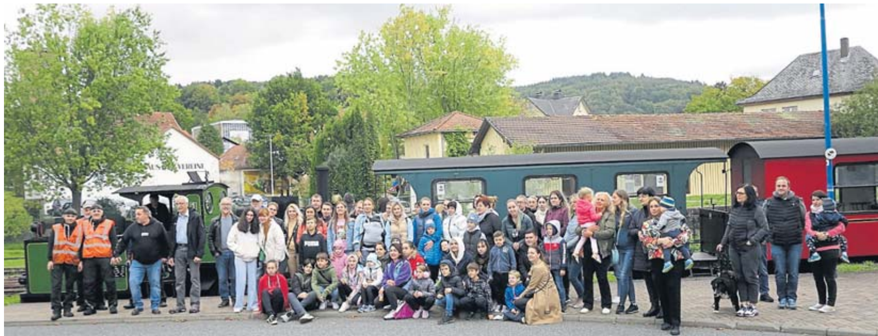
Die Schlüchterner Oldtimer-Fahrzeug-Freunde organisierten mit der Emma-Lokomotive eine Fahrt für ukrainische Flüchtlinge.