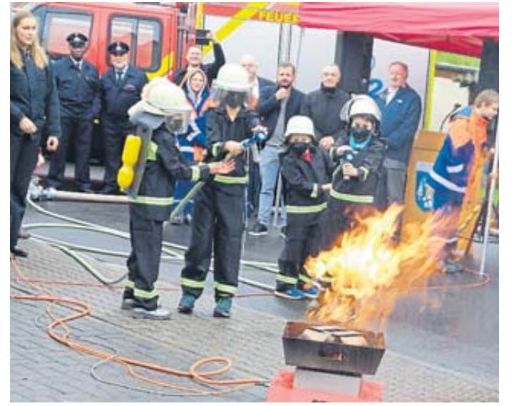
Die Kinderfeuerwehr Kerbersdorf bekämpfte erfolgreich den spontan aufgetretenen „Brand“.