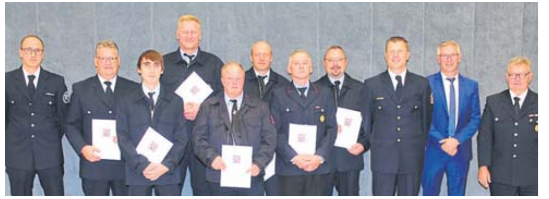
Auszeichnungen mit Brandschutzehrenzeichen des Landes Hessen in der gemeinsamen Jahreshauptversammlung aller Feuerwehren der Stadt Steinau.

Dass der Main-Kinzig-Kreis den Ausbildungsbetrieb im Feuerwehrewesen während der Pandemie so gut wie möglich aufrechterhalten hat, hob der stellvertretende Kreisbrandinspektor Christian Hinrichs hervor. Auch das Feuerwehrhaus in Steinau sei