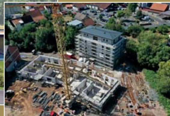
Bautenstand Sommer 2022

In zentrumsnaher Bestlage im Luftkurort Schlüchtern entsteht ELMLAND1 – ein einzigartiges Wohn- und Lebenskonzept mitten im grünen Herzen der Stadt.