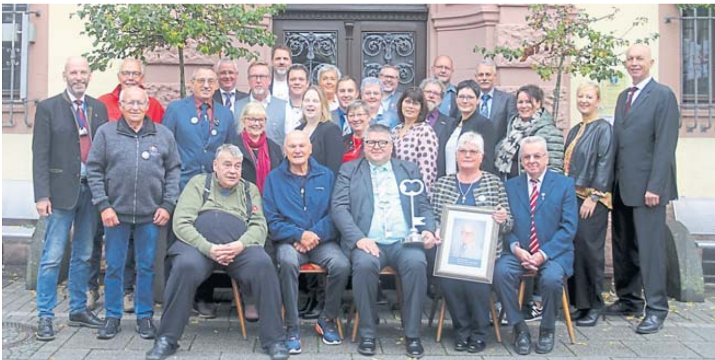
Das obligatorische Gruppenfoto der Kalte-Markt-Präsidenten.