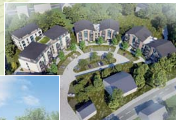
Vogelperspektive ELMLAND1 Unverbindliche Darstellung / Illustration