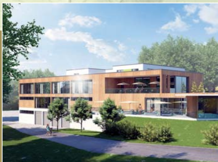
Das neue GESUNDHEITZENTRUM im ELMLAND1 in Schlüchtern Unverbindliche Darstellung / Illustration