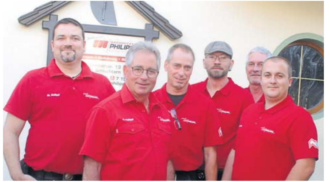
Der Dachdeckerbetrieb Philippi – hier das Team – feierte 75-jähriges Bestehen.