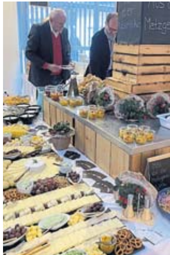
Ob die Steinauer Gäste am Buffet wirklich eine doppelte Portion bekamen?

SCHLÜCHTERN – Die Miniatur-Ausgaben von Landrat Thorsten Stolz, Bürgermeister Matthias Möller und Erstem Stadtrat Reinhold Baier, die ihnen wie aus dem Gesicht geschnitten waren, machten