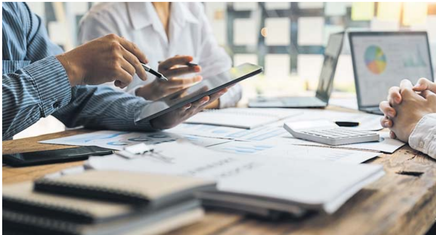
In knapp einem Drittel der Job-Angebote ist „Teamfähigkeit“ gefragt.