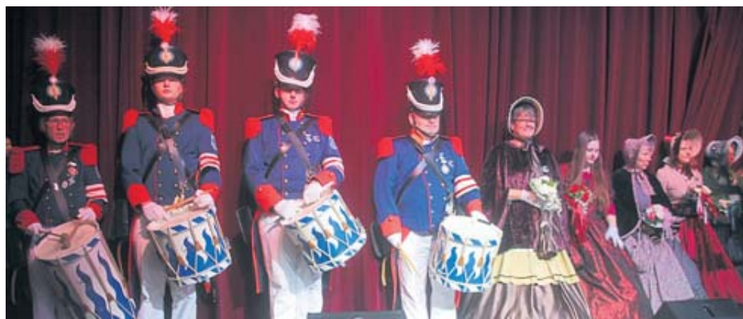
Bürgergarde und Biedermeiergruppe standen Spalier.