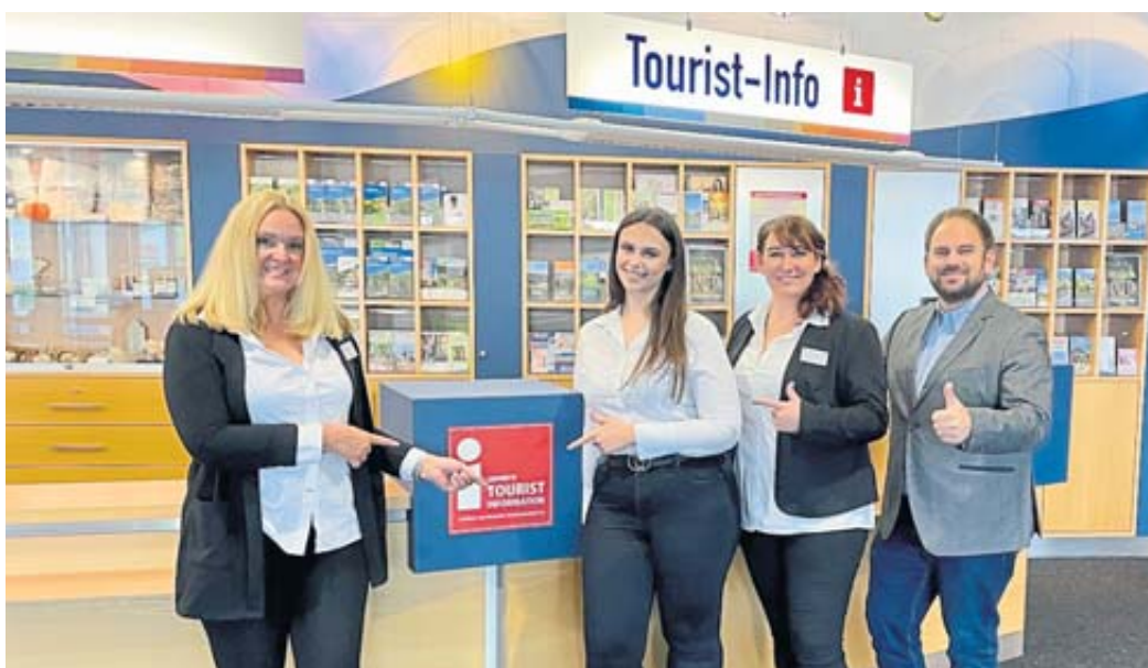
Die Tourist-Information des Heilbades ist erste Anlaufstelle für Gäste.