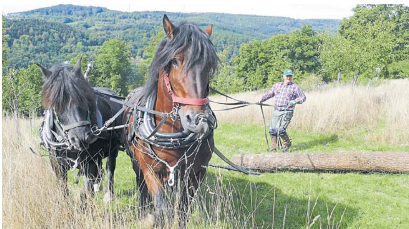
Zugpferde können beim Pflügen oder Holzrücken eingesetzt werden.

„Der Landschaftspflegeverband setzt sich für die Erhaltung einer vielfältigen Kulturlandschaft ein. Dazu braucht es engagierte Personen sowie die geeignete Technik. Was wir benötigen, sind Maschinen und Arbeitsverfahren, die der Landschaft angepasst sind – und was wir nicht wollen ist, dass sich die Landschaft immer mehr den