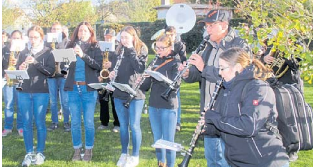
Die Stadtkapelle umrahmte die „Ausgrabung“ musikalisch.