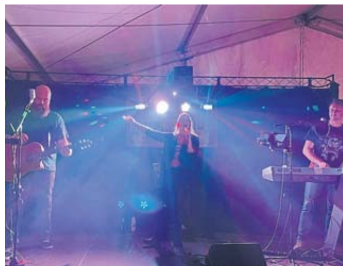
Die Band 360 Grad erfreut das Publikum unter anderem mit dem Lied „Simply the Best“.