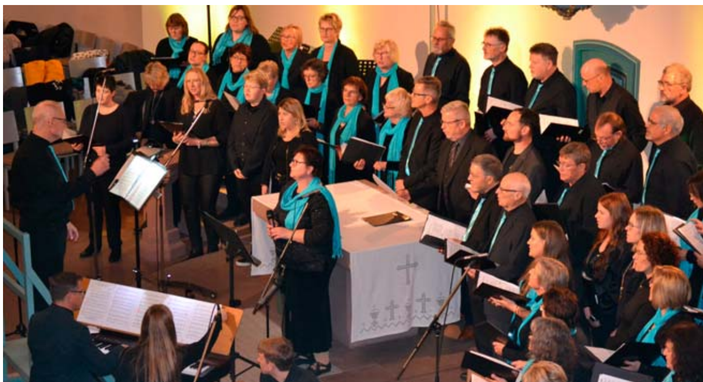
Das Publikum erlebte einen musikalischen Mix aus Jung und Alt.