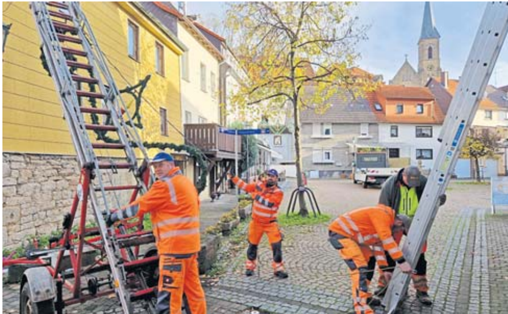
Die Bediensteten des städtischen Bauhofs haben bereits die Weihnachtsbeleuchtung im Stadtgebiet von Bad Soden-Salmünster für die anstehende Weihnachtszeit aufgehängt.

Mit der diesjährigen Strompreissteigerung würde bei gleichem Umfang der Auf-