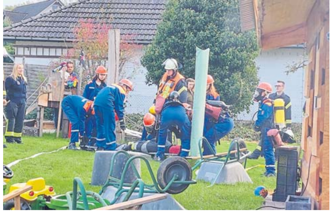
Personenrettung und Brandbekämpfung: Eine von etlichen Übungen am Berufsfeuerwehrtag der Jugendfeuerwehr Salmünster.