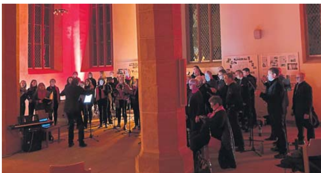
In mystisches Licht getaucht: Die Sängerinnen und Sänger des Grimm-Misch-Chores in der Katharinenkirche.