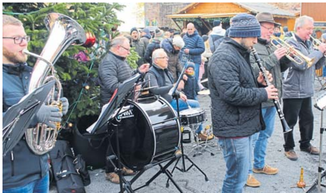
Mehrere Klangkörper sorgten für weihnachtliche Musik.