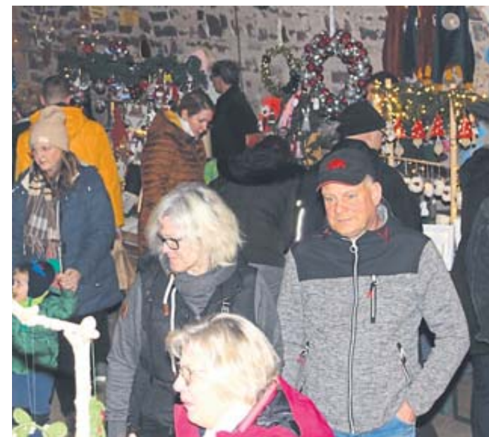
Im historischen Keller des Marstalls gab es viele Stände mit weihnachtlichen Artikeln.