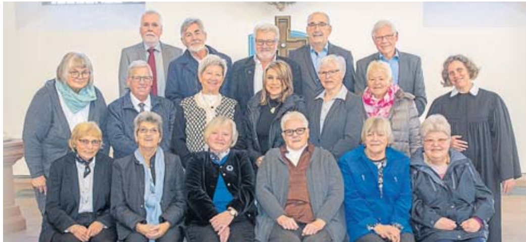
60 Jahre nach ihrer Einsegnung feierten diese Damen und Herren ihre Diamantene Konfirmation.