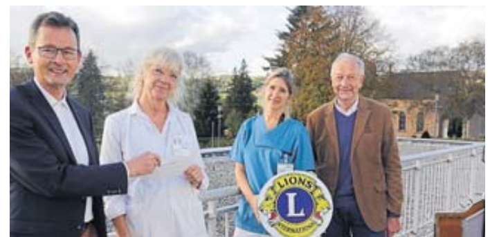
Der Vorstand des Lions Clubs Schlüchtern-Bergwinkel übergibt 1.500 Euro an das Team der Palliativstation.