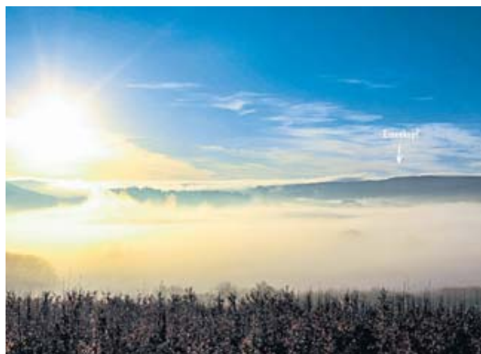
Herbststimmung – Blick auf die Region des geplanten Kulturwegs bei Steinau.

ROMSTHAL – Die nächste Sitzung des Ortsbeirates Huttengrund findet am Mittwoch, 7. Dezember, ab 19 Uhr in der Huttengrundhalle in Romsthal statt. BWB