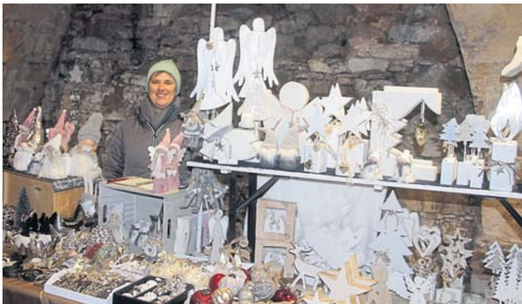
Engel in Weiß im Kellergewölbe des Schlosses.