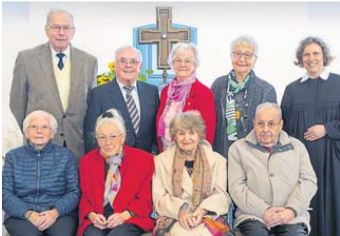
In einem Gottesdienst in der Steinauer Reinhardkirche feierten diese Männer und Frauen ihre Gnadenkonfirmation.