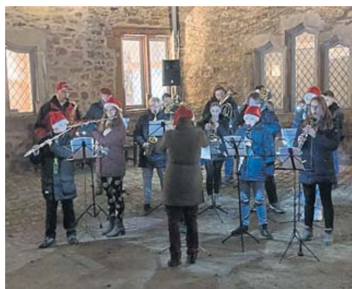
Mit weihnachtlichen Weisen begleitete das Jugendorchester des Musikvereins Germania die Markteröffnung.