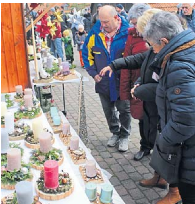
Alles was man in der Adventszeit benötigt, konnte bestaunt und gekauft werden.

Naturgemäß war auch eine Vielzahl weihnachtlicher Artikel im Angebot, so etwa Adventsgestecke und Kerzen. Wer noch auf der Suche nach einem Weihnachtsgeschenk war, konnte gut fündig werden. Schmuck gab es in allen Variationen, ebenso Töpfereiartikel, Korb- und Lederwaren sowie vieles andere. Zu finden waren Handarbeiten aller Art, insbesondere Gestricktes und Gebasteltes. An der einen und anderen Stelle konnte man den Künstlern, wie Korbflechter oder Bildhauer, über die Schulter schauen und die hohe Handwerkskunst bestaunen.