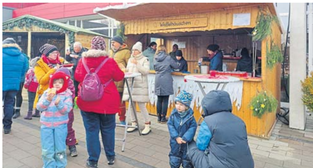
Weihnachtlich dekorierte Stände gruppierten sich um den Salinenplatz.

Während am Samstagabend die Glühweinparty mit den „Nachtschwärmern“ viele Besucher anzog, herrschte am frühen Sonntagabend geselliges Beisammensein an den Außenständen, und in der Mitte drehte das Karussell mit den Kindern noch in der Dunkelheit seine Runden. PK