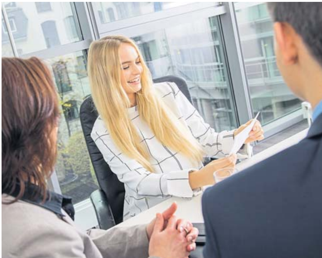
Einen neuen Job muss man nicht unbedingt zum Jahresanfang antreten – auch wenn es zu dem Zeitpunkt häufig viele offene Stellen gibt.

Selbst wenn Beschäftigte in der Reflexion feststellen, dass sie wirklich unzufrie-