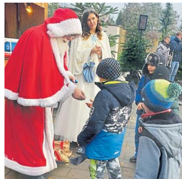
St. Nikolaus beschenkte die Kinder.