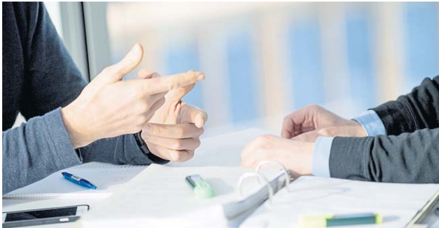
Möchten Beschäftigte eine Gehaltserhöhung, sollten sie davor ihre Hausaufgaben gemacht haben und ihren Marktwert kennen.