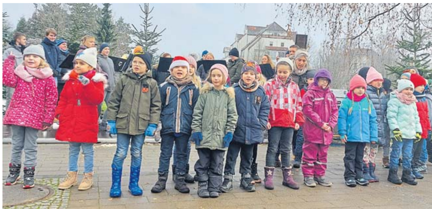
Zur Markteröffnung sangen die Kinder der Grundschule Weihnachtslieder.