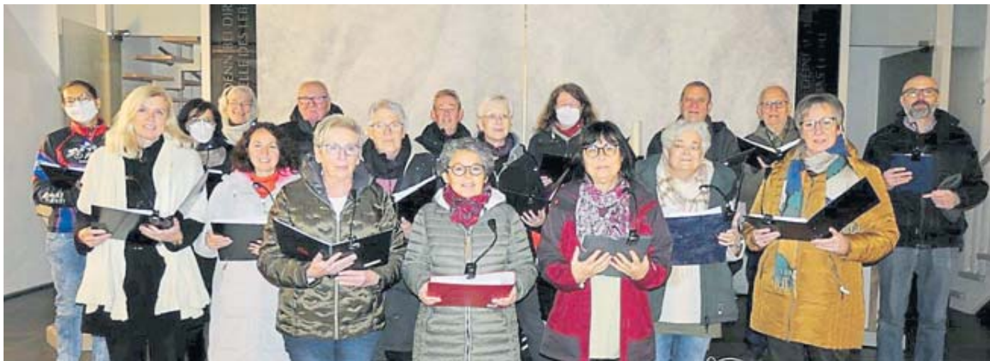
Der Kirchenchor der evangelischen Christugemeinde lädt für den ersten Weihnachtsfeiertag zu einem musikalischen Gottesdienst ein.

STEINAU – Die Wanderer des VHC Steinau unternehmen am Sonntag, 18. Dezember, eine Jahresabschlusswanderung mit Einkehr im Wanderheim im Ohl. Treffen ist um 13 Uhr am Schlossparkplatz in Steinau, wo die circa 8 Kilometer lange Wanderung beginnt. BWW