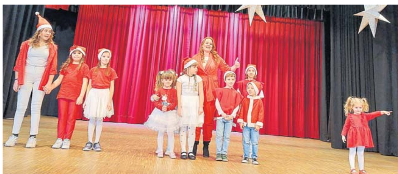
Die ukrainische Tanzgruppe „Lalila“ bedankte sich mit einem Weihnachtstanz für die Unterstützung.