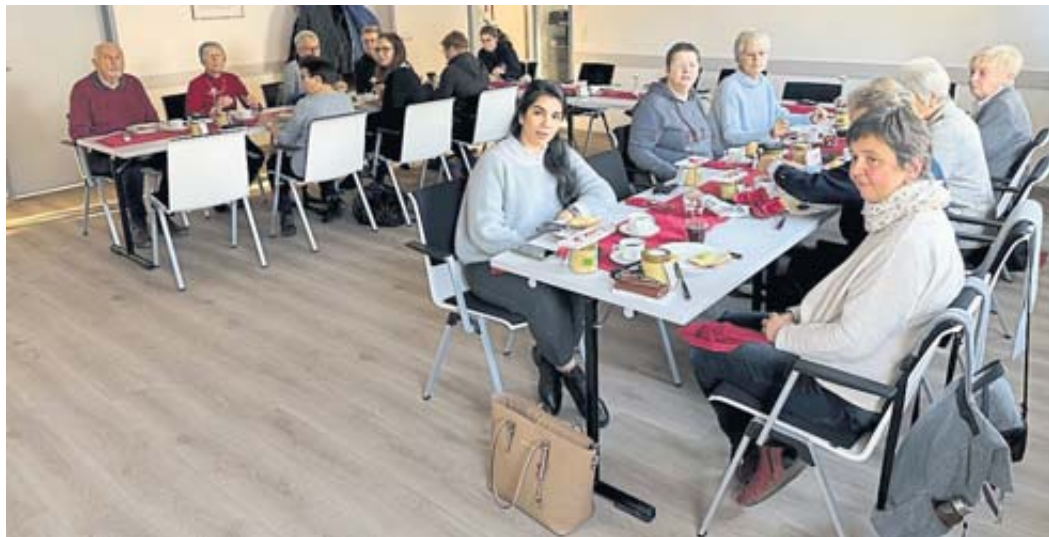
Zu einem gemeinsamen Frühstück trafen sich alle, die im DRK-Kleiderladen ehrenamtlich tätig sind.