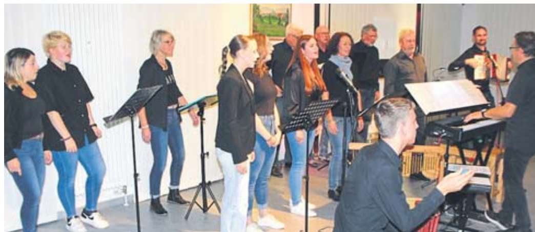
Der Chor Calypso der Chorgemeinschaft Kressenbach/Uerzell gefiel mit modernem Liedgut.