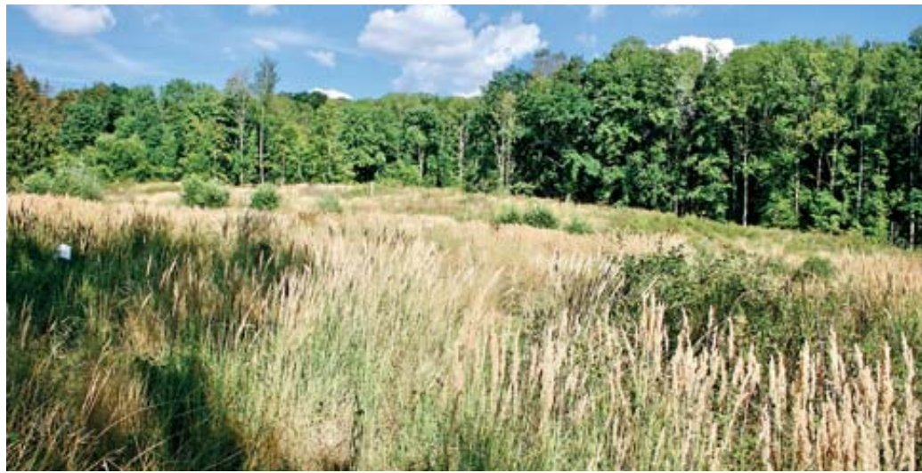
Die Forstfläche am Drasenberg. Noch muss man genau hinsehen, will man die grünen Stecklinge zwischen der ausgetrockneten Nebenvegetation entdecken.

Schlüchtern und der Ökologischen Forschungsstation Schlüchtern (ÖFS). Und siehe da, wie erwartet: Trotz Rekordhitze und der anhaltenden Dürre stehen die meisten der Setzlinge gut da.