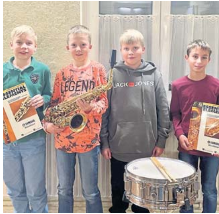
Freude über junge Musiker