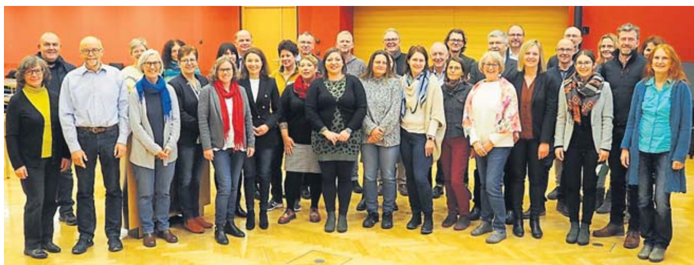
Lehrgangsteilnehmende, das Projektteam von „Main.Kinzig.Blüht.Netz“ sowie Vertreterinnen und Vertreter der Kommunen und des Landschaftspflegeverbandes MKK nahmen an der Zertifikatsverleihung teil.