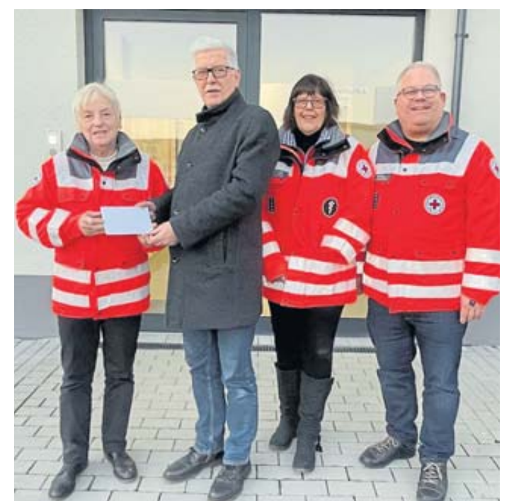
Kalte-Markt-Präsident dankt DRK