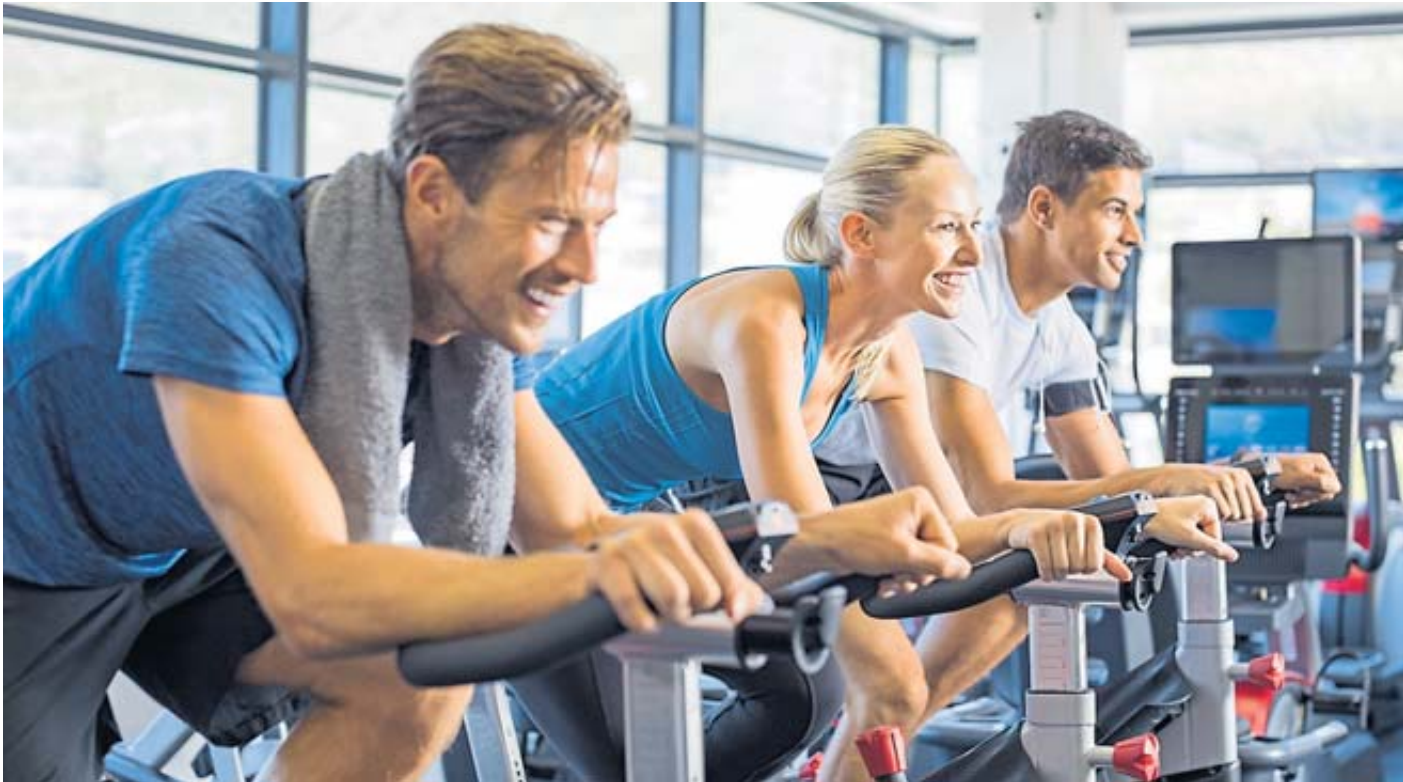
Indoor Cycling ist für Einsteiger geeignet und bietet eine hohe Motivation.