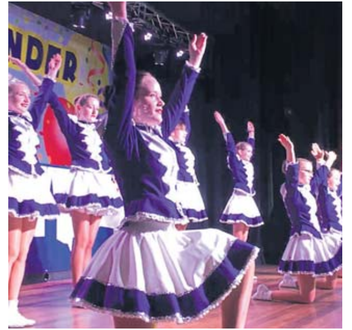
An Gardetänzen dürfen sich die Gäste bei den beiden Fremdensitzungen der „Spätzünder“ erfreuen.

Nach dem Lindwurm findet traditionell in der Stadthalle die Umzugs-Party statt. Dort wird weiter mit Faschingsmusik unterhalten, so dass die gute Stimmung keinen Abbruch erleidet. Dazu werden Getränke und Speisen gereicht. BWB