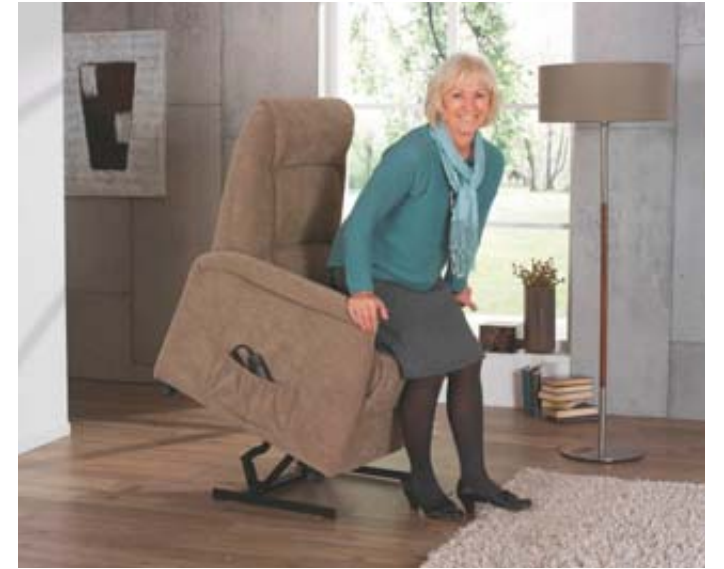
Für Menschen, denen das Aufstehen schwerfällt, hat Möbel Laibach die passenden Lösungen, wie hier einen Sessel mit Aufstehhilfe.

Gerade in Zeiten, in denen man wochenlang aufs eigene Zuhause angewiesen war, ist deutlich geworden: Wer es gemütlich hat, ist klar im Vorteil. Möbel Laibach in Hünfeld bietet Qualitätsmöbel für die Wohnbereiche Essen, Schlafen, Wohlfühl-Wohnen an. Sie stammen überwiegend aus deutscher Produktion. Hohe Standards sind aus diesem Grund in allen Bereichen gewährleistet.