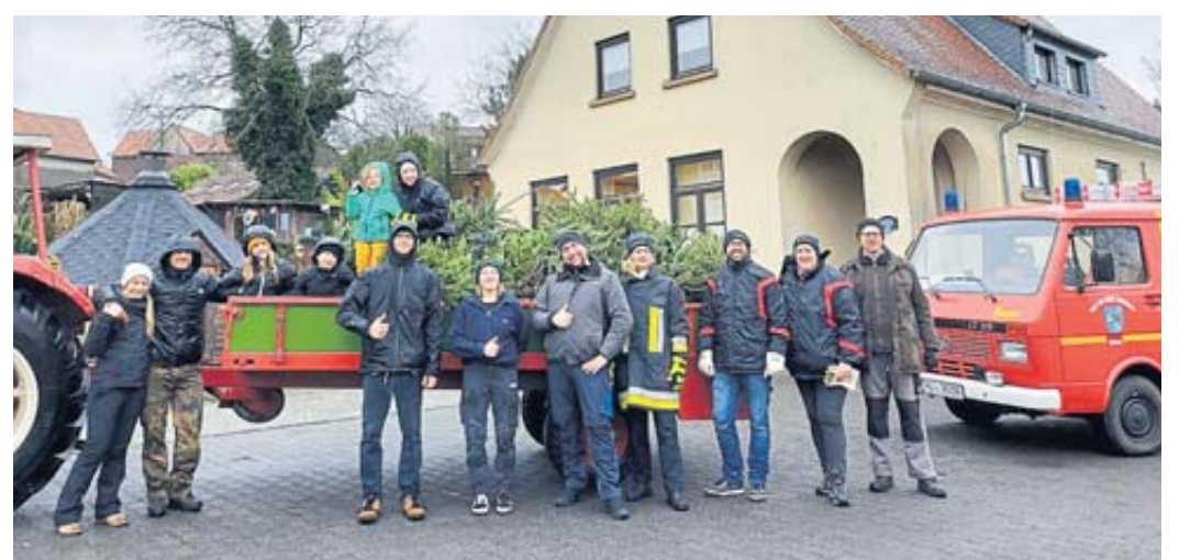
In weniger als einer Stunde hatten die Feuerwehrleute die 48 ausgedienten Weihnachtsbäume in Alsberg eingesammelt.