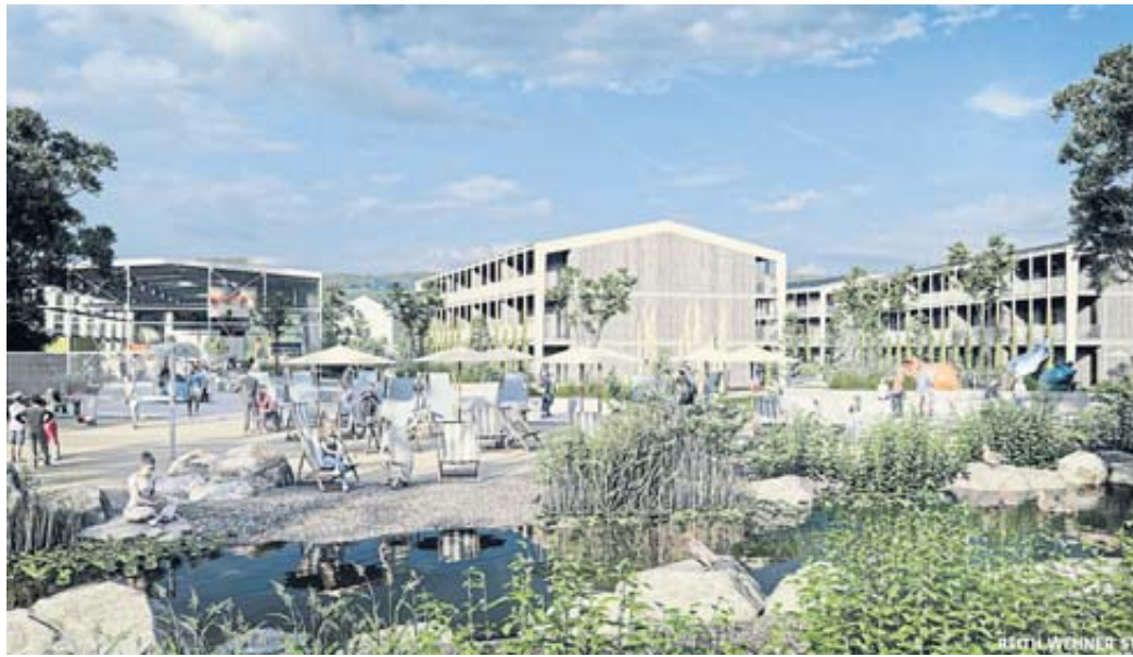
Nach den aktuellen Plänen sollen auf dem Vogt-Areal zahlreiche Wohnungen entstehen. Hier der Blick vom Kinzigstrand her. Illustration: Stadt Schlüchtern

Die neuen Wohngebäude sollen die modernsten ökonomischen und ökologischen Standards erfüllen. Die Errichtung eines Hackschnitzelkraftwerks zur Versor-