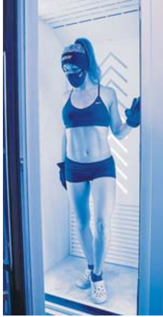
Sportler aus ganz verschiedenen Bereichen schwören auf die leistungssteigernde und schmerzlindernde Wirkung vor und/oder nach dem Training.

Die Ganzkörper-Kälteanwendung (GKKA) im Medizin-, Sport- und Gesundheitsbereich: Was sie kann, wem sie nutzt, darüber klärt Galileo Physiotherapie auf. Der Gesundheitstrend „Ganzkörper-Kältekammer“ (GKKK) setzt sich jetzt auch in Deutschland durch und begeistert - Profi- und Amateursportler gleichermaßen. Aber nicht nur im Sportbereich, sondern auch in Medizin und Wellness sind Menschen von der Wirkung überzeugt. Galileo Physiotherapie erklärt, woran das liegt. In einer Kältekammer wird für zwei bis drei Minuten der gesamte Körper einer Temperatur von -110^{\circ} Celsius ausgesetzt. Dabei trägt man nur Unterwäsche, Mütze, Handschuhe und Schuhe. Wer jetzt in Gedanken schon bibbert, sei beruhigt: Unser Gehirn empfindet ein Bad im Tauchbecken nach der Sauna als unangenehmer, denn Kälte wird durch Wasserkontakt einfach viel stärker wahrgenommen. Aber in der Kältekammer, auch liebevoll „Eisbox“ genannt, steht man mit trock-