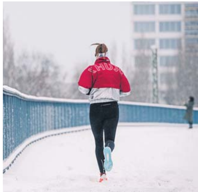
Bitte nicht zu warm: Wer im Winter beim Laufen zu viel schwitzt, dem wird danach ordentlich kalt.

Spätestens wenn das Thermometer unter die Marke von minus zehn Grad fällt, ist daher sein Rat: Mund und Nase mit einem Tuch oder Schal bedecken. Denn das befeuchtet und wärmt die Luft, die man dann einatmet.