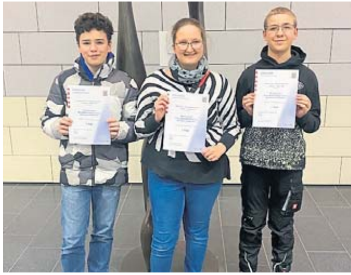
Drei junge Nachwuchskemiker der Henry-Harnischfeger-Schule freuen sich über ihren Erfolg.