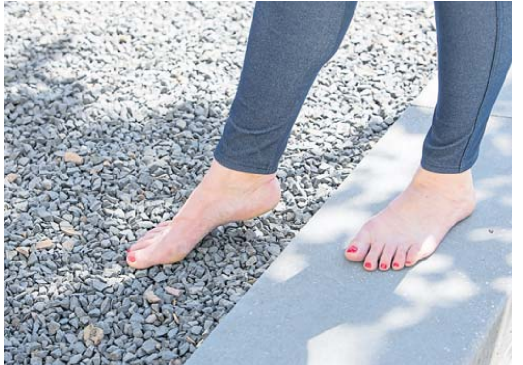
Auch wenn es unter den Sohlen etwas piekelt: Barfuß zu laufen tut der Fußmuskulatur gut.