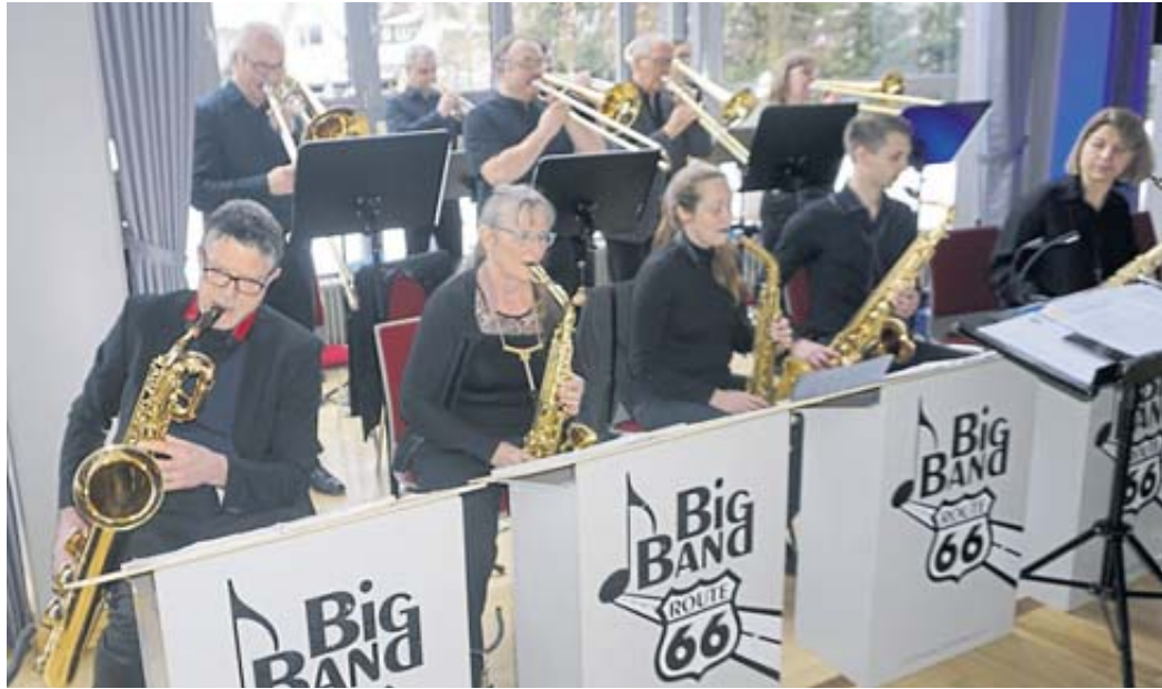
Die Big Band Route 66 umrahmte den Empfang musikalisch.