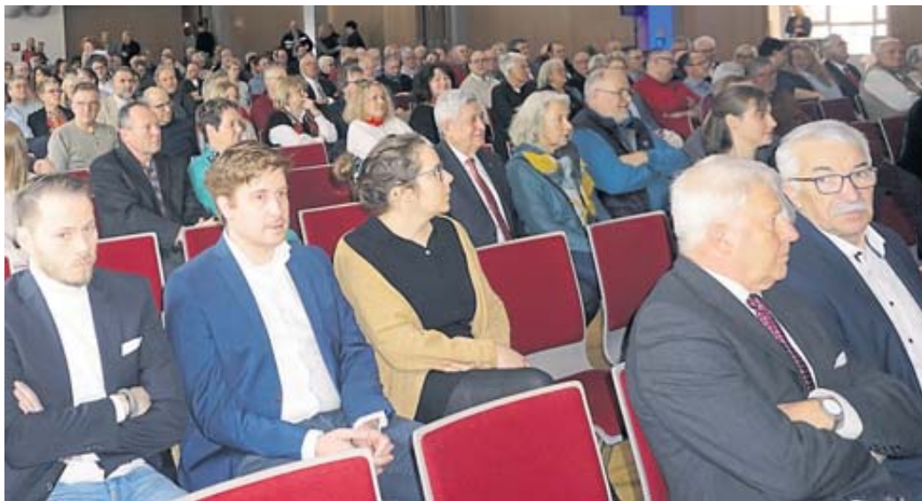
Gut 300 Gäste waren der Einladung in Schlüchterns „Gutt Stubb“ gefolgt.