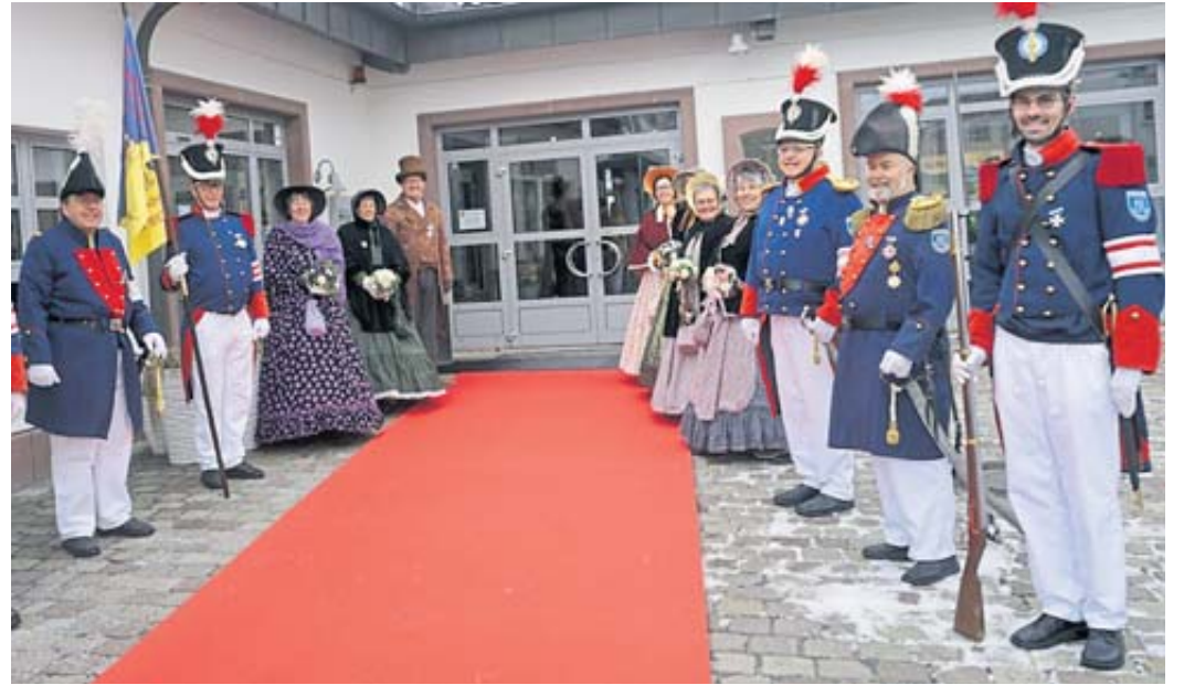
Bürgergarde und Biebermeiergruppe standen vor der Stadthalle Spalier.