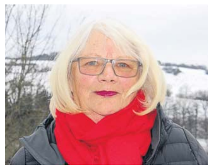
Letztmals unter dem langjährigen Vorsitz von Inge Vey hat die Elmer Vereinsgemeinschaft die Jahresplanung herausgegeben.

ganz im Zeichen des höchsten Elmer Dorffestes: die Kirches in der Zeit vom 27. bis 30. Oktober. Zu feiern ist in diesem Jahr auch ein Jubiläum: Die Elmer Kirche besteht seit 125 Jahren. Zudem steht das Erntedankfest der Kirchengemeinde am 6. Oktober auf dem Plan sowie das Martinsfest zusammen mit dem Kindergarten am 10. November. Einen Apfelmart richten die Naturschutzfreunde am 8.