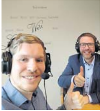
Amtsinhaber Thorsten Stolz (rechts) , hier im Bild mit Podcaster Sebastian Buch, wurde 2017 zum Landrat des Main-Kinzig-Kreises gewählt. Der SPD-Politiker tritt am Sonntag zur Wiederwahl an.