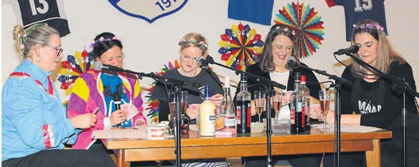
Viel Spaß bereiteten die durstigen „Hugo-Damen“ dem Publikum mit Klatsch und Tratsch bei ihrem feucht-fröhlichen „Rommé-Abend“.