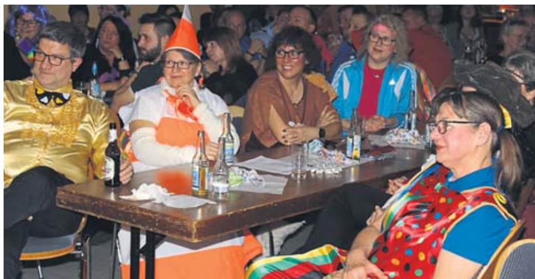
Unter den Besuchern im vollbesetzten Gemeinschaftshaus waren viele kostümierte Gäste.

Tradition bei den Elmer Bunten Abenden hat der Auf-